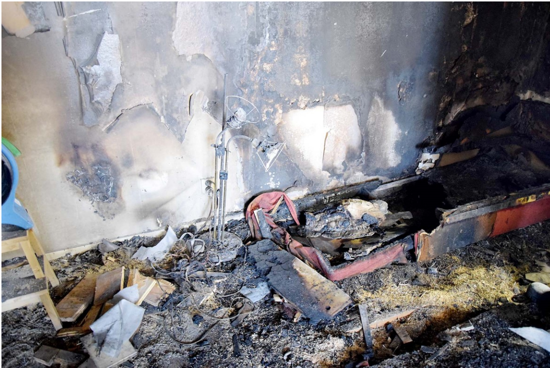
Vägguttag, lampa och kablar i rekonstruerat primärt brandområde.

Vid brandplatsundersökningen konstaterades ett primärt brandområde i soffans vänstra del. Denna del var i det närmaste helt bortbränd med avtagande skador mot soffans högra del. Till vänster om soffan stod en golvlampa och på väggen fanns ett vägguttag till vilket två grenkontakter troligtvis har varit anslutna. I resterna av soffan anträffades en braständare. Ytterligare en braständare anträffades i brandrester intill soffan. Där påträffades även en tredje grenkontakt.