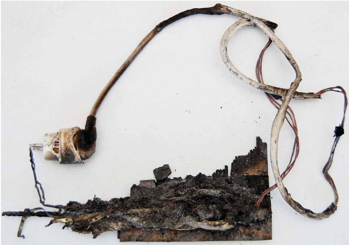
Grenkontakt, nedsmält i resterna av laminatgolvet, ansluten i jordad uttagsplugg.

Grenkontakterna skickades till NFC 3 på analys. Av analyssvaret framgår att elfel kan uteslutas.