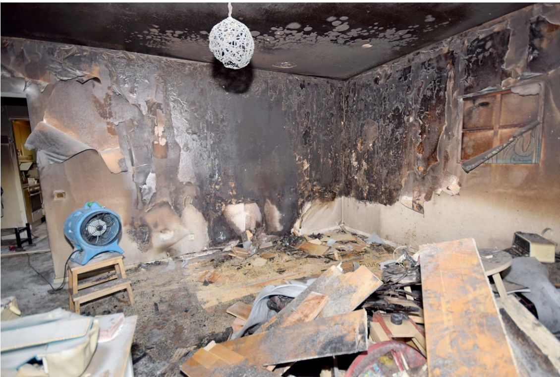
Vardagsrum, frilagt primärt brandområde.