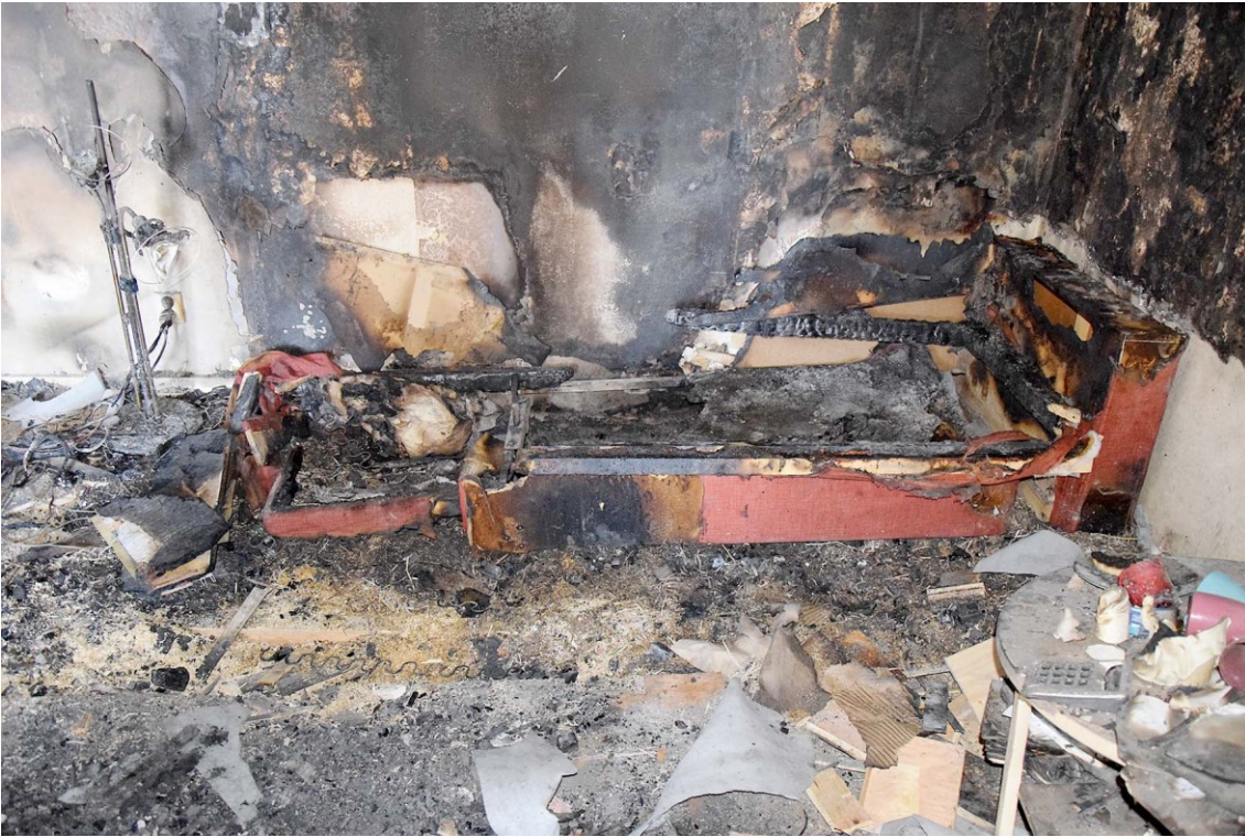
Vardagsrum, utbränd soffa (rekonstruerat primärt brandområde).