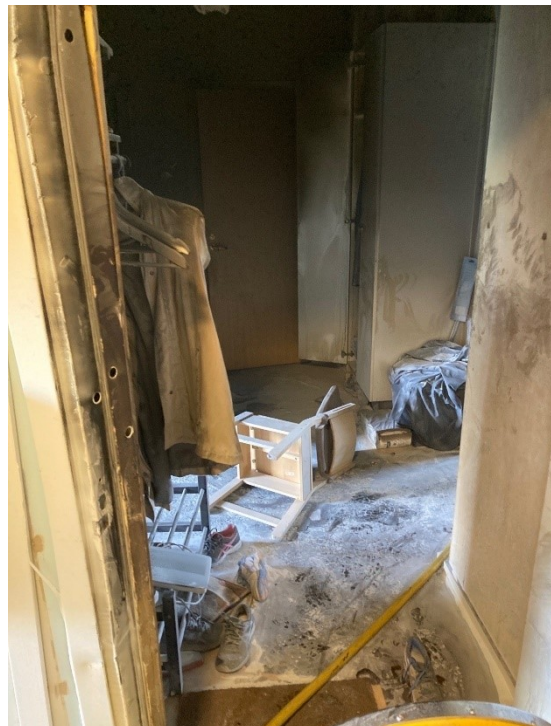
Hall, vy från lägenhetsdörr.