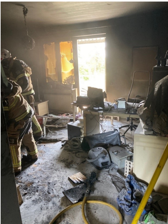
Vardagsrum, vy från hall.

Utöver den branddrabbade lägenheten uppkom inga brand- eller rökskador i angränsande lägenheter.