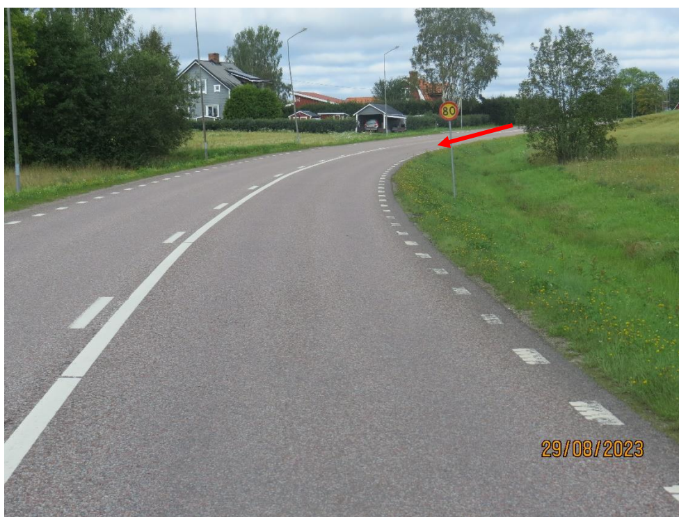
BILD 1: Röda pilen visar från vilket håll personbilen kom körandes.

Vägbanans beläggning är asfalt, det fanns inga hål, ojämnheter eller annat i vägbanan som bedöms haft någon inverkan på olyckan. Vägmarkeringar i form av vita vägstreck var i gott skick. (se bild 1).