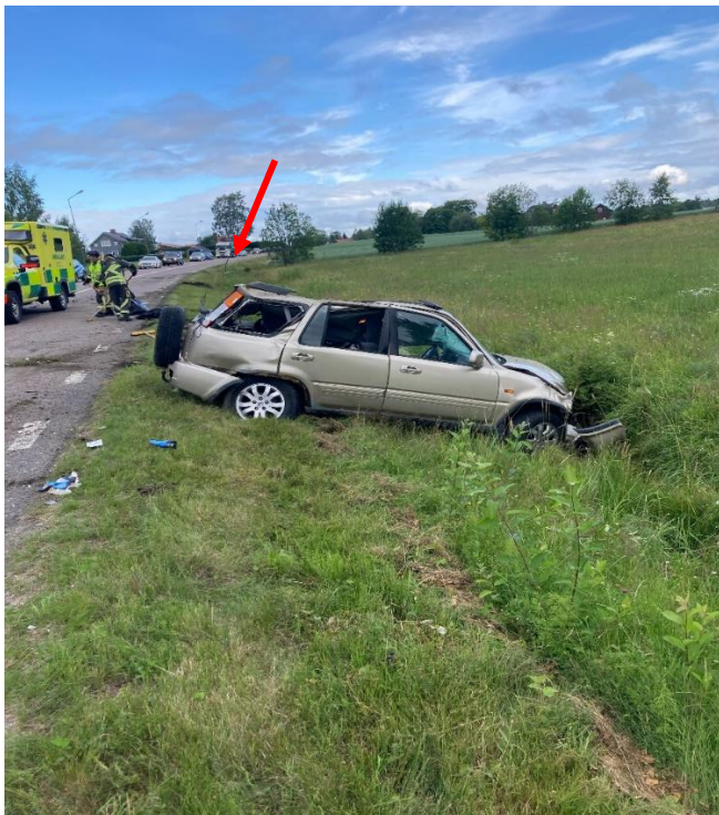
Bild 3: Visar fordonets slutliga läge och i bakgrunden syns islagsplatserna efter voltningen i diket. Röda pilen visar var avåkningen började.