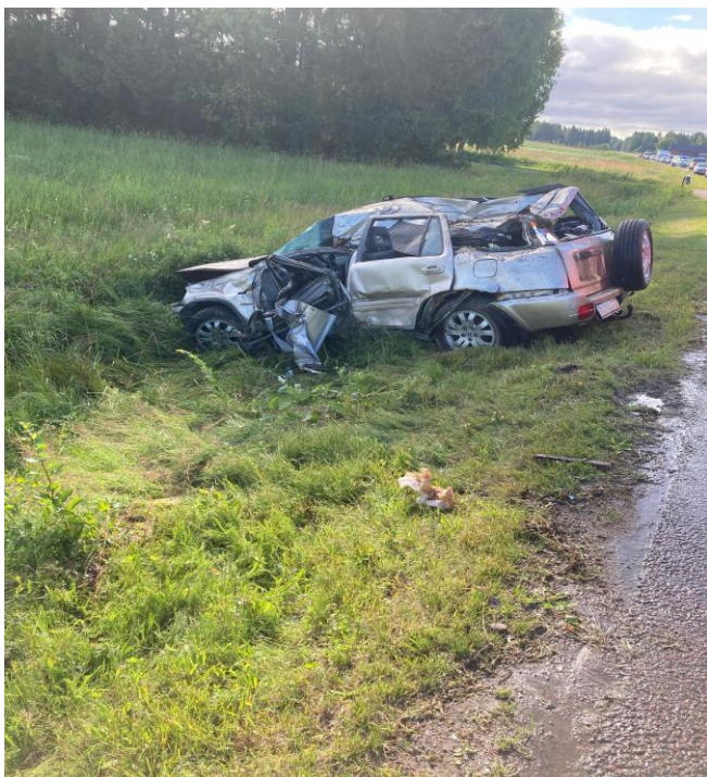
Bild 4: Visar förarplatsen där föraren sitter fastklämd och de omfattande skadorna på bilen.