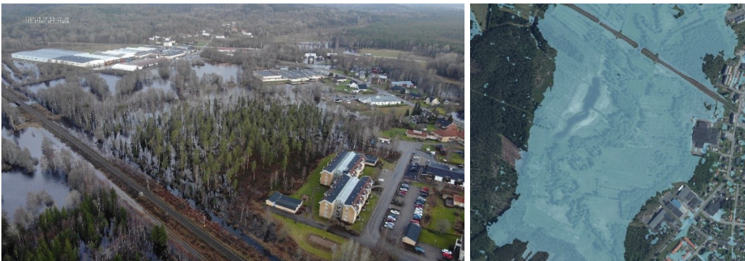
Figur 4: Översvämningsutbredningen kring järnvägen.