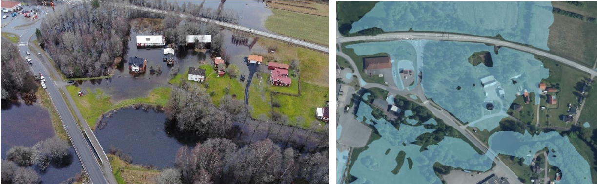
Figur 3: Översvämningsutbredning kring Björsgård.

Figur 3 och Figur 4 visar översvämnings utbredning enligt foton samt i modellen.