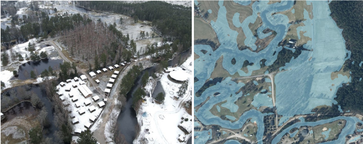
Figur 5: Översvämningsutbredningen kring High Chaparral.

Figur 5 visar översvämningsens utbredning enligt foto samt i modellen.