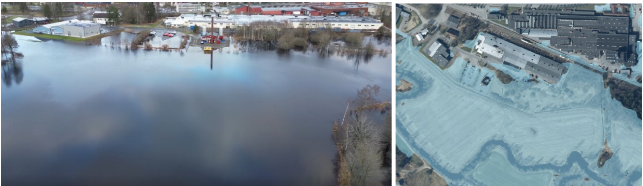
Figur 6: Översvämningsutbredning kring Galvanovägen.

Figur 6 visar översvämningsutbredningen kring Forsheda enligt modell och foto.