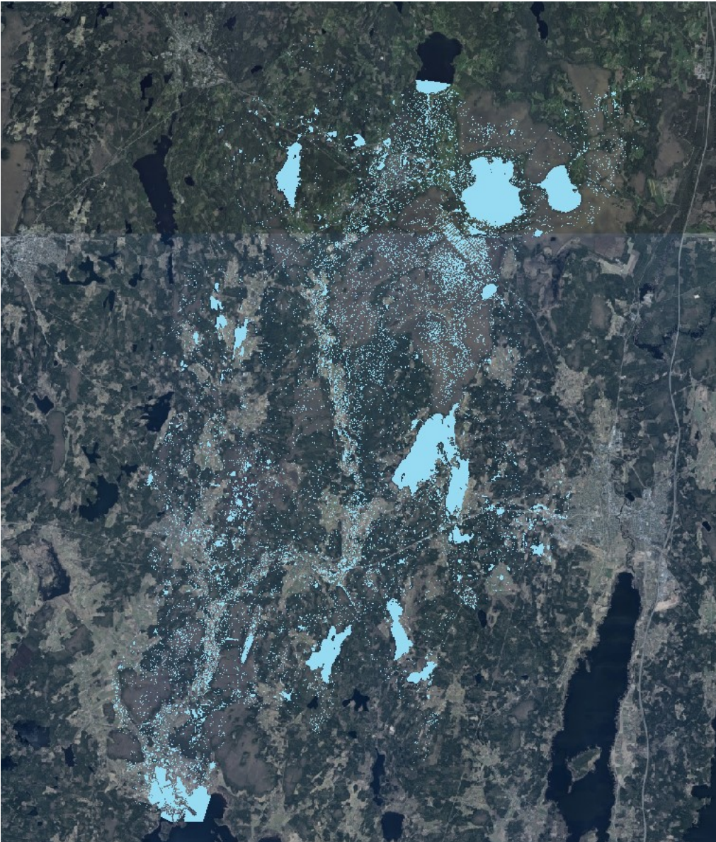
Figur 2: Modellerad översvämningens utbredning inom hela utredningsområdet till följd av höga flöden i Storan samt nederbörd och snösmältning.

Det sistnämnda skiktet är en kombination av de två ovan och är det som visas nedan.