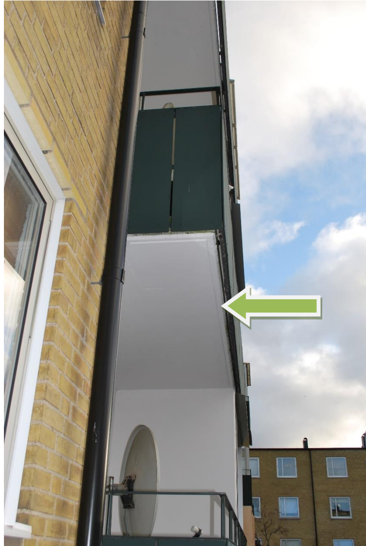
Balkong till (grannlägenhet) utan inglasning, tak av betong.