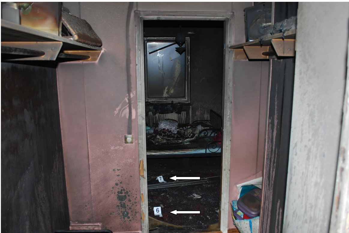
Sovrum där hunden markerat för brandfarlig vätska.