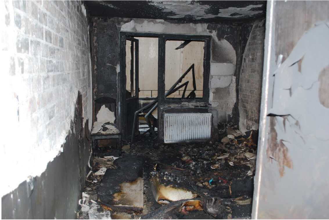
Vardagsrum och inglasad balkong.