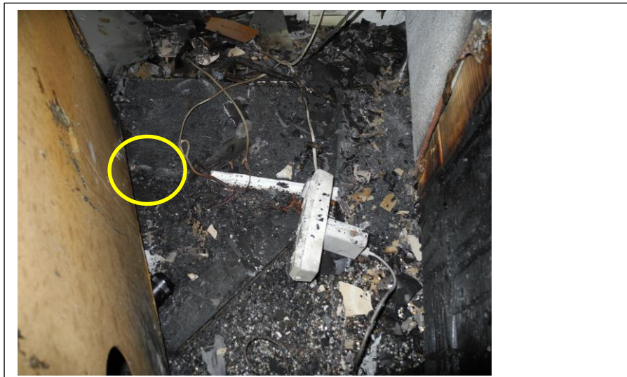
Bild 2 visar var sladden låg klämd och att mattan är helt uppbränd framför där nattduksbordet stod