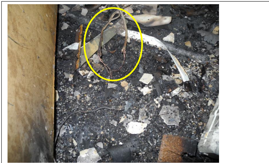
Bild 3 visar den avbrunna kabeln