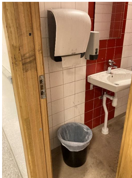
BILD 1: Gula cirkeln= primära brandstartsområdet. BILD 2: Visar likvärdigt utrymme