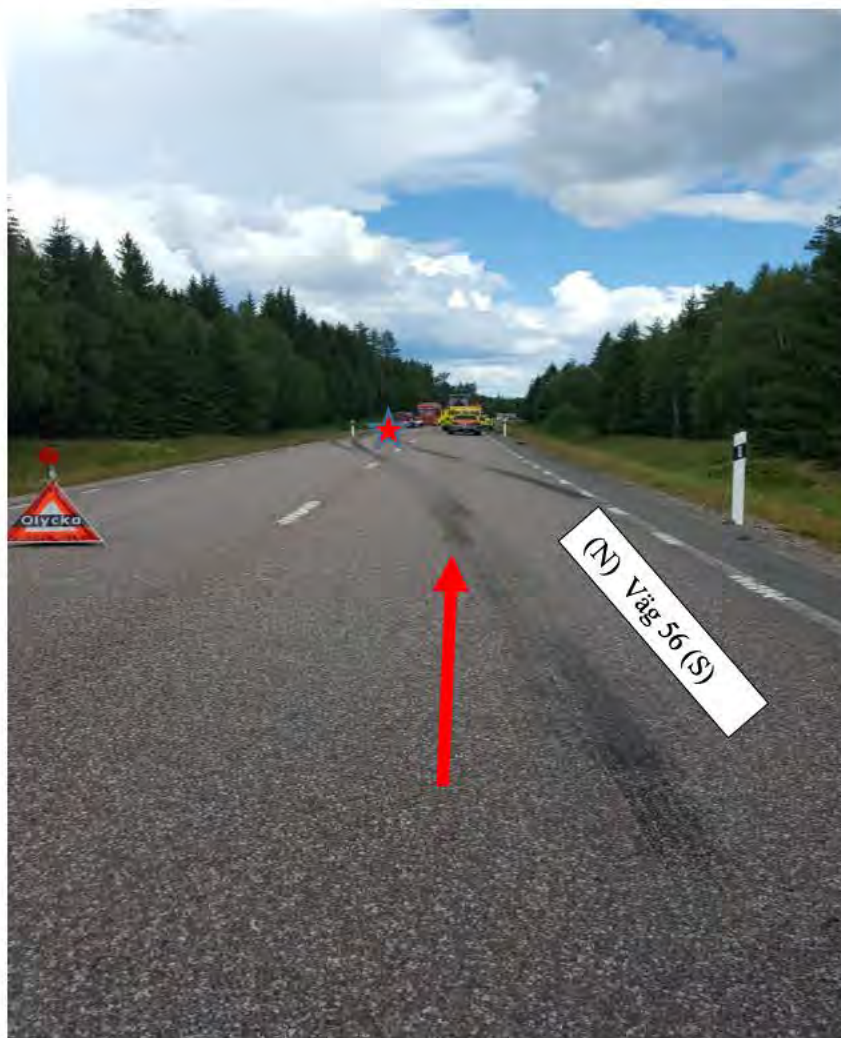
Bild 2: Röda pilen visar den väg motorcykeln kommer körande. Röda stjärnan visar kollisionenplatsen. Vita skylten visar (N) för norrut och (S) för söderut.

Efter kollisionen hamnar motorcykeln och föraren i diket. Motorcykeln ligger i höjd med kollisionenplatsen och föraren ligger ca 15 meter längre fram (N) (se bild 4). Skadorna på lastbilen visar att motorcykeln träffat den på vänster sida nedanför lastbilschauffören (se bild 5). Bromsspåren efter lastbilen visar också att den har klart legat i sitt södergående körfält precis vid kollisionenögonblicket (se bild 3).