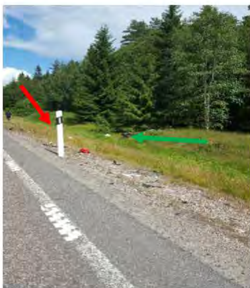
Bild 4: Röda pilen visar var mc föraren låg i diket. Gröna pilen visar motorcykelns placering i diket.