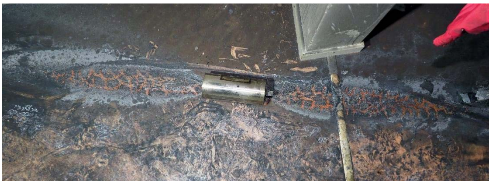
Visar brandskador i golvet efter släckgranaten