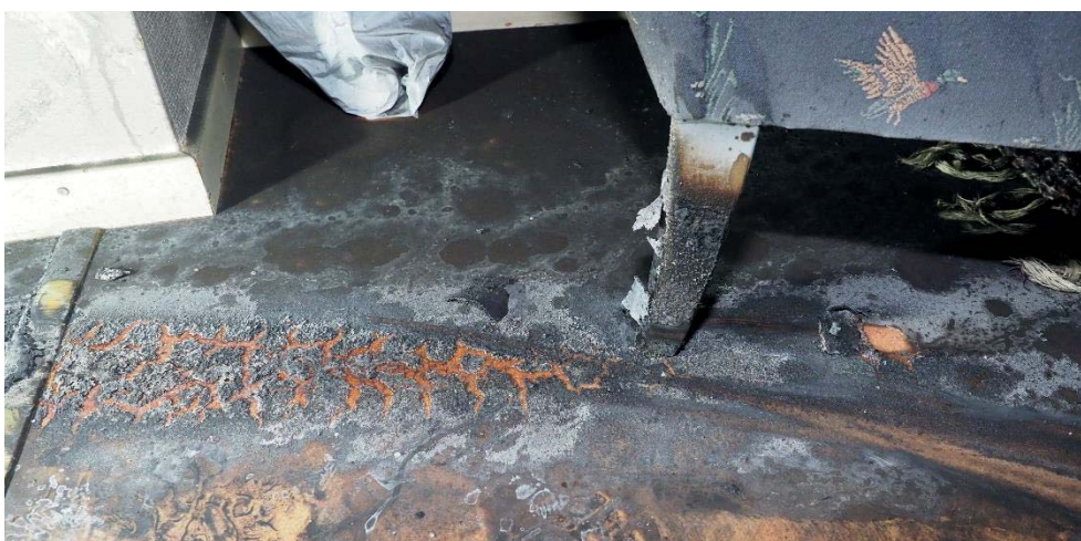
Brandskador på stol orsakade av släckgranaten

Rökspridningen från lägenheten bedöms ha varit begränsad. Det satt en avskiljande dörr (till synes äldre klass B30) mellan korridoren och lägenheten som har fungerat bra täthetsmässigt. Det mesta av röken som hamnat i korridoren har troligtvis tryckts ut i samband med att släckförsök gjorts samt när räddningstjänsten gick in i lägenheten.