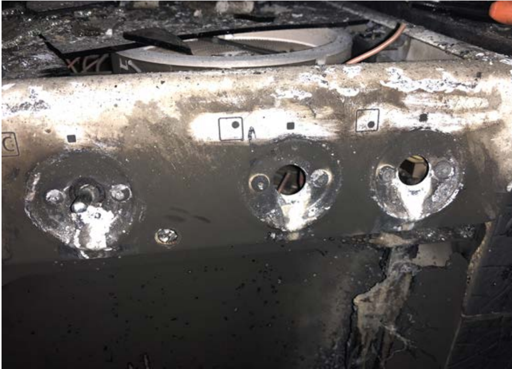
Bild 3. Knapp 3, 4 och 5.