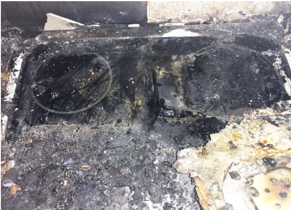
Bild 2. Övre vänstra plattan är ren efter att musikspelaren tagit bort. Den övre högra plattan är kraftigt bränd efter att delar av musikspelaren fastnat på plattan.