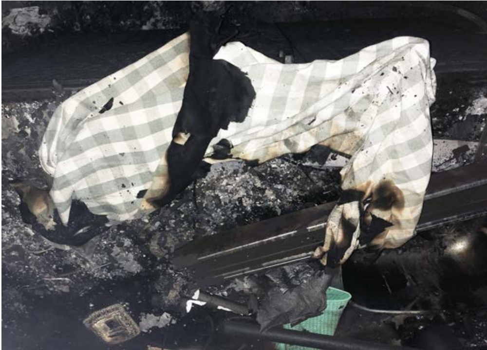
Bild 7. Handduken som låg på musikspelaren fattade eld. Hantverkaren drog bort den från spelaren.