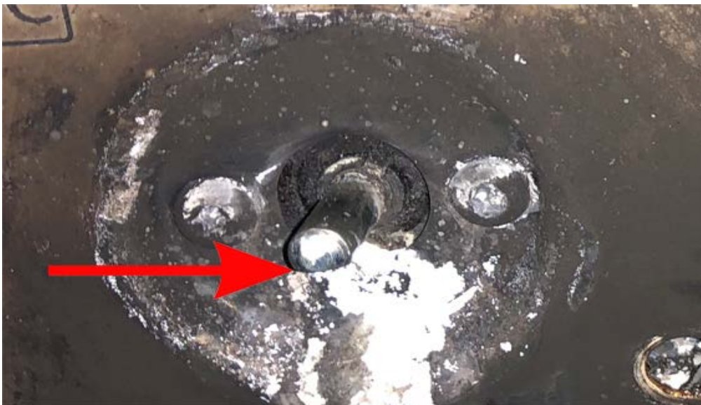
Bild 4. Platta del av axeln ska vara placerad nedåt vid ett avstängt läge.