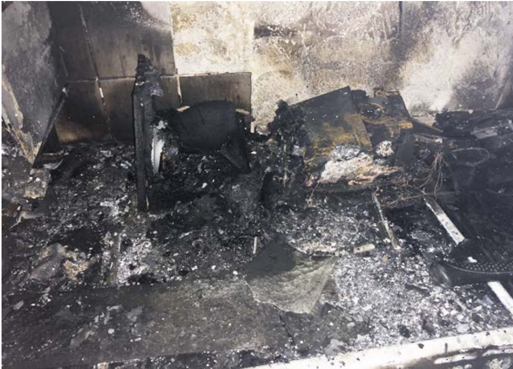
Bild 1. Musikspelaren är placerad på spishällen.