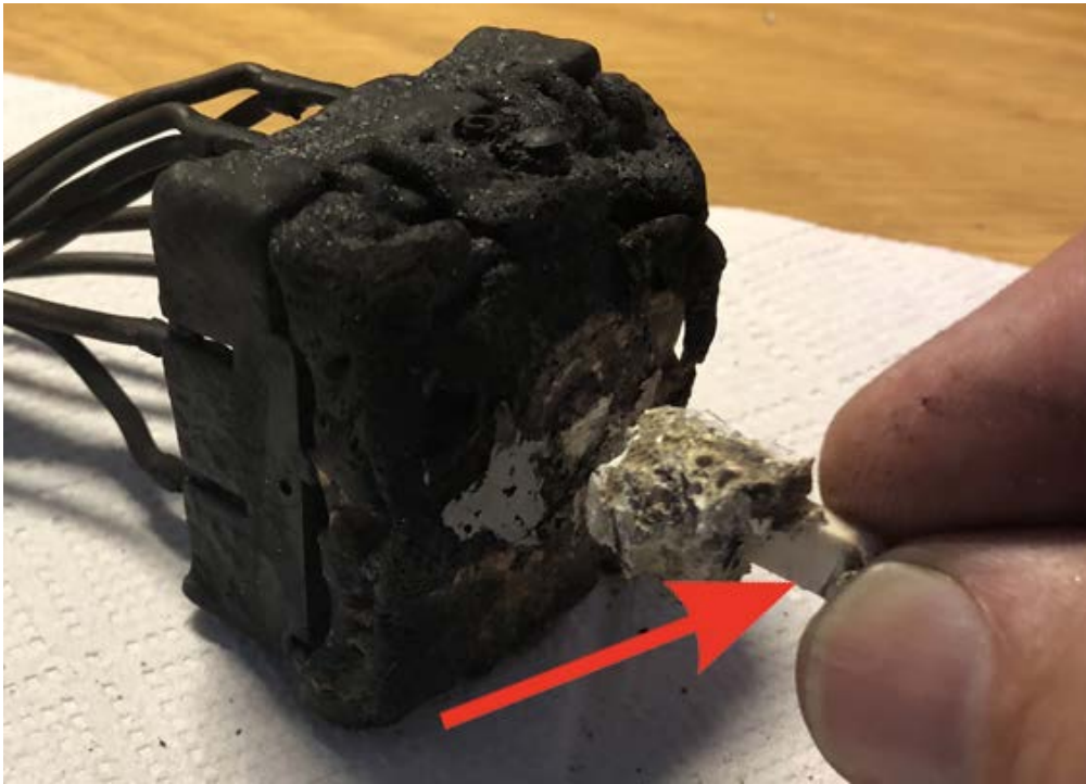
Bild 5. Den platta delen av axeln är placerad åt vänster i ett påslaget läge.