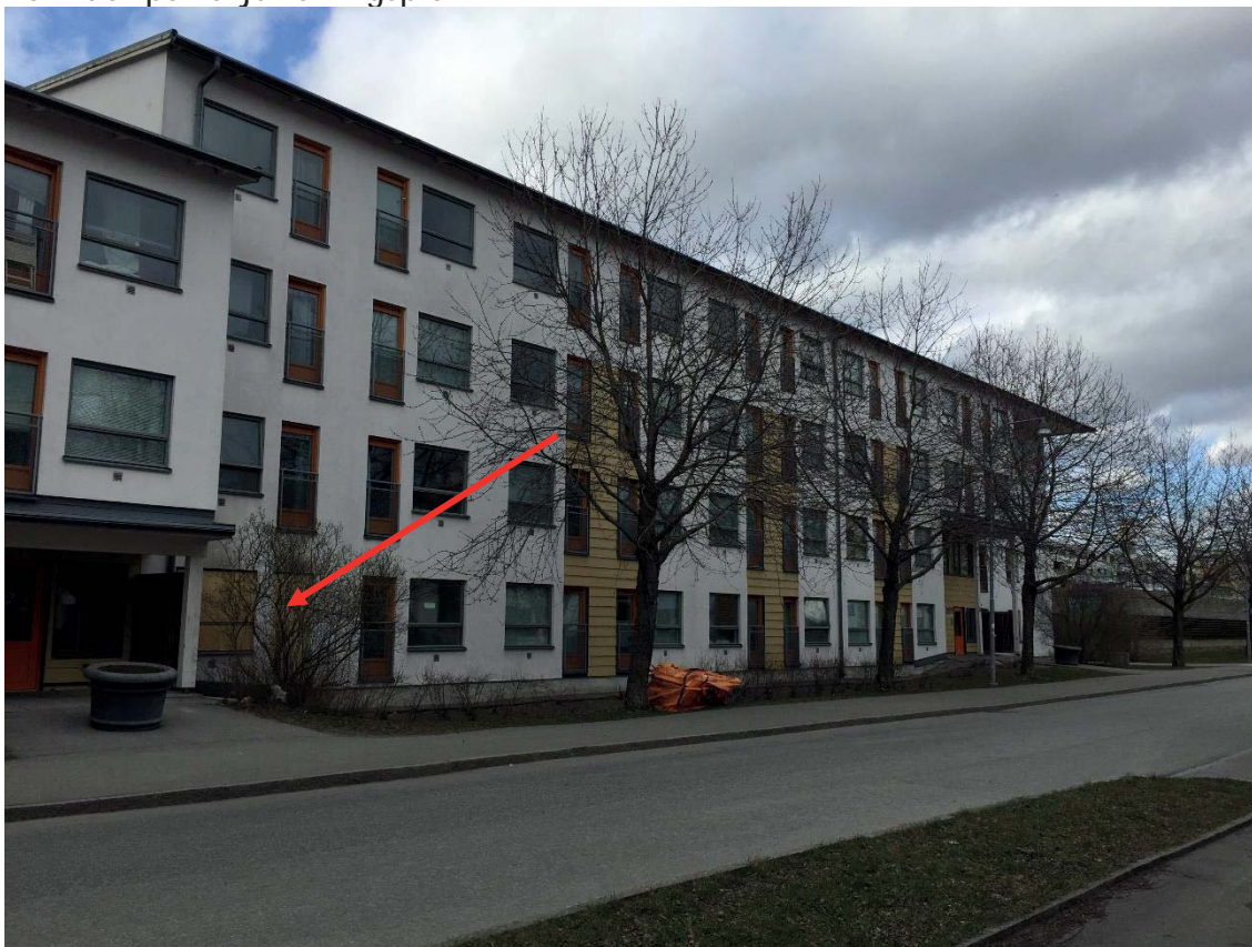
Bild SSBF och brandrum markerat med pil.

Byggnaden är uppförd i fyra plan och med boenderum som delar en gemensam korridor på varje våningsplan.