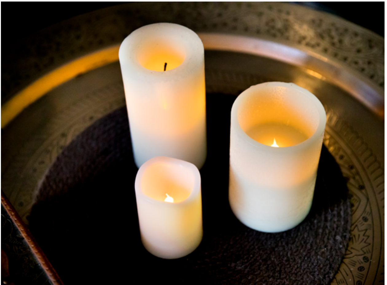
Ljus med batterier

Om en apparat har synliga skador, luktar bränt eller låter konstigt så kan det vara läge att byta ut den. Gamla glödlampor som blir väldigt varma kan ersättas med till exempel lågenergilampor, och levande ljus med batteriljus. Flertalet av dessa åtgärder bör övervägas hos alla, men särskilt hos personer som är riskutsatta.