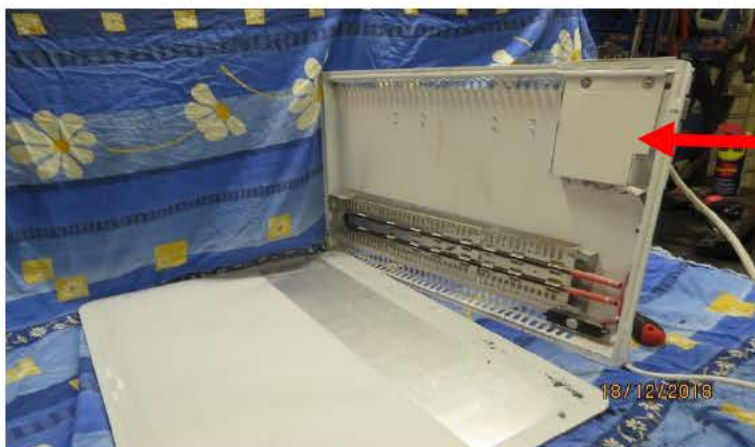
Bild 2: visar elementets insida och röda pilen visar var kretskortet sitter.