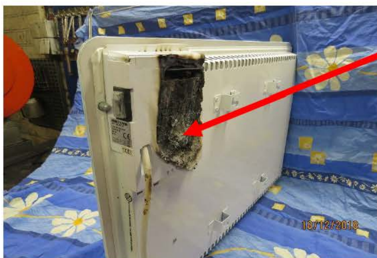
Bild 3: visar elementets baksida, plastkåpan som sitter över elektroniken, röda pilen visar det brända kretskortet.