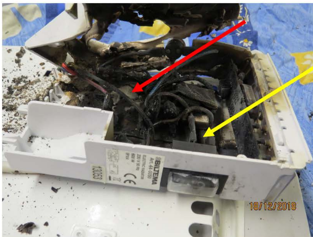
Bild 5: Röda pilen visar var genombränningen skett på kretskortets nedre del. Gula pilen visar området för inkommande el och elementets brytare.