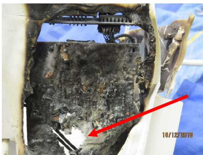
Bild 6: Pilen visar det genombrända området på kretskortets nedre del.