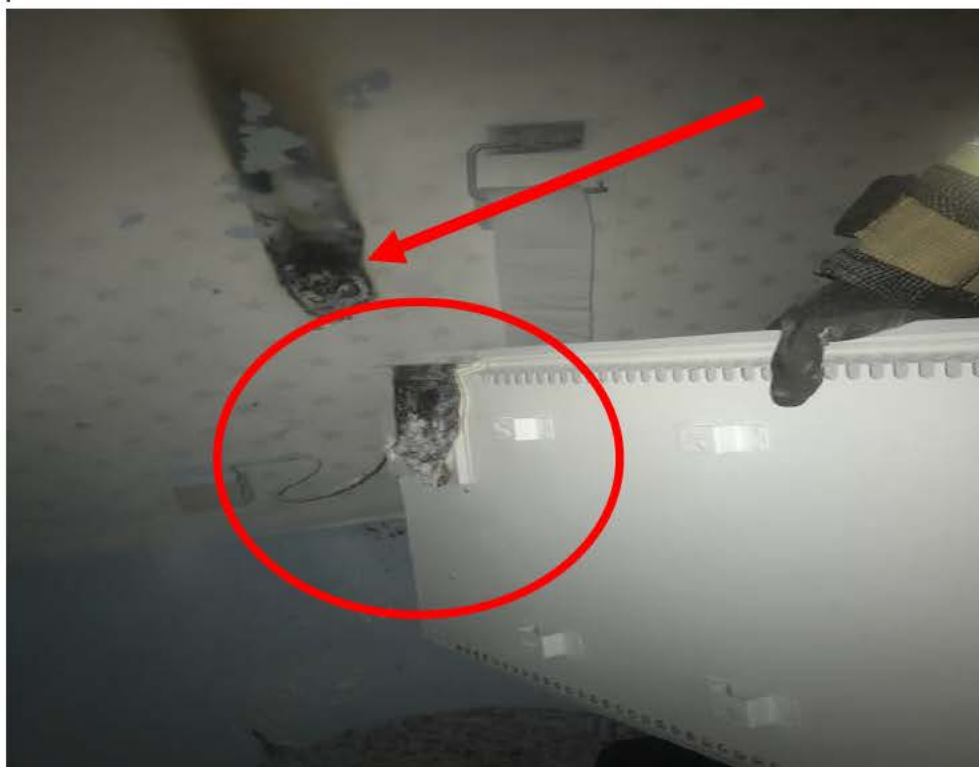
Bild 1: Den röda ringen visar det primära brandstartsområdet. Röda pilen visar brandskadorna i väggen bakom elementet

Branden spred sig in i väggen och det området frilades och kontrollerades. Inne i väggen fanns ingen el eller annat som kunde starta en brand.