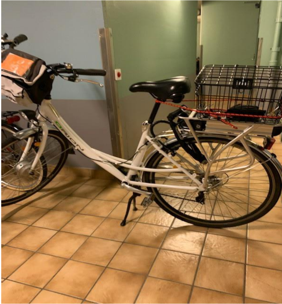
Foto 5. Elcykeln av modell Orion Slim.