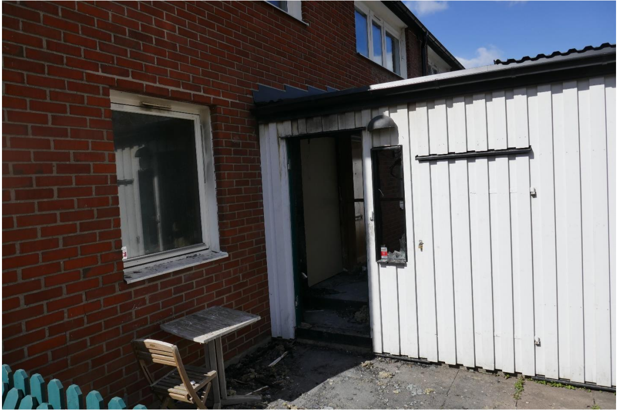
Foto 1. Entrén från utsidan.