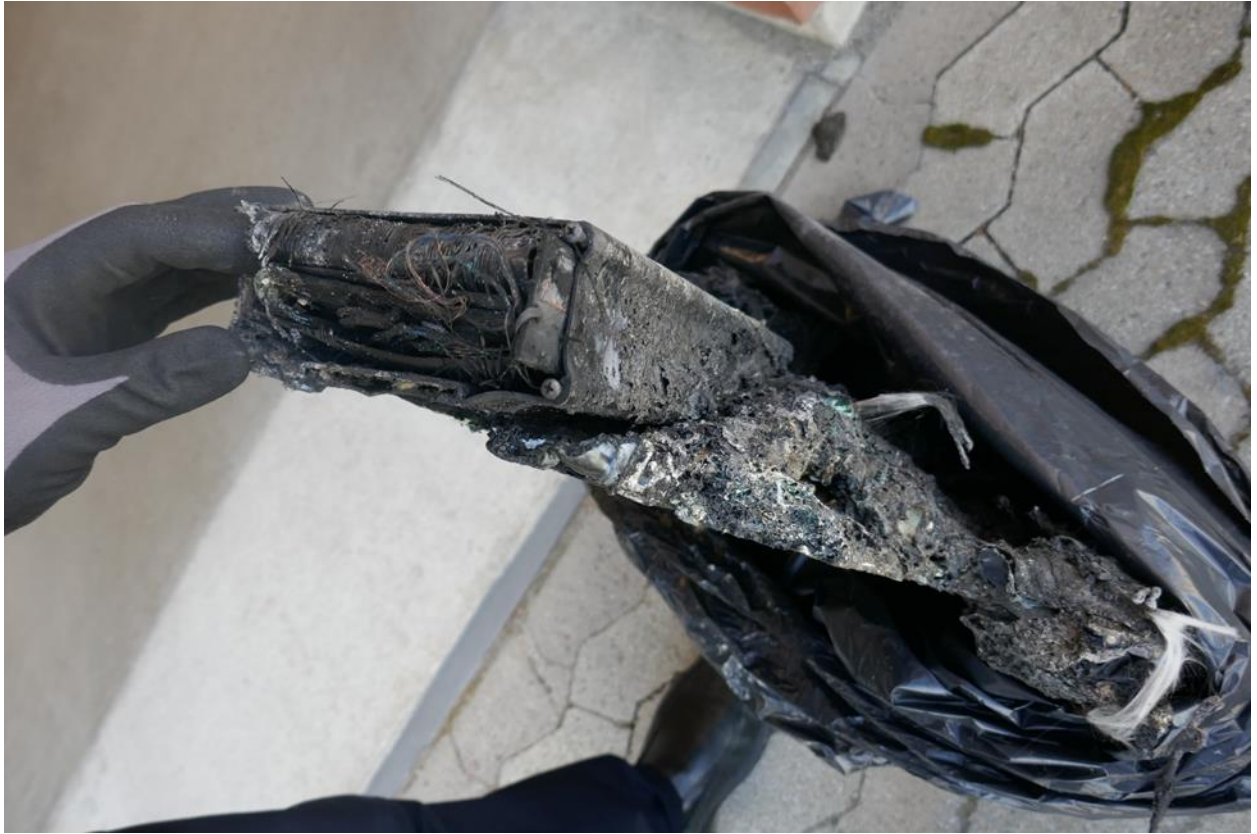
Foto 7. Brandskadat cykelbatteri.