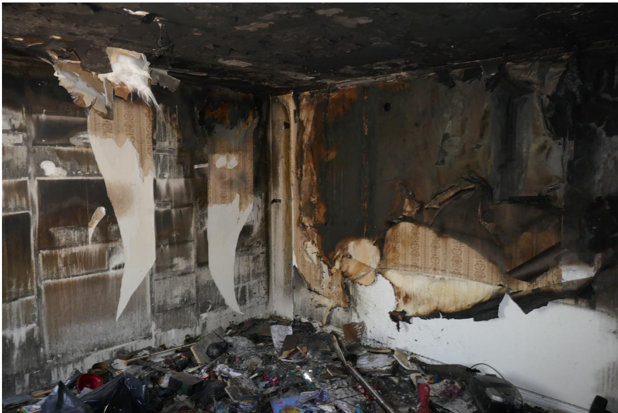
Foto 3, vardagsrummet på nedanvåningen.