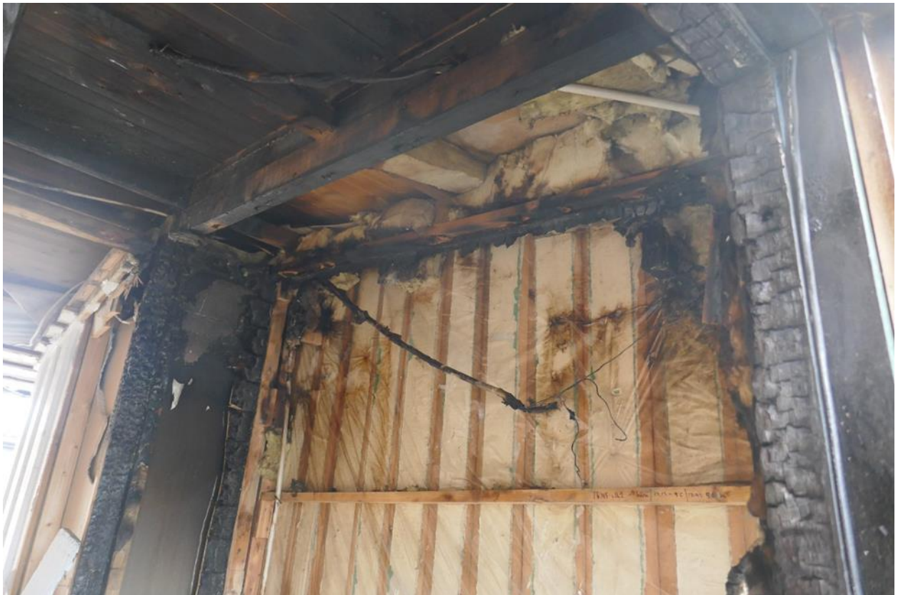
Foto 2. Entréns insida där bla hatthyllan funnits. Panelbräderna i utrymmet var vid undersökningen till mestadels borttagna.