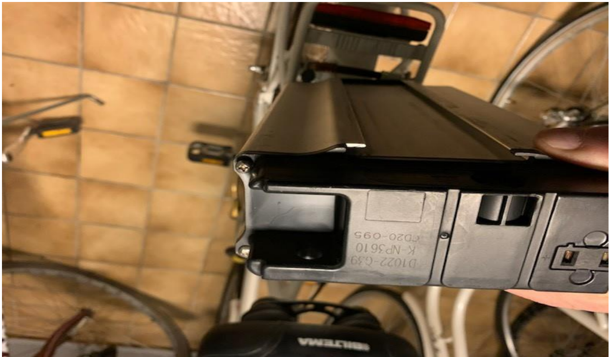
Foto 6. Batteribeteckning. Litiumjon Panasonic, 36V 10,4 Ah (374,4 VA).