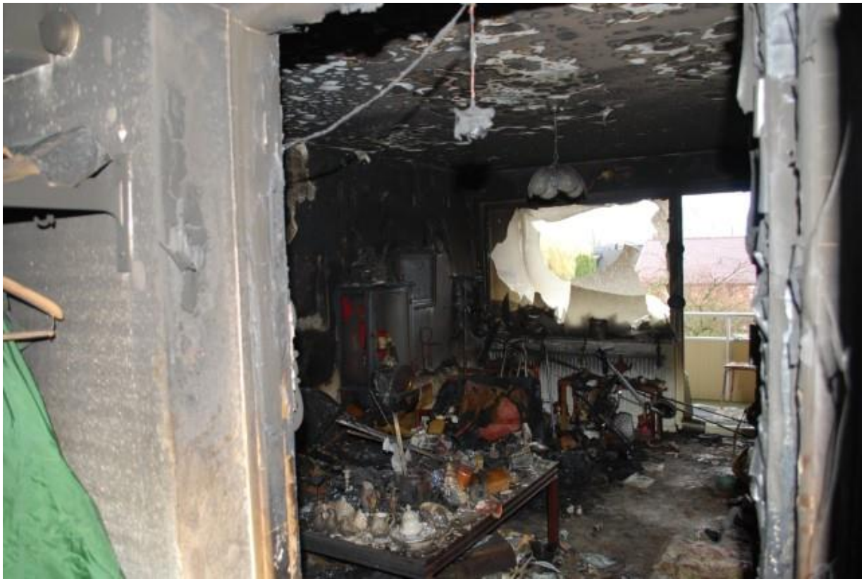
Bild 1. Brandskador i vardagsrummet.