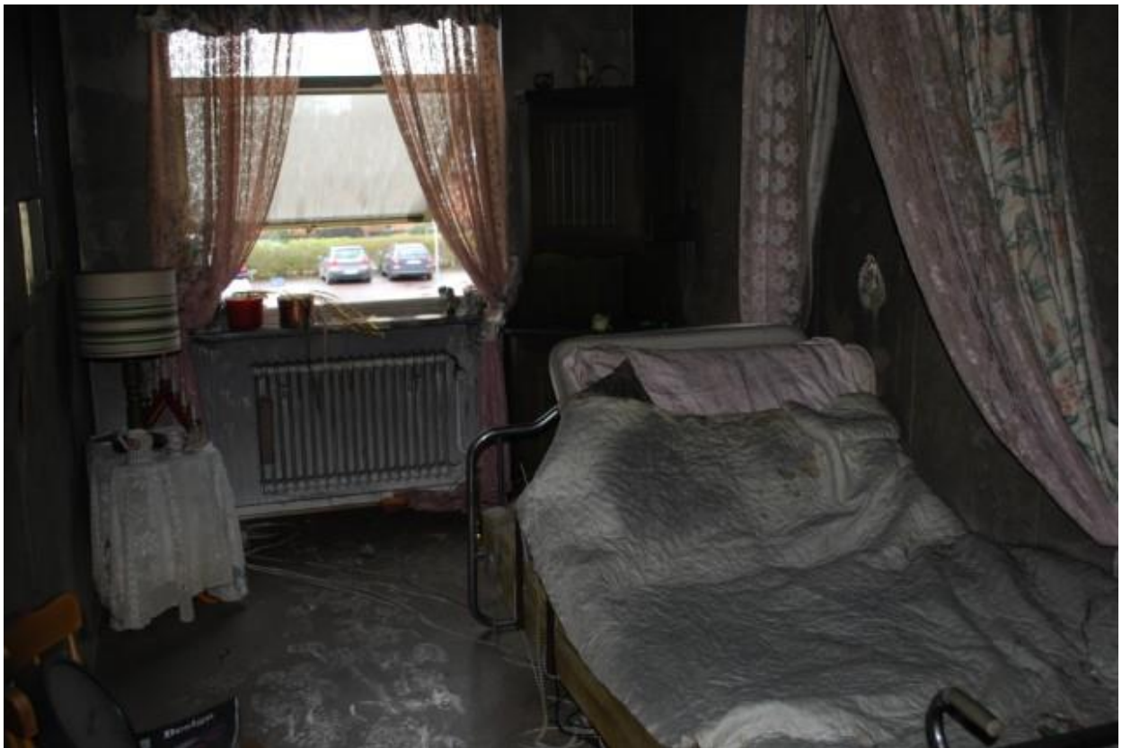
Bild 4. Sovrummet i lägenheten.