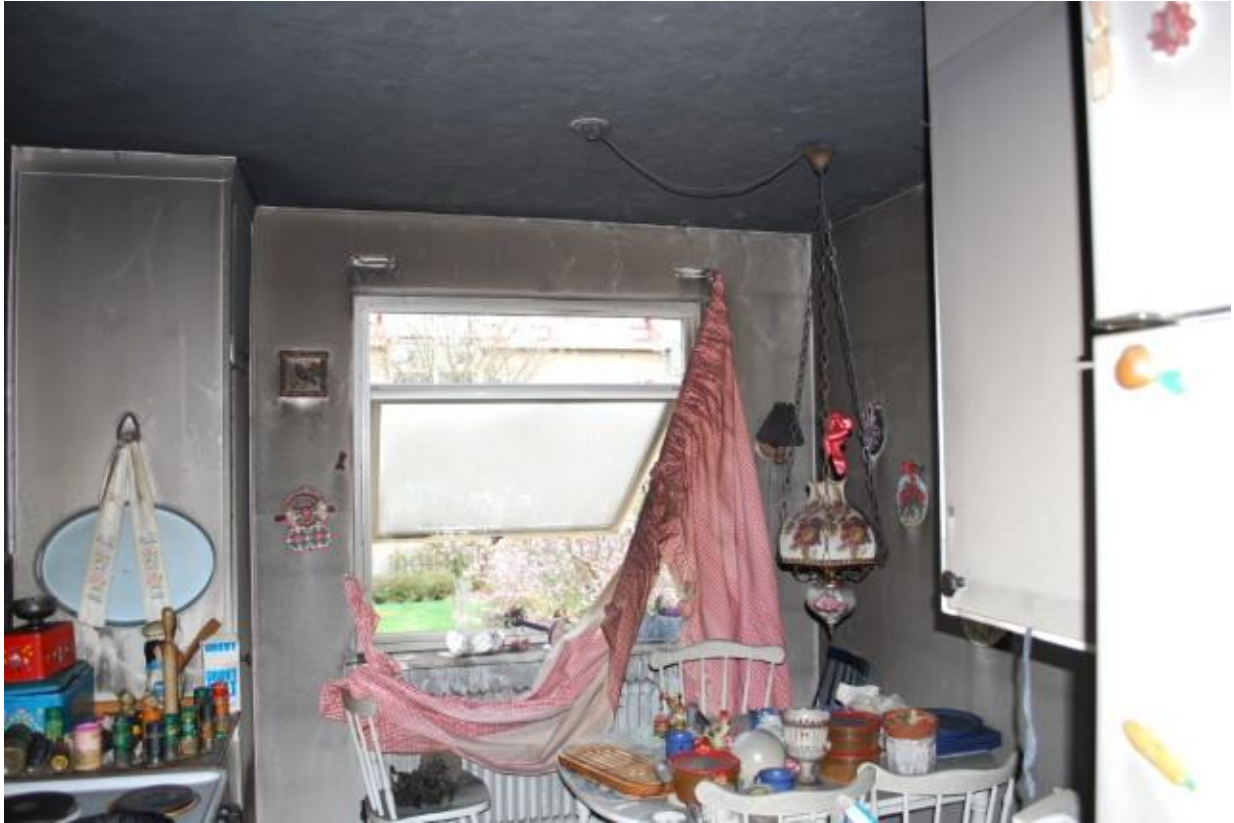
Bild 3. Köket i lägenheten.