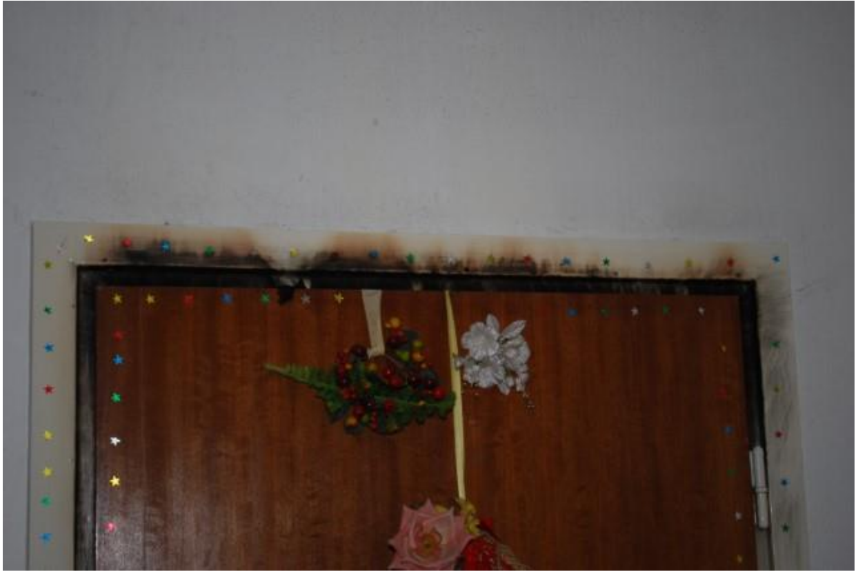
Bild 5. Brand- och sotskador i ovankant på lägenhetsdörren.