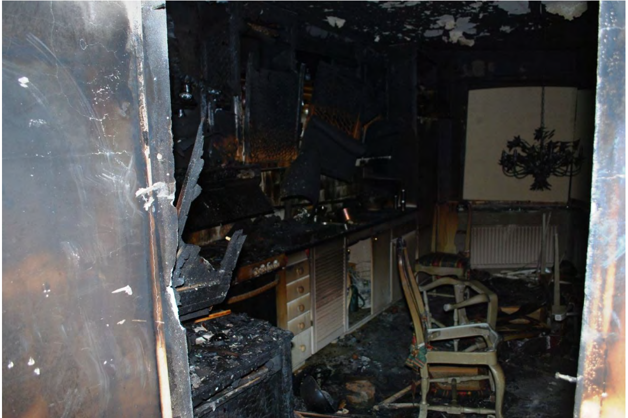
Köket från hallen.