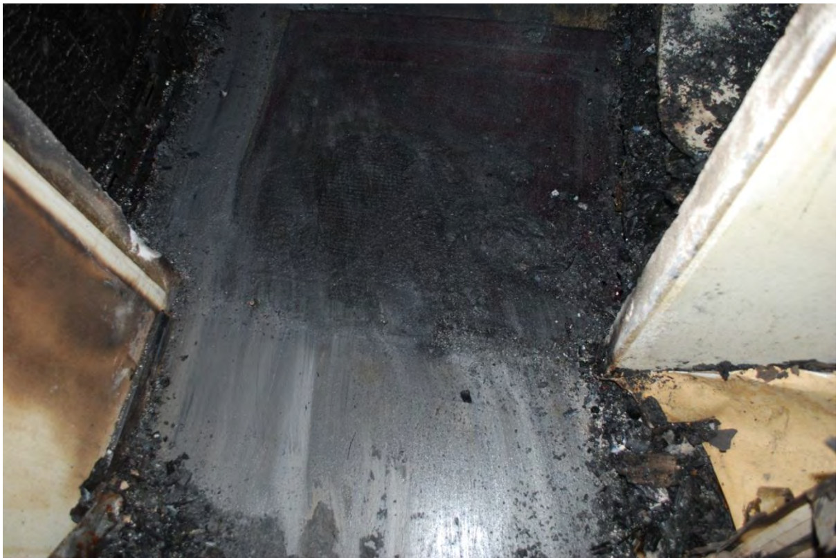
Mattan utanför städskrubben.