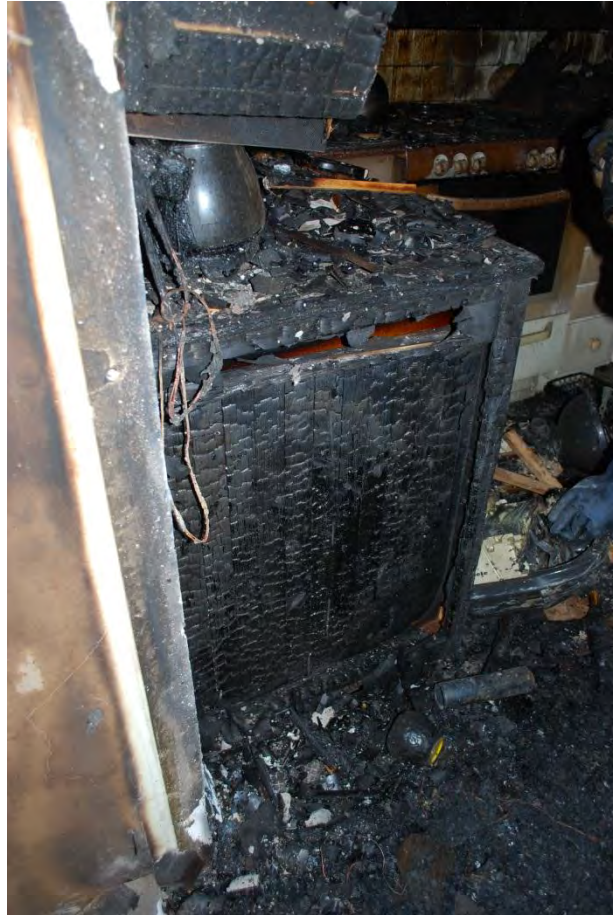
Sida på köksskåp mot städskrubb. Kraftigt kolat.