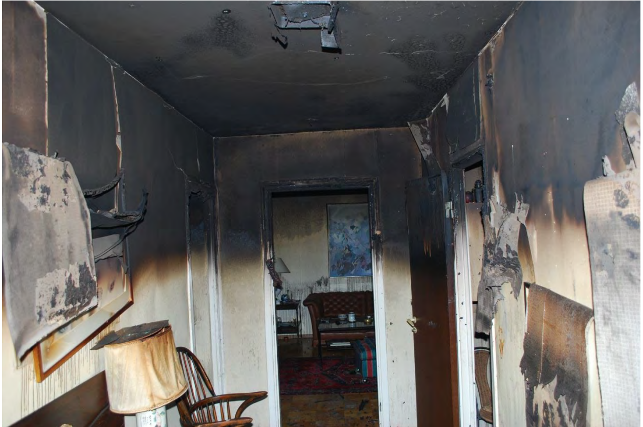
Hallen utanför köket mot vardagsrummet.