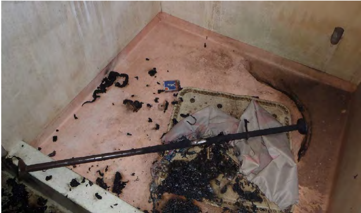
Bild 9: Golvet i duschkabin, här syns en tändsticksask, brända textilier, nedriven duschstång med draperi.