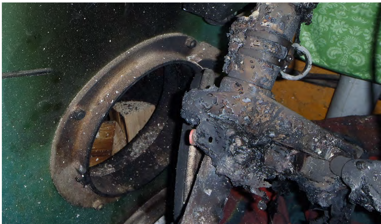
Bild 6: Här syns att eldstaden är fylld med ved som endast är svedd.