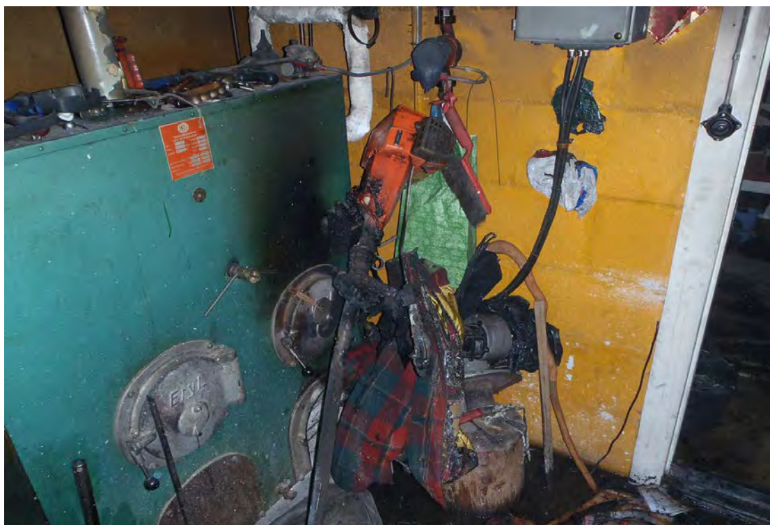
Bild 4: Brandskador på grästrimmer, ej initial placering, flyttad av rökdykare.