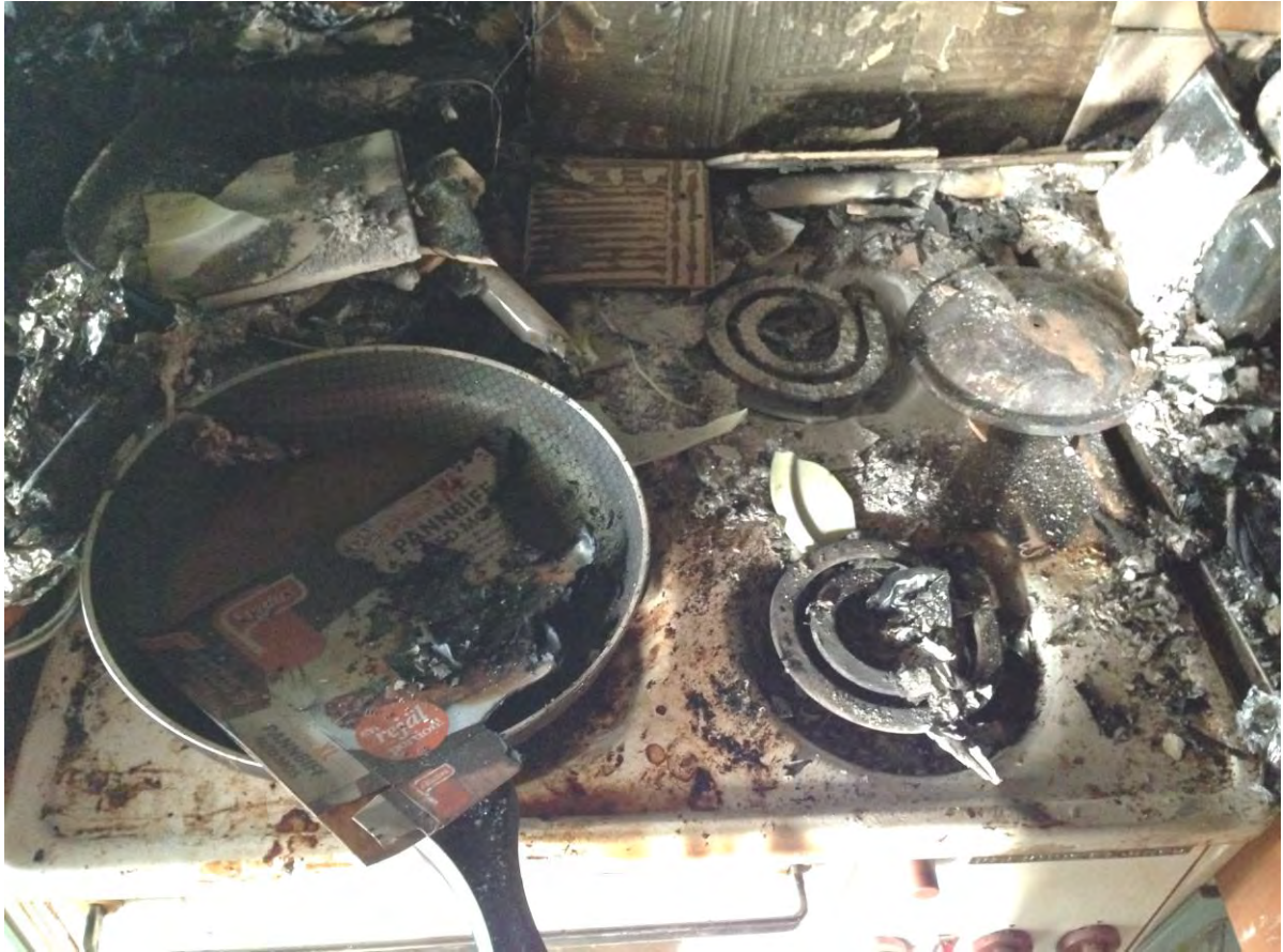
Figur 3: Då händelsen upptäcktes var de två övre spisplattorna påslagna.