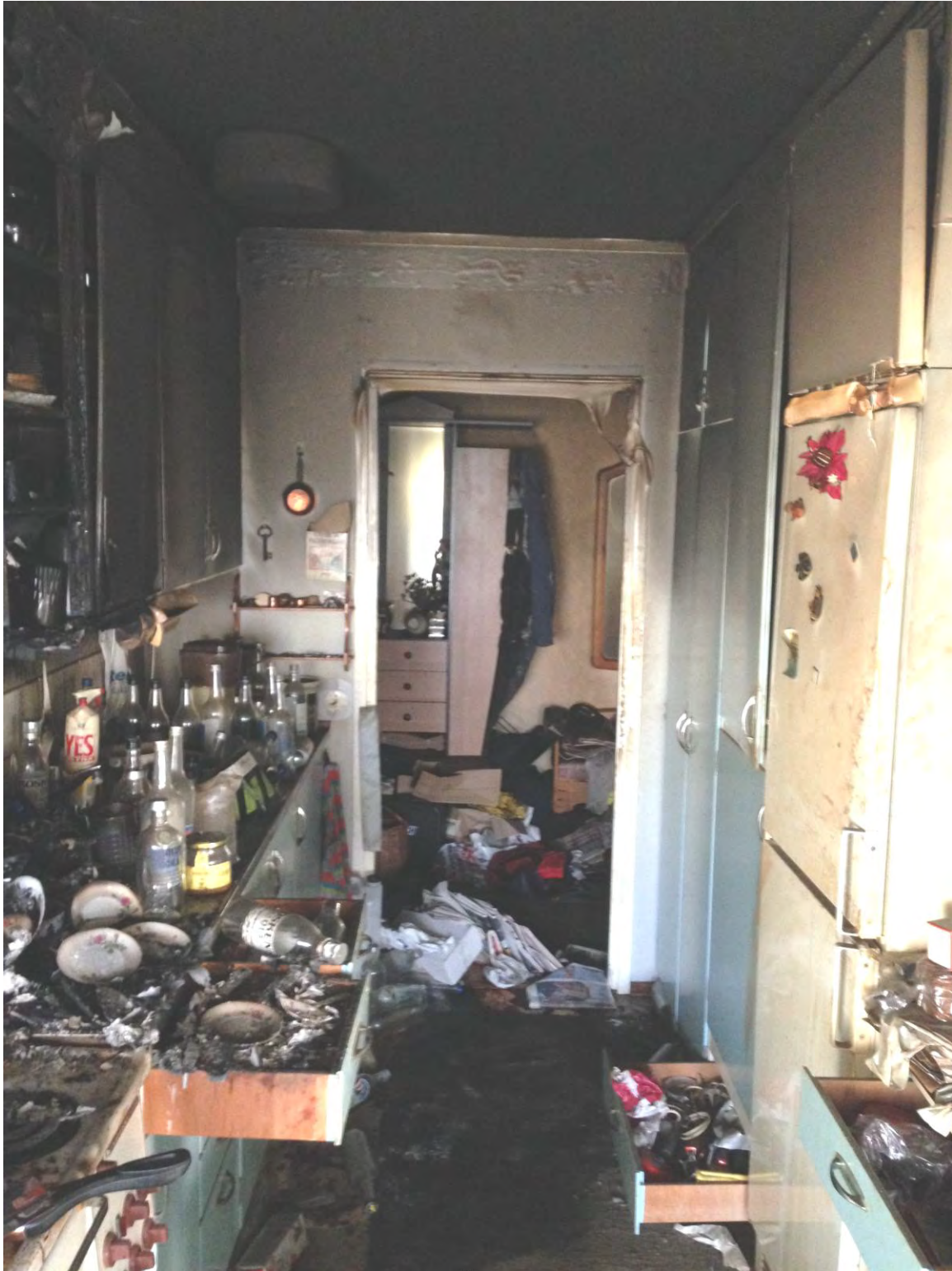
Figur 2: Del av köket. Spisen där branden med största sannolikhet startat syns i bildens vänstra nederkant.