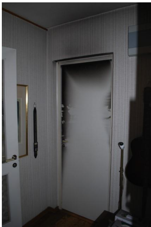
Dörr mot sovrums från entre´.