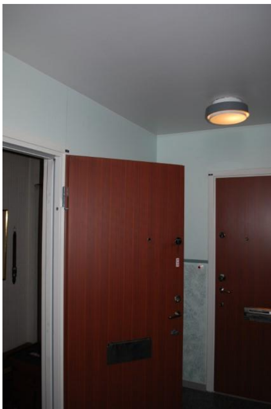
Lägenhetsdörr utan synliga brand/rökskador