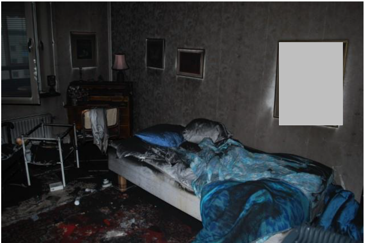
Brandskador på matta i anslutning till sängen.