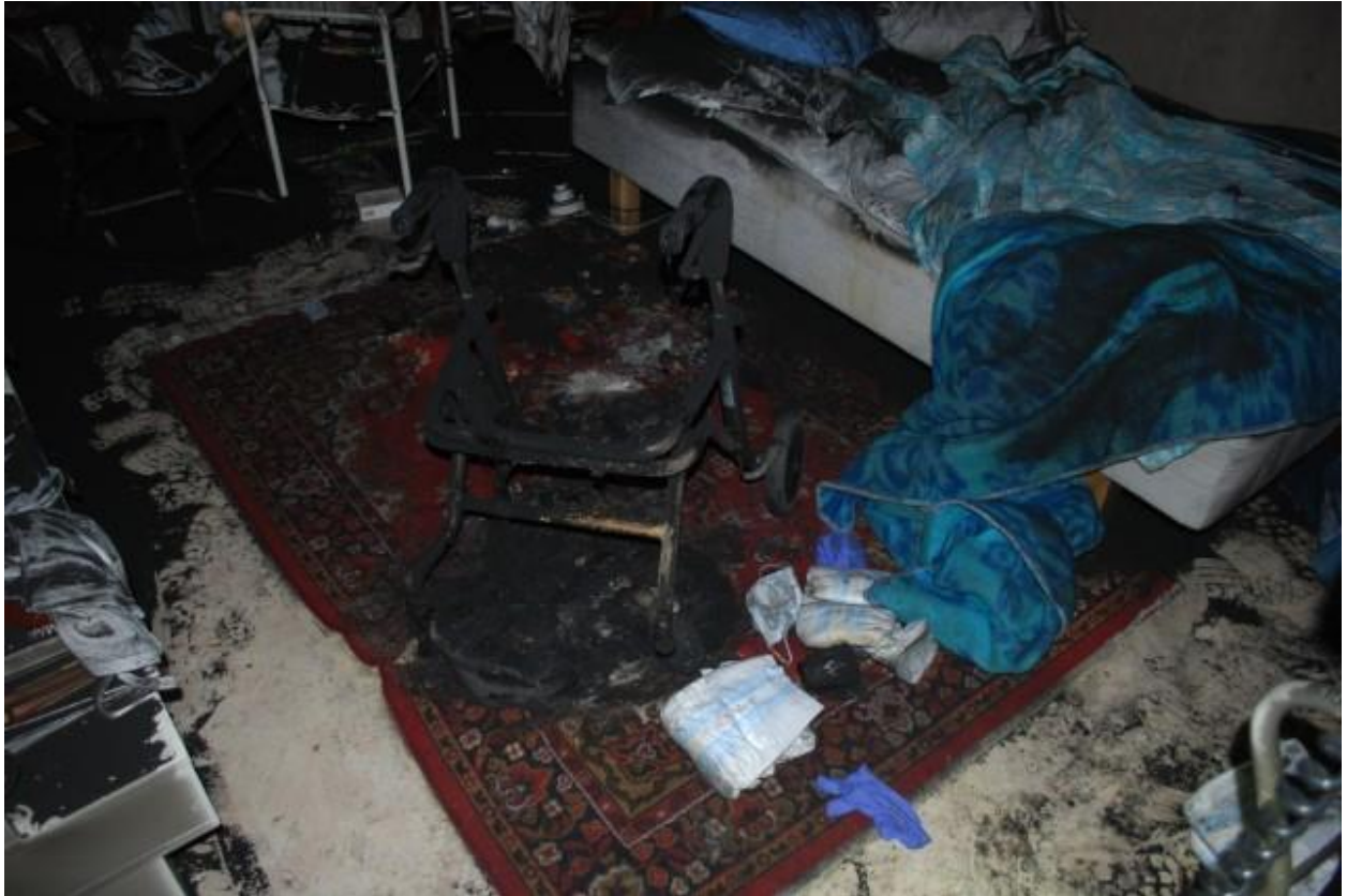
Brandskadad rullator intill sängen.