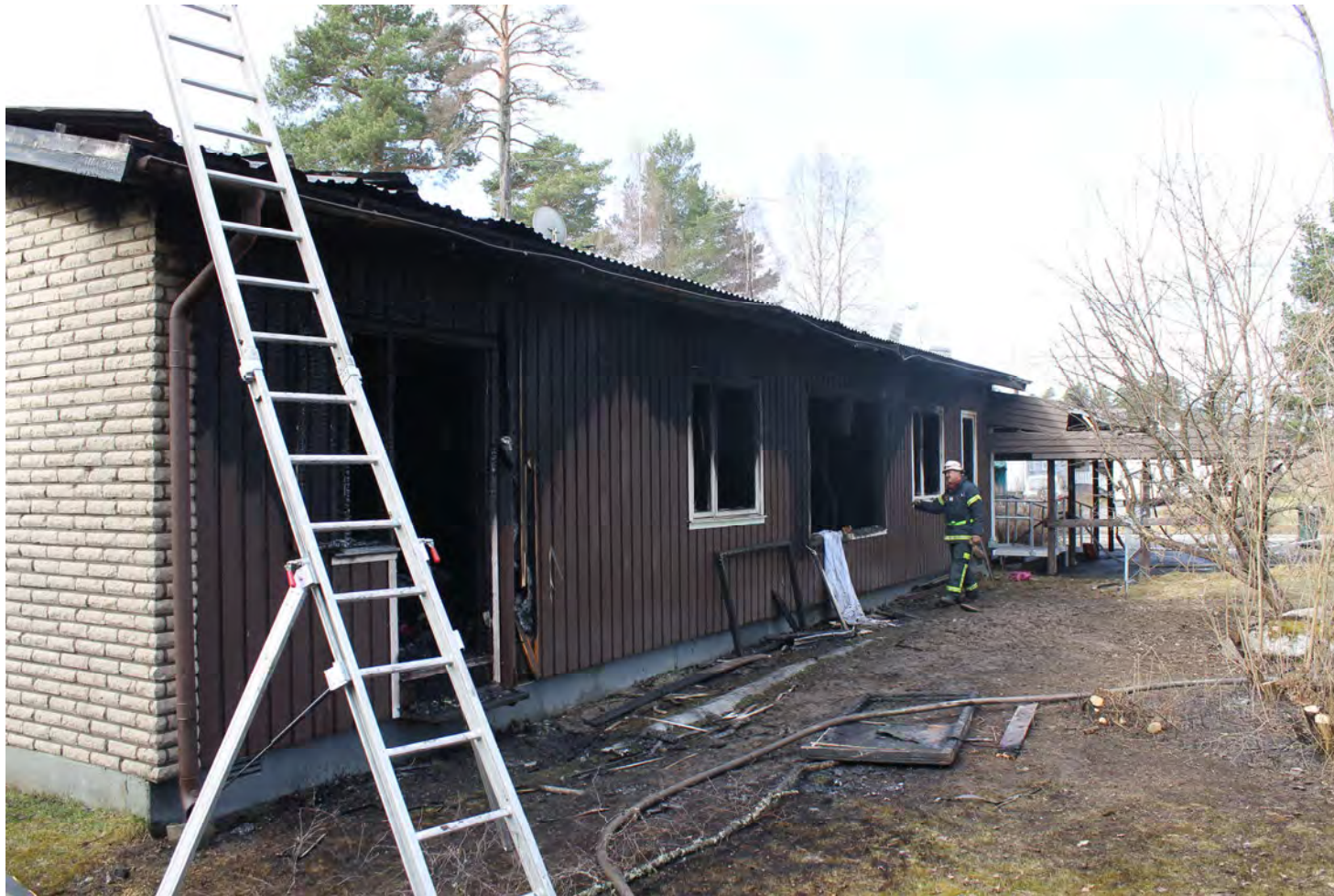
Figur 6 Primärbrandplatsen är innanför parfönsterhålet. Där hittades kvinnan.