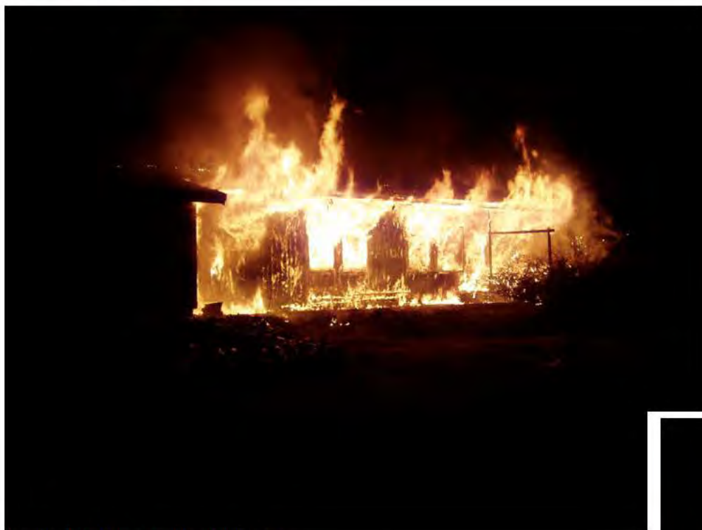
Figur 3 Vid framkomst, altansidan.