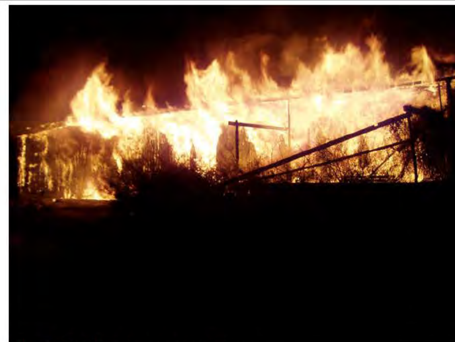
Figur 1 Altansidan, brand ur alla fönster