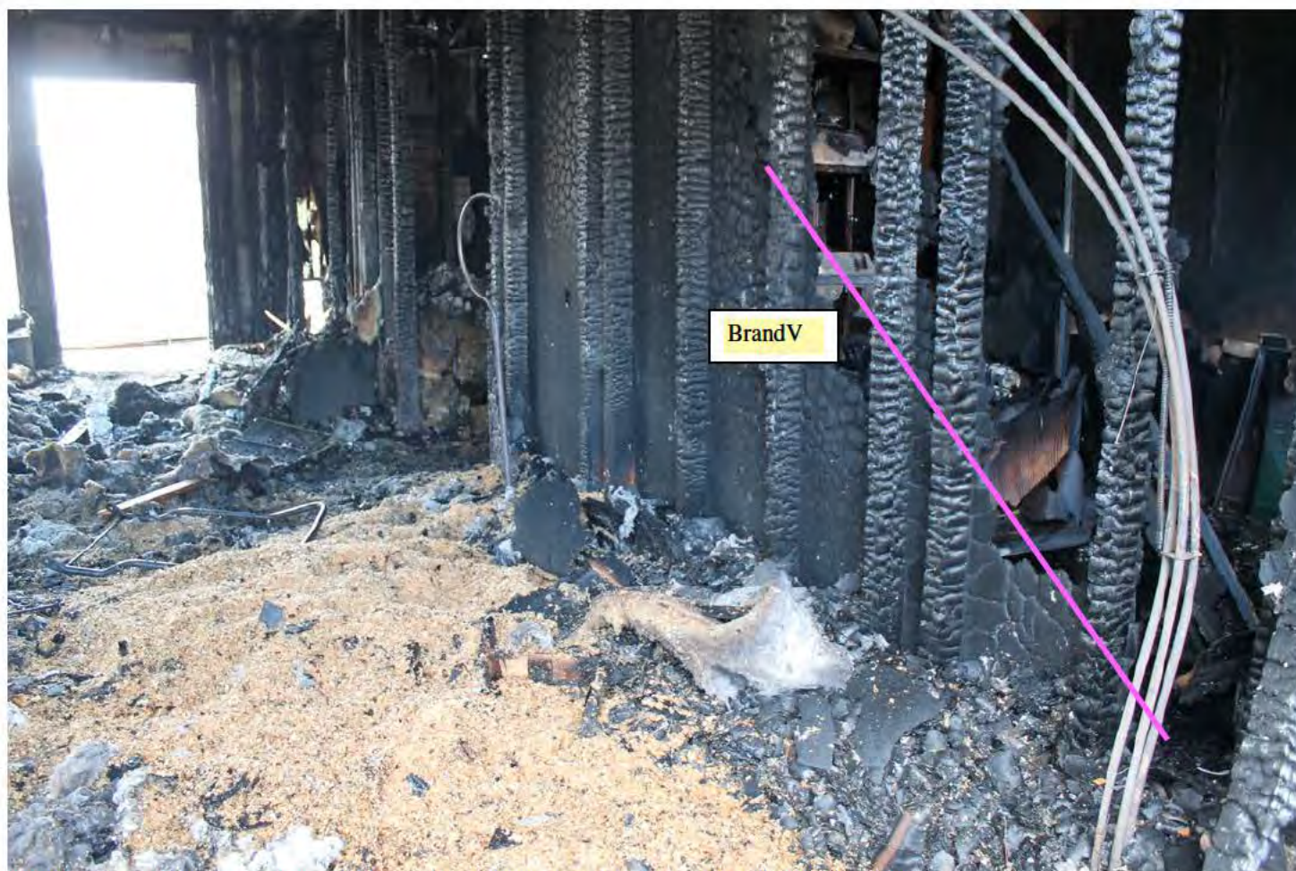
Figur 5 Här syns västra väggen i TV-rummet. Den är väldigt hårt bränd. Ända ner till golv.