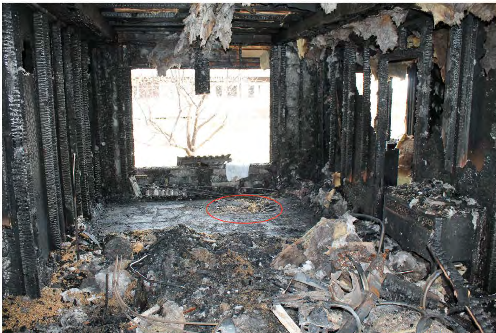
Figur 8 Här ser vi primärbrandplatsen. Genombränningen syns i golvet. Genombränningen är mellan TV-apparaten och den fåtölj där kvinnan satt.