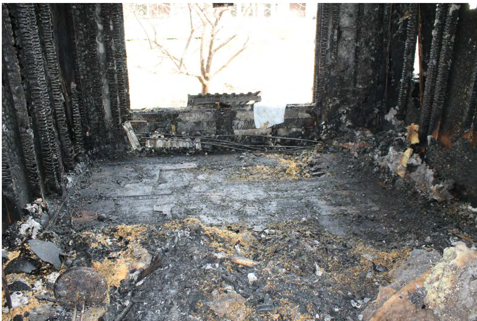
Figur 9 En lite närmare bild på primärbrandplats och genombränningen i golvet.