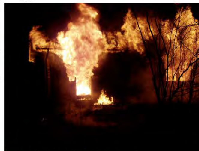
Figur 2 Dörren ut från sovrums