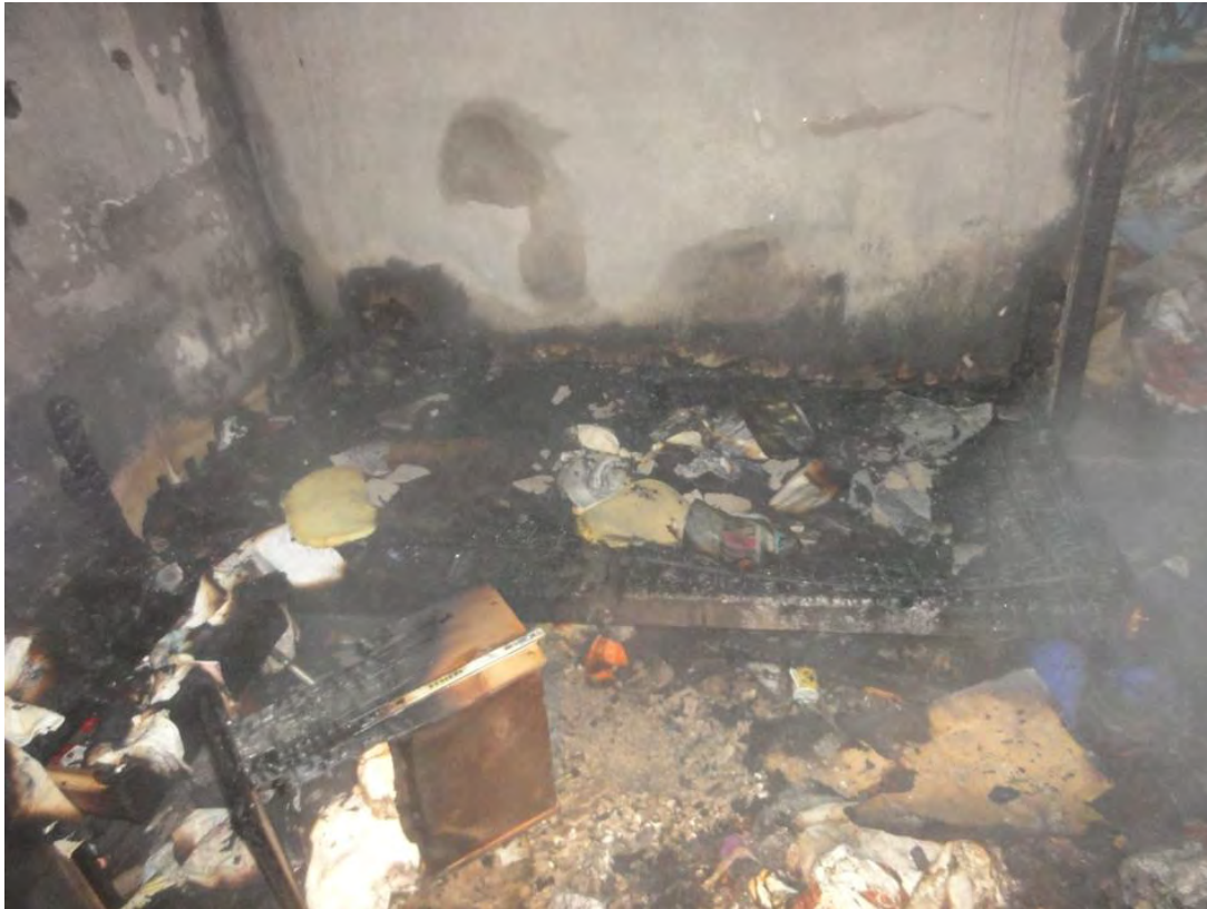
Bild 5. Brandskador i och kring sängen.