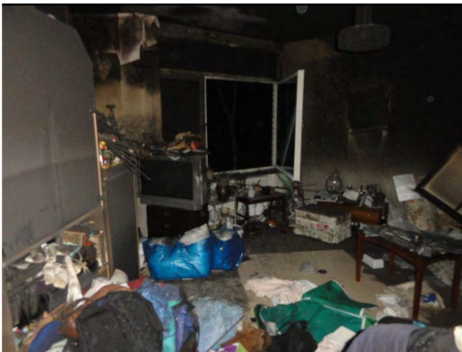
Bild 1. Vardagsrummet.