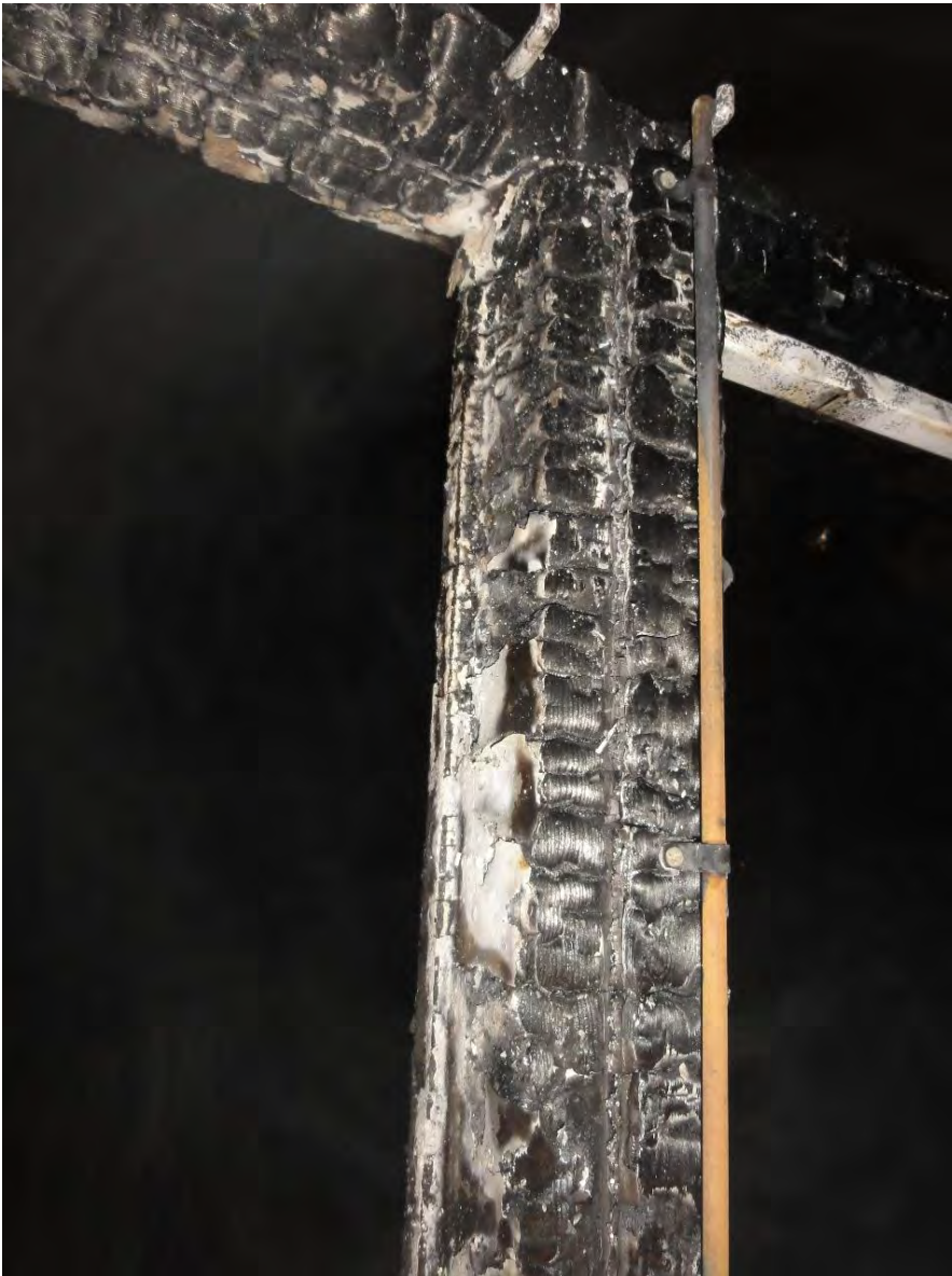
Bild 4. Brandskador som visar att det vänstra fönstret stått öppet under branden.