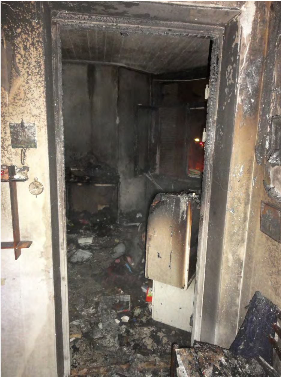
Bild 3. Öppningen in mot sovrummet.