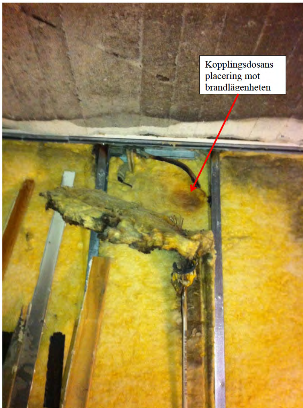
Bild 7. Väggen mellan brandlägenheten och lägenheten som fick in brandrök. Bilden tagen vid renoveringen av brandlägenheten.