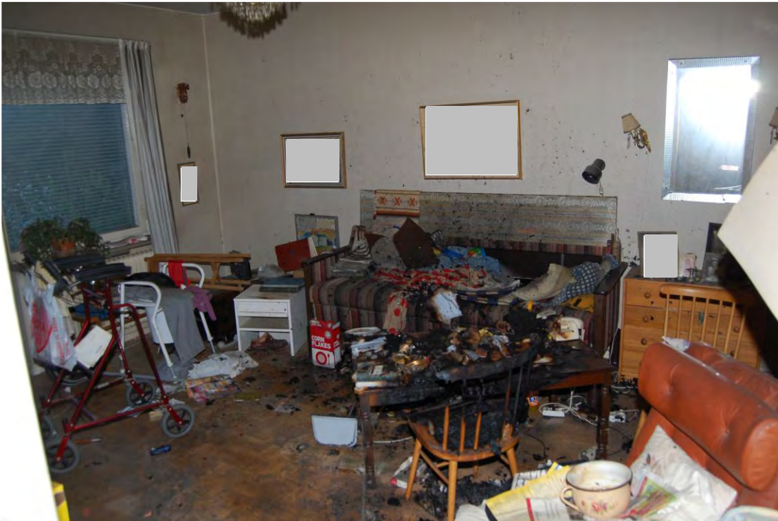
Det kombinerade sov- och vardagsrummet