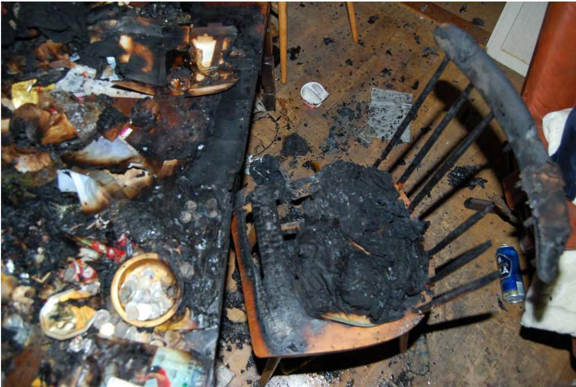
Det brandskadade soffbordet och stolen