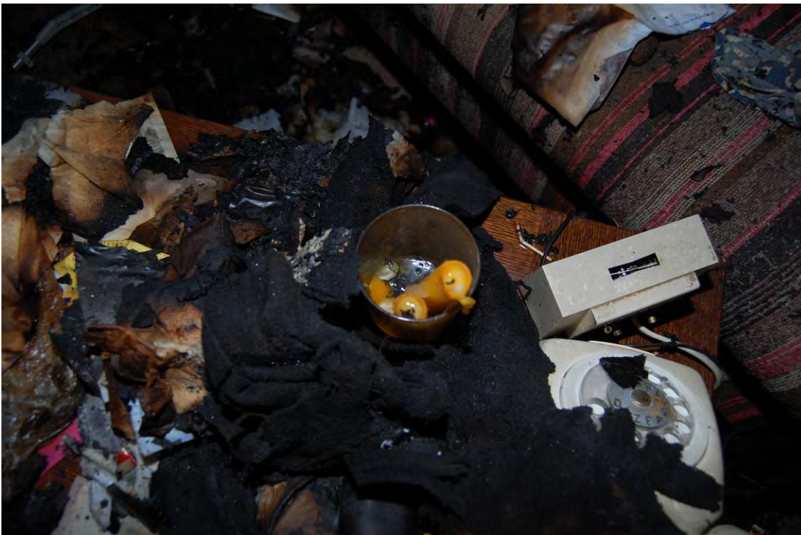
Stearinljus i ett dricksglas med tyg eller ett klädesplagg bredvid