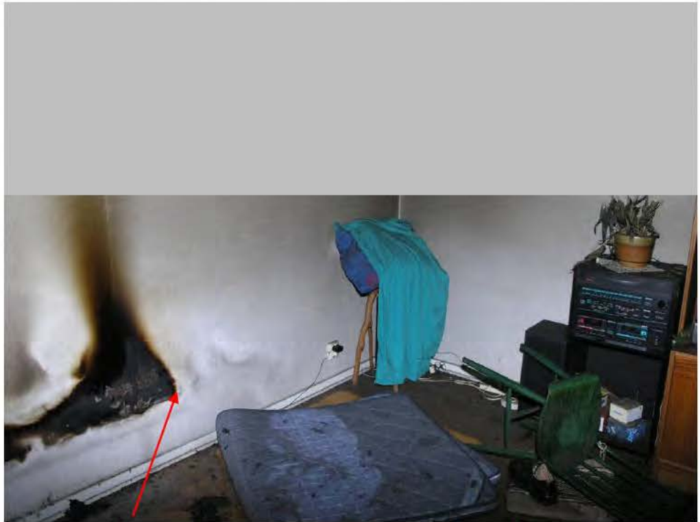
Här var kanten på sängen. Utanför är bara rökskador