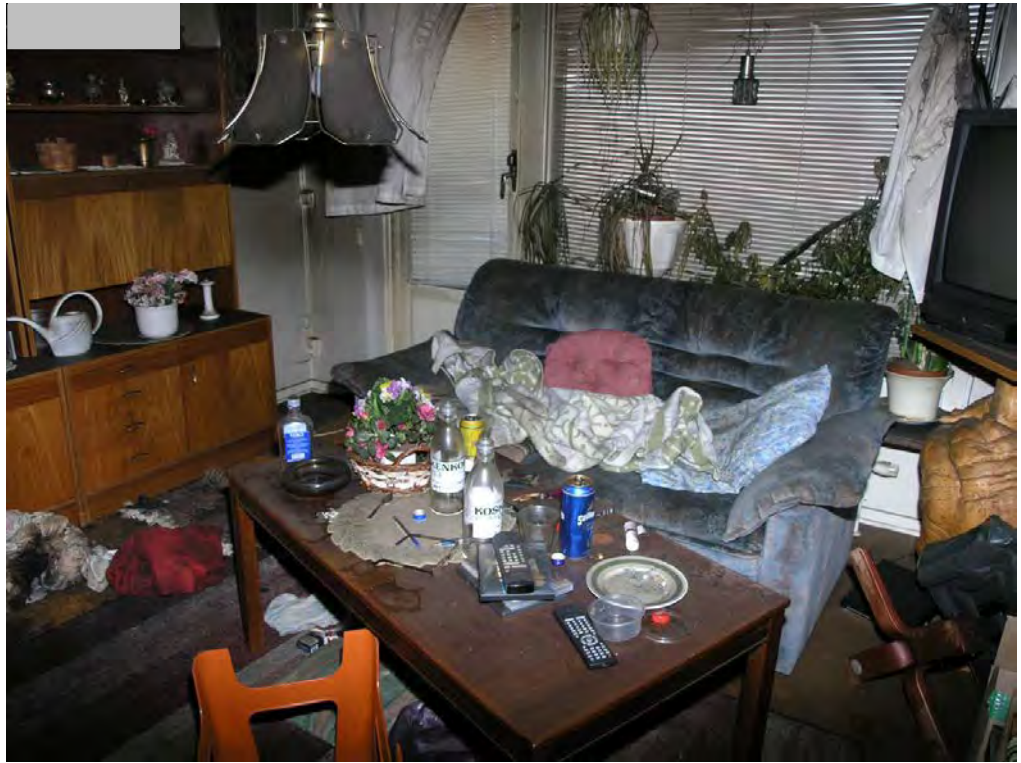
Den andra delen av rummet hade bara rökskador