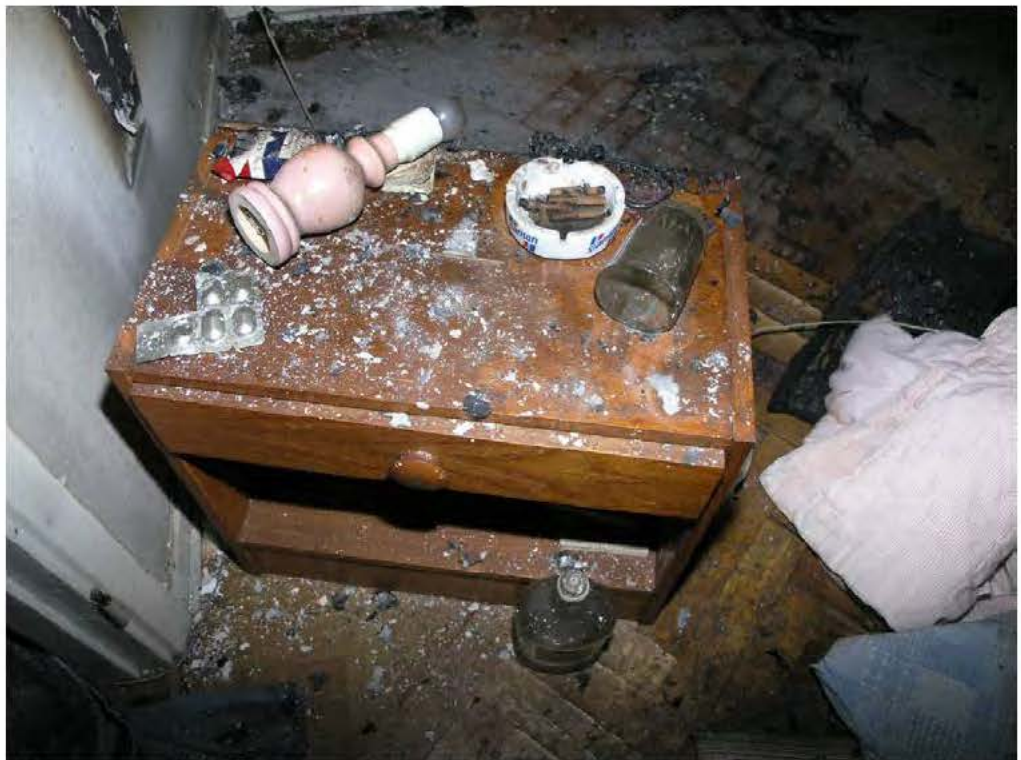
Bord som stod jämte sängen med cigaretter och fimpar. På golvet fanns flera bränmärken efter cigaretter