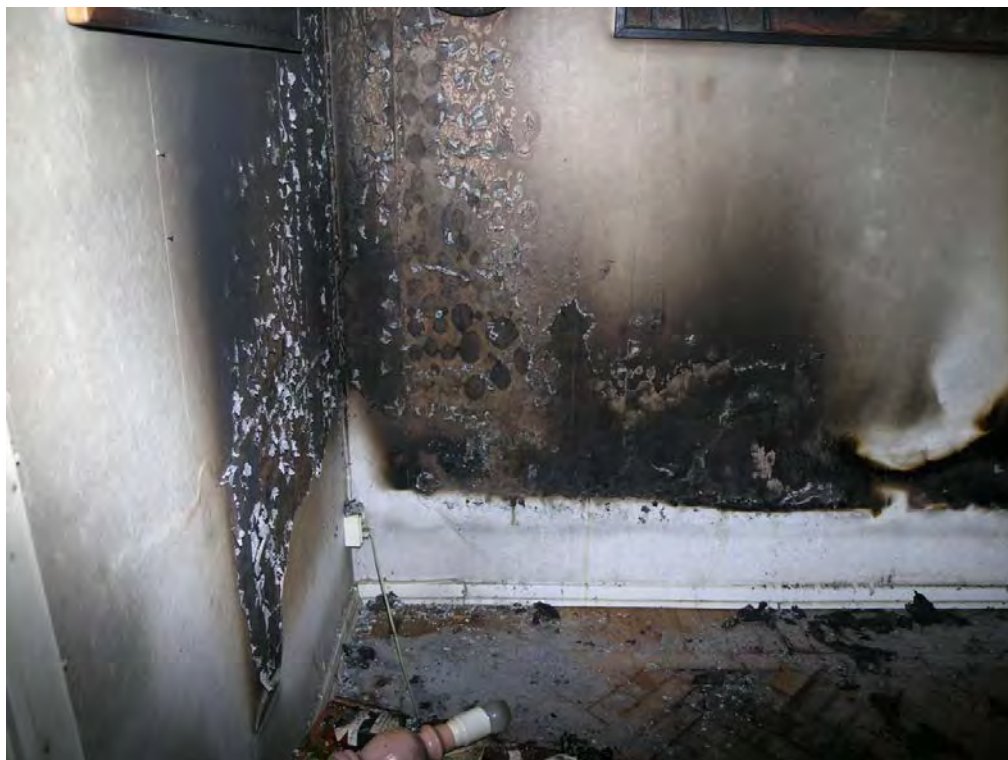
Platsen där sängen hade stått var den enda plats där det fanns brandskador