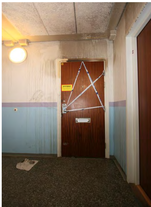
Bild 1. Dörr till brandlägenheten.