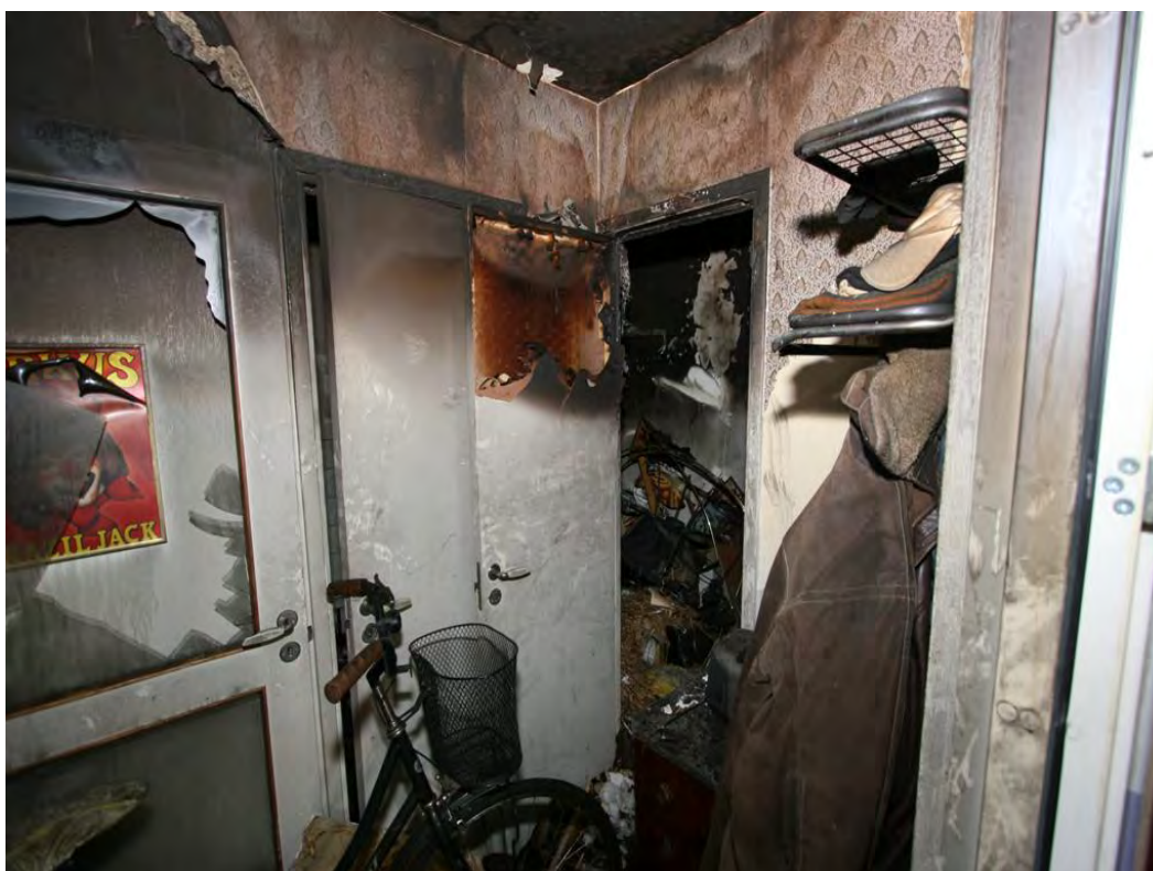
Bild 2. Bilden är tagen från hallen mot den brandutsatta garderoben.