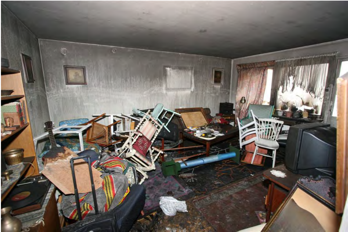
Bild 3. Vardagsrummet med stora rök och värmeskador.