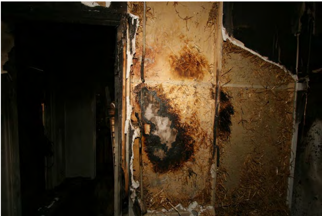
Bild 4. Visar elkablarna som kortslutits och skapat branden i väggen.