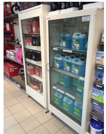
Figur 22. Skåp testat och certifierat enligt SP 2369 version 1-5, märkta SP2369 klass 1.