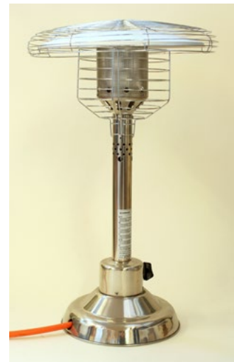
Figur 30. Gasolvärmare som exempel på en gasanordning.

Märkningen ska vara varaktig och läsbar. Varningstexter ska vara lättlästa och på svenska.