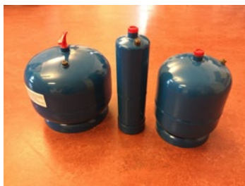
Figur 16. Gasolbehållare med volym 1-5 liter.