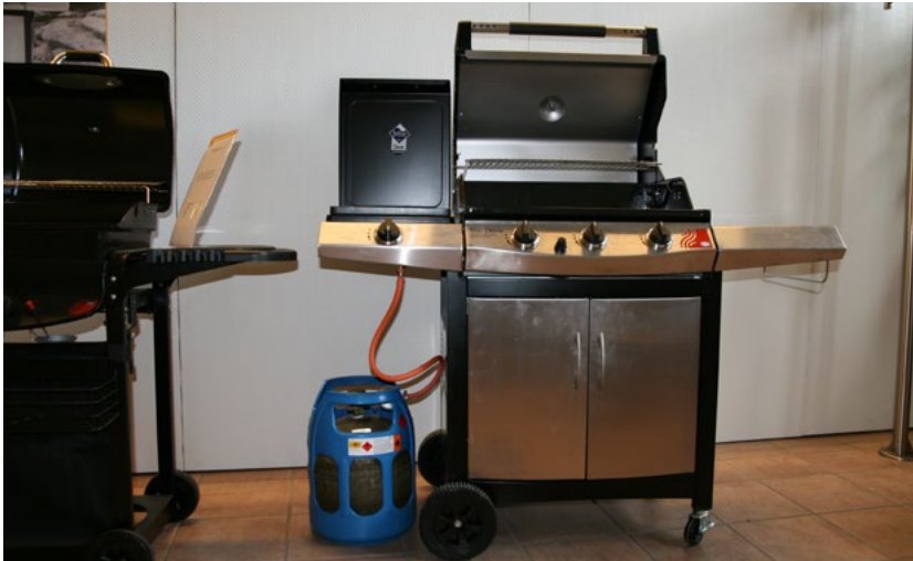
Figur 31. Gasolgrill som exempel på gasanordning.