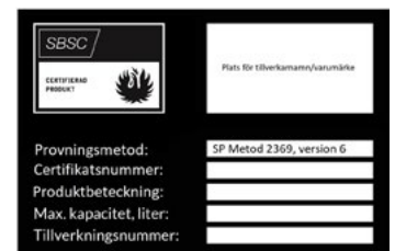
Figur 21b. Texten SP Metod 2369 version 6 visar att skåpet är godkänt för samförvaring.