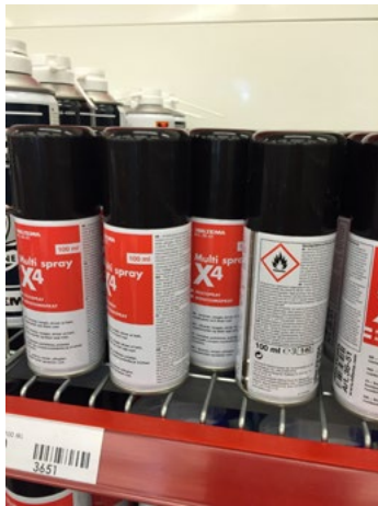
Figur 23. Aerosoler på trådhyllor som effektivt släpper igenom sprinklervatten.

Automatiska släcksystem kan vara ett effektivt sätt att skydda brandfarliga varor mot brand i en butik, särskilt om branden uppstår i närheten. Förekomsten av ett automatiskt släcksystem har alltså stor påverkan på hur en eventuell brand utvecklas och hur de brandfarliga varorna kan påverkas och beskrivs därför närmare här. Det är viktigt att både släcksystemet och placeringen av brandfarlig vara utformas på rätt sätt. Därför kan en utredning behöva visa att släcksystemet har avsedd effekt. I lokaler med befintliga släcksystem behöver man utvärdera om dessa ger rätt skydd för brandfarlig vara. Går det inte att visa att släcksystemet är en effektiv skyddsåtgärd så bör man inte heller kunna återöppna dess skydd i sin utredning om risker.