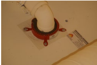
Figur 25. Brandtätning av rörgenomföring i brandcellsgräns.

Samförvaring kan under vissa förhållanden dock anses acceptabelt i utrymmen som är skyddade mot brand och där risken för att brand uppstår är liten vilket är fallet i de brandtekniskt avskilda förvaringsutrymmena. Om både brandfarliga vätskor och aerosol- eller gasbehållare placeras i samma utrymme behöver utrymmet utformas så att dessa varor hålls åtskilda i olika delar av rummet. Alternativt kan risken för att brand uppstår minskas genom att endast behållare med brandfarlig vätska med flampunkt