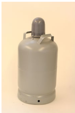
Figur 27. Gasolflaska av typ P11 som rymmer 26 liter.

För större mängder än vad som anges i tabell 2.1 och för större behållare än tillåtna (se avsnitt 2.1.1) är det lämpligt att flytta behållarna utomhus eller till ett förvaringsutrymme avskilt från butiksbyggnaden, till exempel en separat byggnad, container, plåtskåp eller liknande, för att uppnå en säker placering. Då kan avstånd till både butiksbyggnaden och andra verksamheter behövas, se avsnitt 2.7.1. Det är också viktigt att ta hänsyn till trafiksituationen och se över behovet av påkörningsskydd, se avsnitt 2.6.3. Vid samförvaring av brandfarlig gas eller aerosoler och brandfarlig vätska i utrymmet gäller avsnitt 2.5.3. Inget lättantändligt material får förvaras i utrymmet. Om det bara gäller större behållartyper än enligt avsnitt 2.1.1 kan det dock vara tillräckligt att de förvaras otillgängliga för allmänheten.