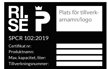
Figur 21a. Texten SPCR 102:2019 visar att skåpet är godkänt för samförvaring.

Skåp som är provade enligt standarden SS-EN 14470-1 är endast avsedda för förvaring av brandfarlig vätska. I sådana skåp ska inte aerosolbehållare eller behållare med brandfarlig gas placeras.