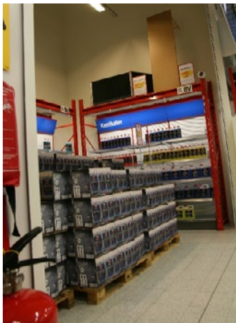
Figur 26. Butiksutrymme avskilt med jalousi.