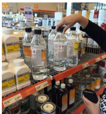
Figur 5. Olika typer av förpackningar.