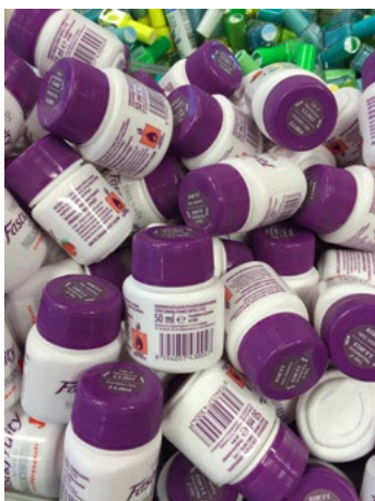
Figur 17. Exempel på små behållare med 50 ml brandfarlig vara.