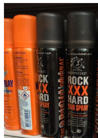
Figur 9. Aerosolbehållare.