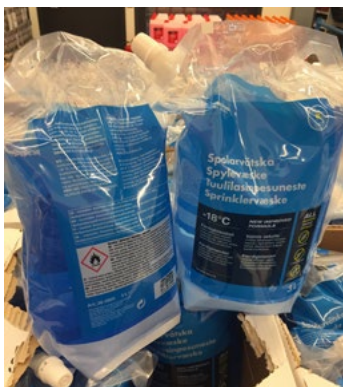
Figur 18. Exempel på behållartyp som kan spricka redan vid fall från låg höjd.