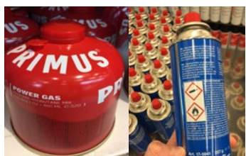
Figur 7. Två exempel på gasolbehållare.

Brandfarliga gaser är sådana gaser som kan antändas vid 20 °C, alltså runt normal rumstemperatur och normalt lufttryck. Gasol (propan, butan eller blandningar av dessa) är den vanligast förekommande gasen i butiker. Gasolen finns både som mindre engångsbehållare för till exempel gasbrännare och campingutrustning, och i större gasolflaskor för till exempel gasolgrillar och husvagnar. Gasol används även för påfyllning av cigarettändare. Gasol är i vätskefas (kondenserad) inuti en behållare, men räknas ändå som en gas, eftersom den förångas till gas när den kommer ut i luften.