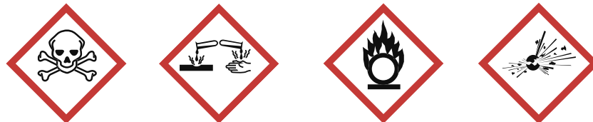
Figur 19. Märkning av produkter med giftigt, frätande respektive oxiderande innehåll, samt explosiva varor.

I butiken är det tillräckligt om brandfarliga vätskor placeras minst 6 meter från behållare med brandfarlig gas, aerosolbehållare med brandfarligt innehåll samt behållare med giftigt, frätande eller oxiderande innehåll. Om de brandfarliga varorna står placerade i brandavskiljande skåp (se avsnitt 2.3) behövs i allmänhet inget avstånd.