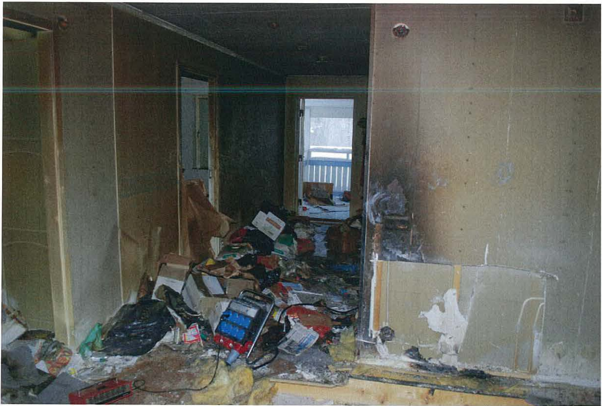
Bild 3: Skador på vägg och golv. Gipsskivan på väggen och golvbelägningen avlägsnades i samband med insatsen.