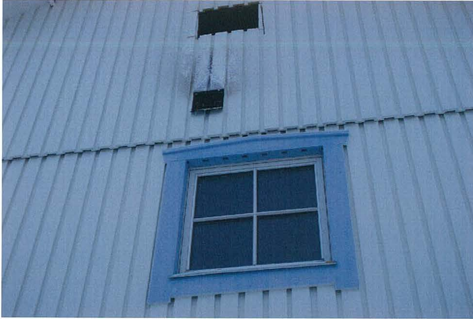
Bild 1: Köksfönster. Ovanför kan ventilen ses, hålet ovanför sågades upp isamband med insatsen.