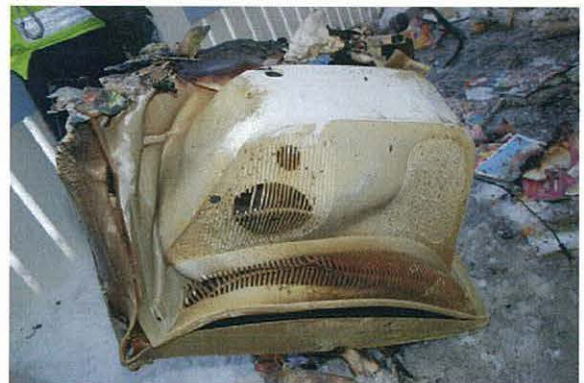
Bild 4.1 och 4.2: Skador på TV-apparaten. På bild 4.1 är TVn vänd upp och ned.