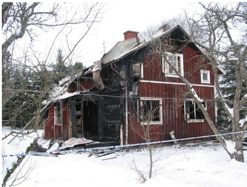
Bild 1. Översiktsbild.

Anledning till undersökning: Dödsbrand Datum: 2010-01-14 Torsdag KL: Larm till RTJ: 08:25 Larmnr: SOS Ärendnr.13 1316793 2 RTJ. Ärendnr.2010/00121 Startutrymme: Byggnadens utsida Startföremål: Lösa föremål på veranda samt golv och väggmaterial. Brandorsak: Mellanlagring av aska med glöd i på veranda