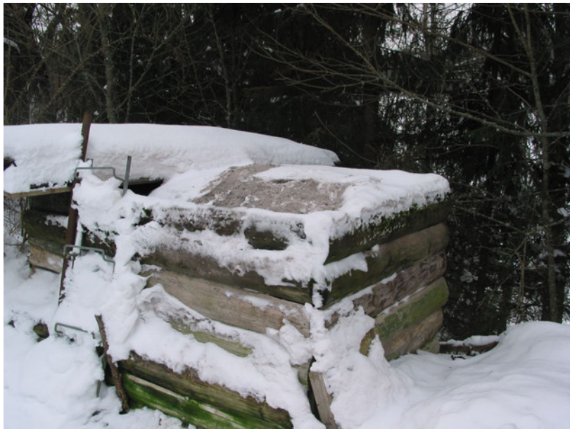
Bild 7. Slutförvaring av askan.

Bensindunk till snöslungan m.m förvarades på verandan.