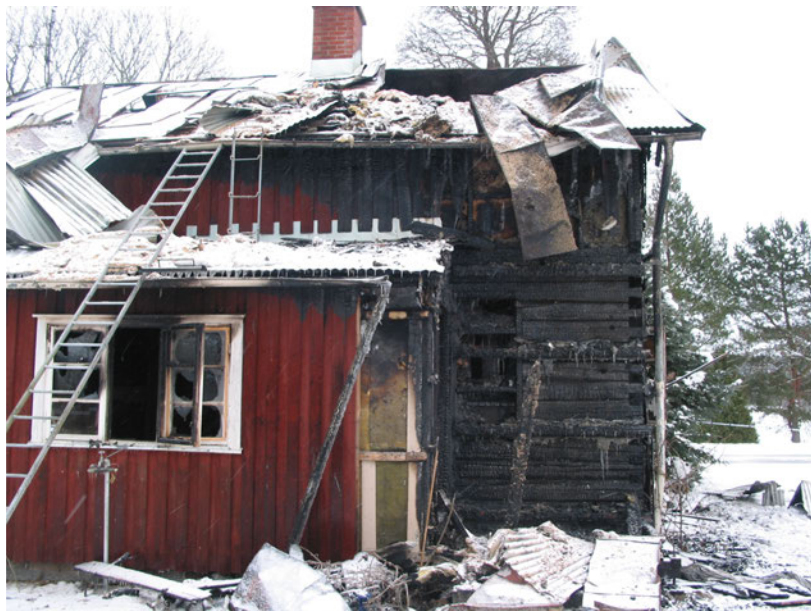
Bild 6. Verandan där askan mellanlagrades.

Mellanlagring av aska sker på verandan, slutfövaring sker ca. 30 m bort. Bild 6 och 7.