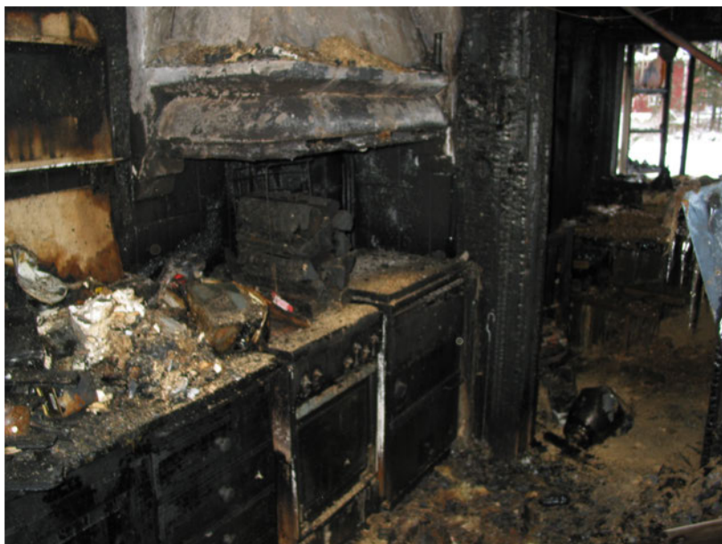
Bild 4. Kökspannan.

Kökspis/panna har en begränsad kapacitet, vid tillfället är det under – 20 grader Bild 4.