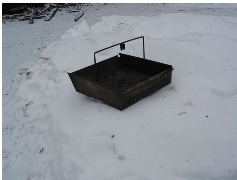
Bild 5. Asklåda hörande till pannan.

Uraskningen sker på så sätt att man måste bära ut en särskild asklåda och tömma samt sätta åter för att fortsätta elda. Asklådan har en liten volym för kontinuerlig eldning. Bild 5.