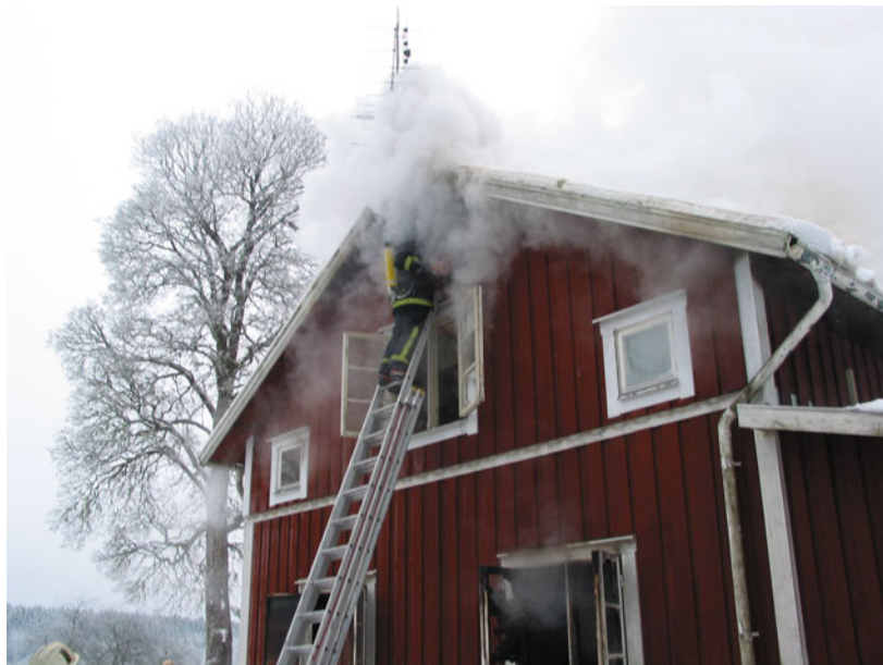
Bild 2. Utvärdig brandbekämpning.

Mycket kraftig brand i området runt verandan och nu även i hall och kök samt kraftig rökutveckling från nock och takfot som varslade om brandspridning till dolda utrymmen i väggar, tak och vind. Släckningen utfördes både inifrån och utifrån. En livlös man påträffades på vardagsrumsgolvet som sjukvården konstaterade var avliden. Räddningstjänst avslutades 15:00 Bild 2 och 3.