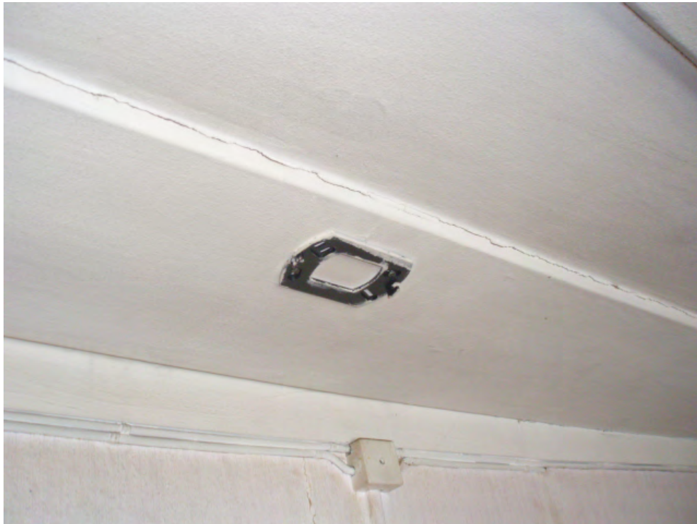
Bild 9: Fäste av brandvarnare i taket utanför sovrumsdörren, brandvarnaren låg på köksbänken utan batteri