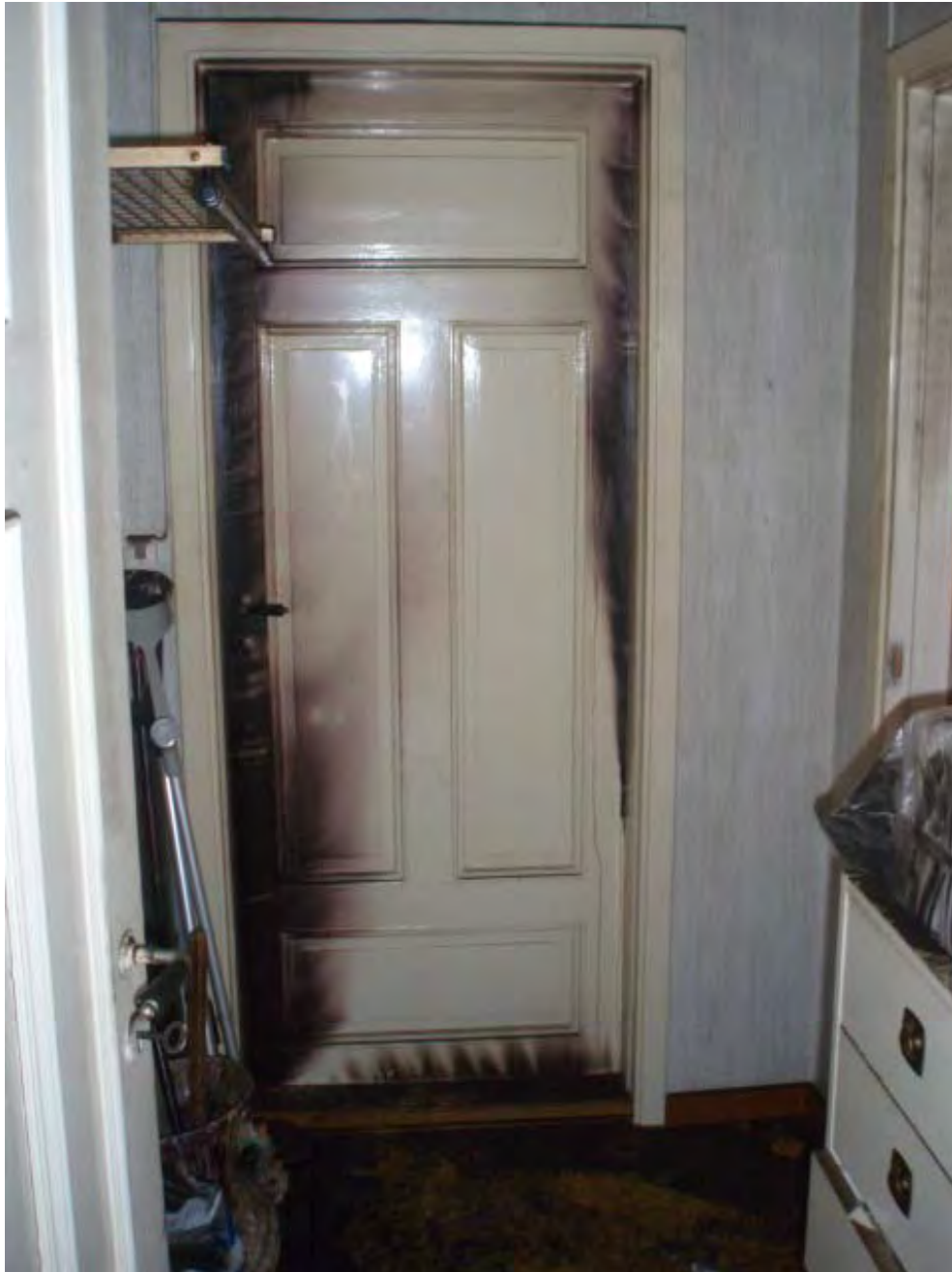
Bild 8: Stängd dörr mot hallen från vardagsrummet. Inträngning av brandrök från övertrycket i hallen.