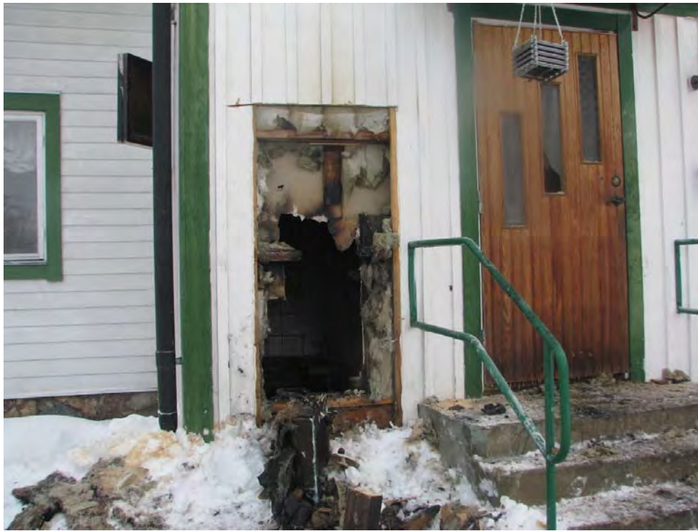
Bild 2: genombränning av yttervägg samt innenväggen entrédörren till höger.