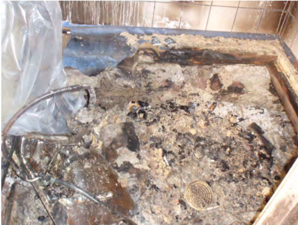
Bild 5: Badrumsgolvet med vattenledningarna till vänster mot ytterväggen