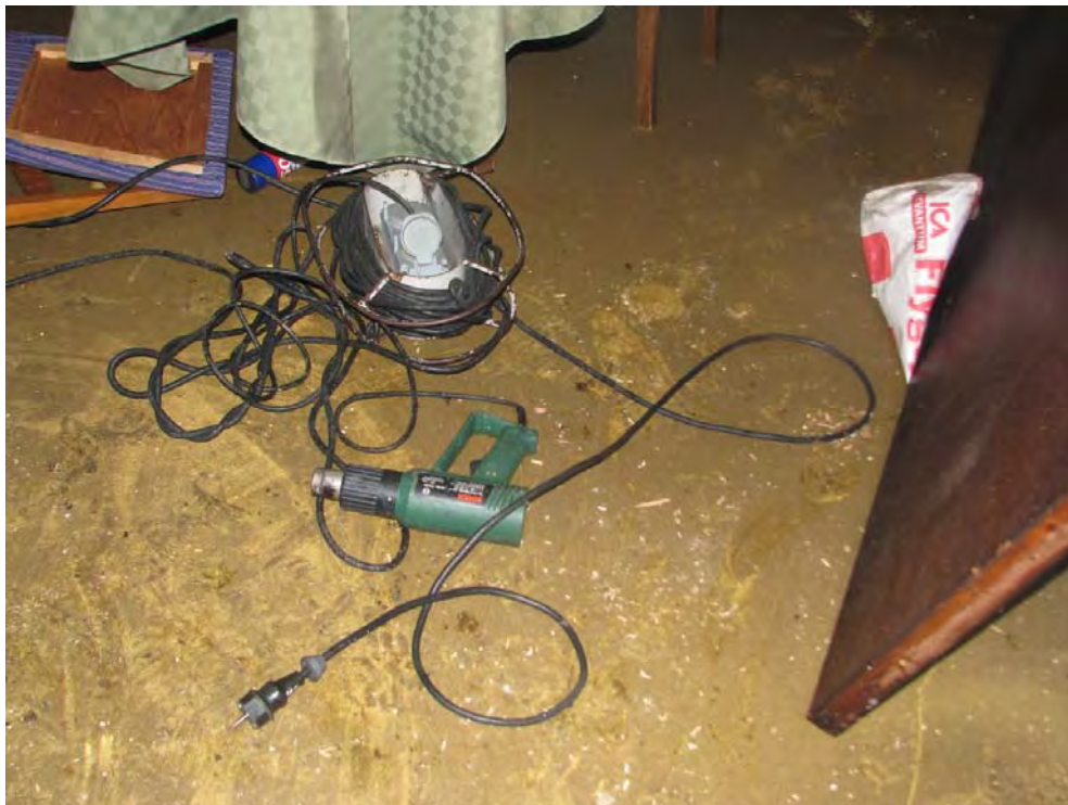
Bild 10: Varmluftpistolen ligger på köksgolvet ansluten till grenkontakt-