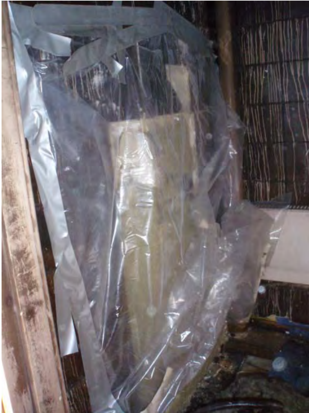
Bild 7: Badrumsväggen mot ytterväggen. På denna vägg satt handfatet.