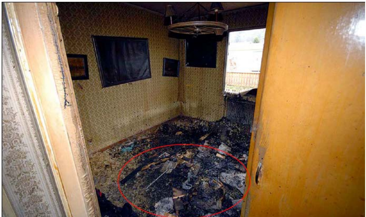
Bild 4: Samma rum efter friläggning. En bränning ses i golvet, se markering.