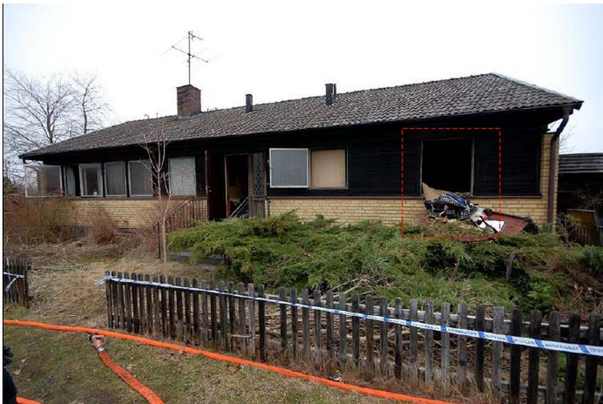
Bild 1: Villan som brunnit. Mannen återfanns och branden har börjat i rummet innanför det markerade fönstret.