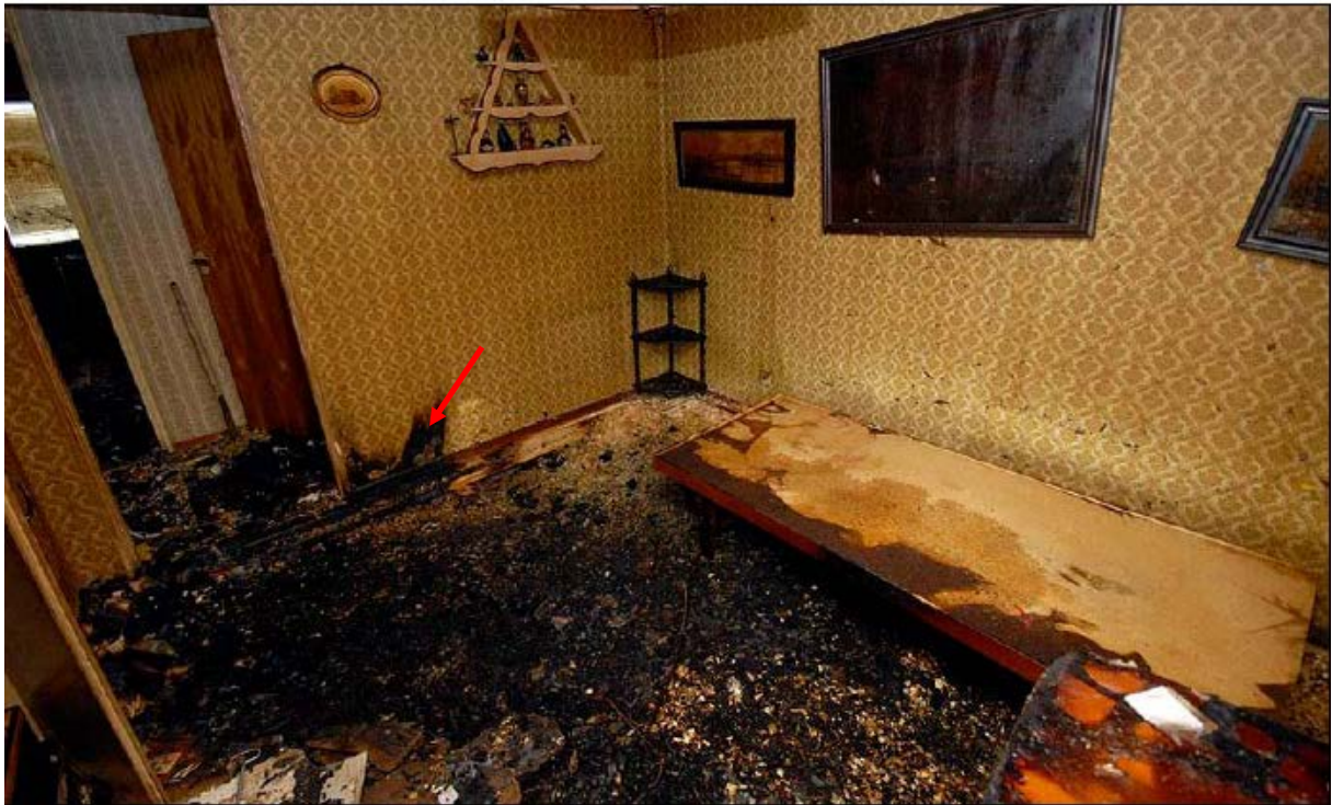
Bild 5. Samma rum med sängen och vissa möbler återplacerade efter rökning. Notera brandspridning in i väggen vid pilen.