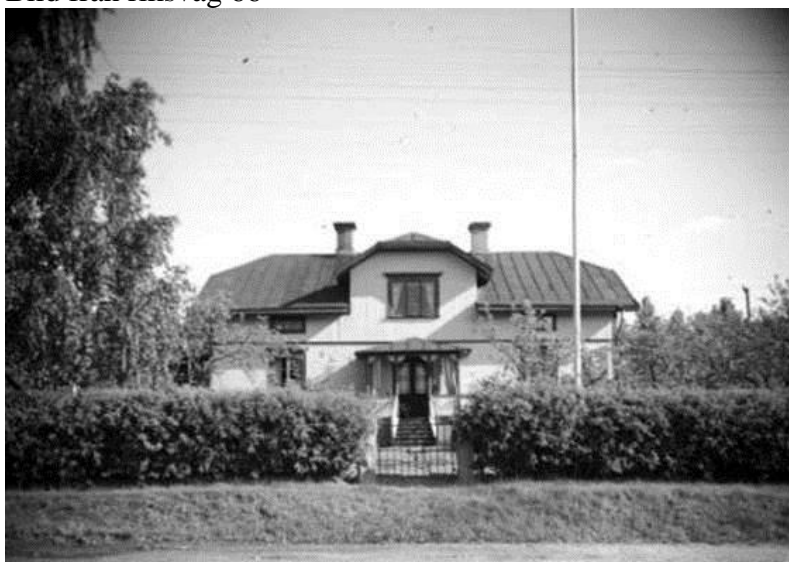
Bild från riksväg 66