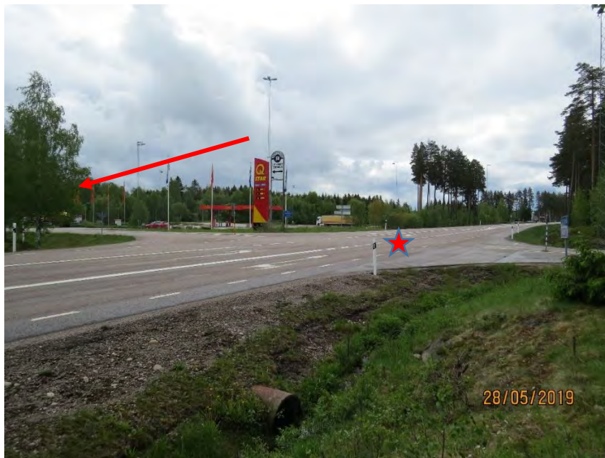
BILD 1: röda stjärnan visar olycksplatsen. Röda pilen visar björkarna som delvis skymmer sikten i korsningen.

Vägbanans beläggning är asfalt som var torr och det fanns inga hål, ojämnheter eller annat i vägbanan som bedöms haft någon inverkan på olyckan. Vägmarkeringar i form av vita vägstreck är något utnötta och kan förbättras. skyltning var i gott skick. Några björkar som står i diket skymmer delvis sikten i korsningen från det håll personbilen kom (se bild 1).