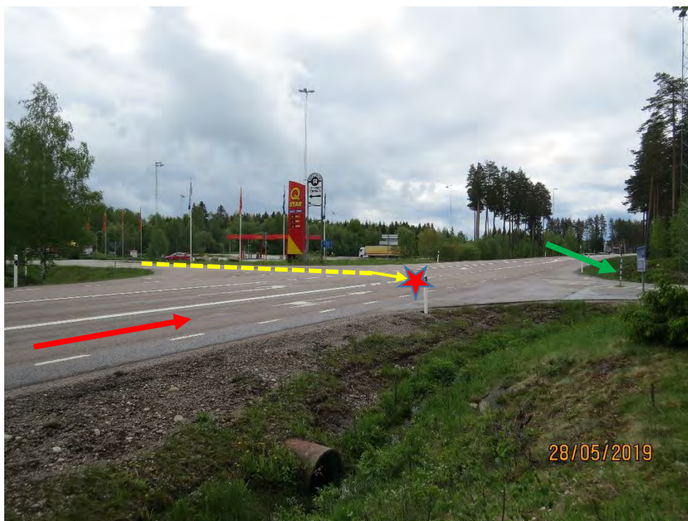
Bild 3: Röda pilen visar från vilket håll lastbilen kom och gula streckade linjen visar var personbilen kom ifrån. Röda stjärnan visar kollisionplatsen. Gröna pilen visar personbilens slutläge.