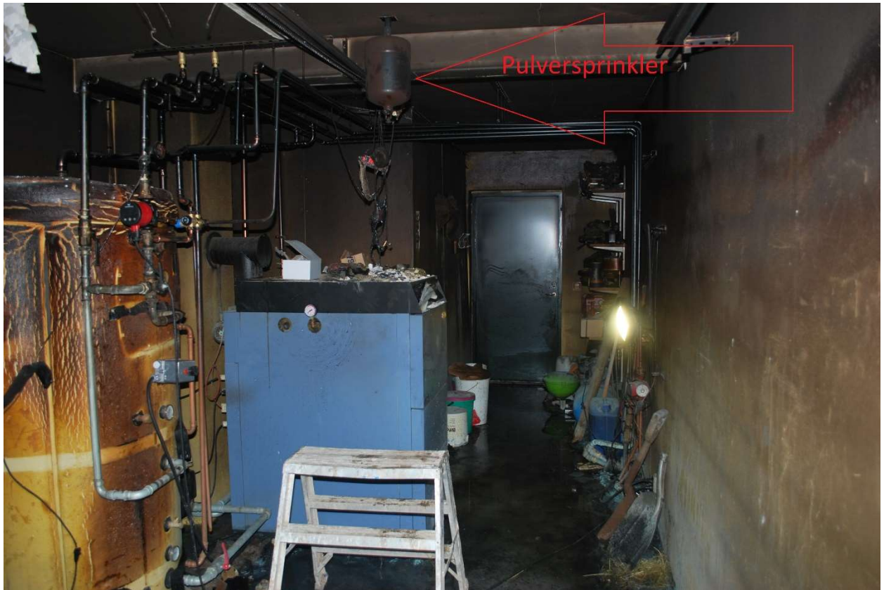
Foto 1. Pannrummet.