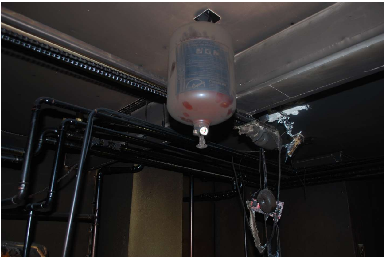
Foto 4. Utlöst pulversprinkler.