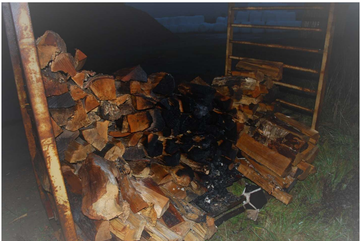
Foto 2. Vedstaplar som är uttagna från pannrummet.