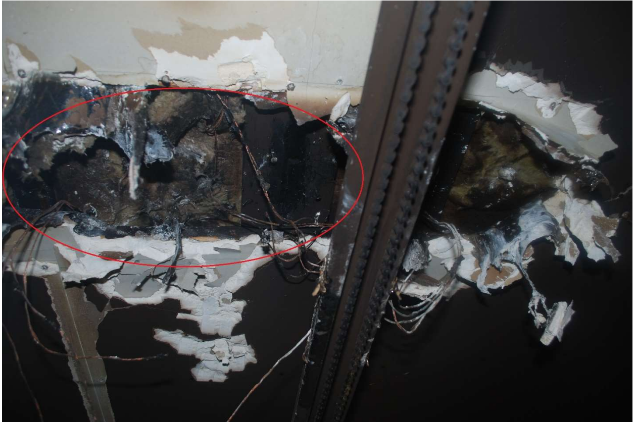
Foto 3. Taket där lysrör och utanpåliggande kopplingsdosa suttit.