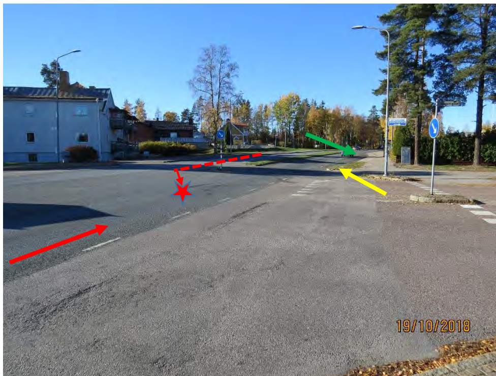
Bild 3: Röda pilen visar från vilket håll BMW: n kom och röda streckade linjen visar var Golfen kom ifrån och gör en vänstersväng. Röda stjärnan visar kollisionplatsen. Gula pilen visar golfens slutläge och gröna pilen BMW:s slutläge