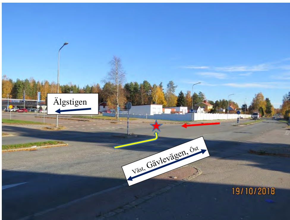
Bild 2: Röda pilen visar den väg BMW:n kommer körande. gula pilen visar Golfens vänstersväng in mot Älgstigen. Röda stjärnan visar kollisionplatsen.

Två personer färdas i en Golf på Gävlevägen österut och ska svänga vänster in på Älgstigen. I motsatt färdriktning kommer en BMW med 2 personer i och kör västerut (se bild 2). Golfen påbörjar vänstersvängen och BMW:n kör in i sidan på den. Kollisionen är mycket kraftig och golfen släpas med ca 15 meter från kollisionplatsen i BMW:s färdriktning innan den stannar. BMW:n stannar ytterligare ca 25 meter bortanför Golfen (se bild 3 och 4). en person blir fastklämd. Den fastklämda personen sitter på passagerarsidan på den bil som gör en vänstersväng.