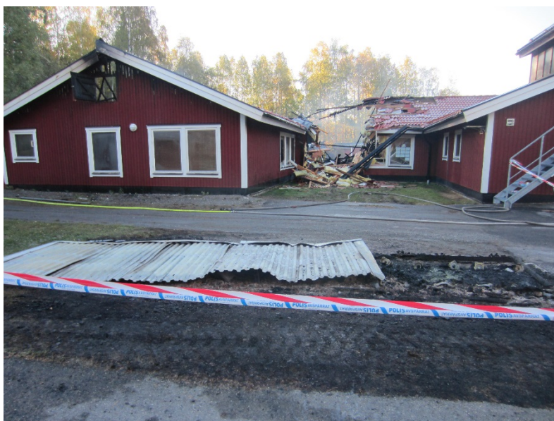
Bild 2 .I förgrunden, resterna av förrådet. Vid länken ser vi begränsningslinjen som gjordes med grävare.