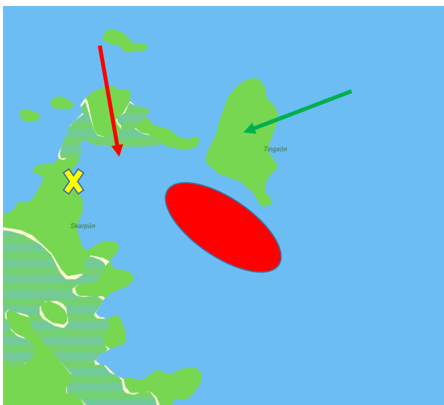
Bild 1: Den röda pilen visar var båten hittades. Det gula krysset visar var den drunknade personen hittades. Gröna pilen visar ön som den ena personen lyckades simma till. Det röda området är troligen den plats där båten kapsejsat.

Den drunknade personen hittas senare i strandkanten på Skarpön (se bild 1).