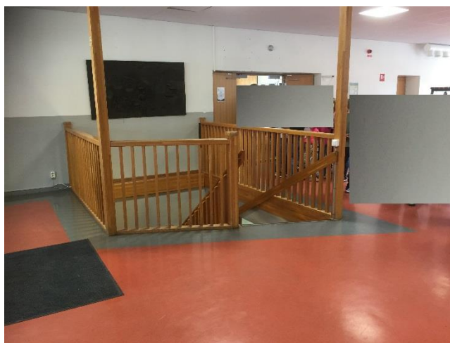
Trappans förbindelse med Plan 1. Matsalsdörr till höger om trapp.