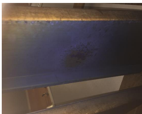
Sotavlagringar under trappsteg.

Rökutvecklingen som skedde visar på att bengalen var placerad på en sårbar plats av byggnaden. Om en brand skulle uppstå där så slår den snart ut den primära utrymningsvägen.