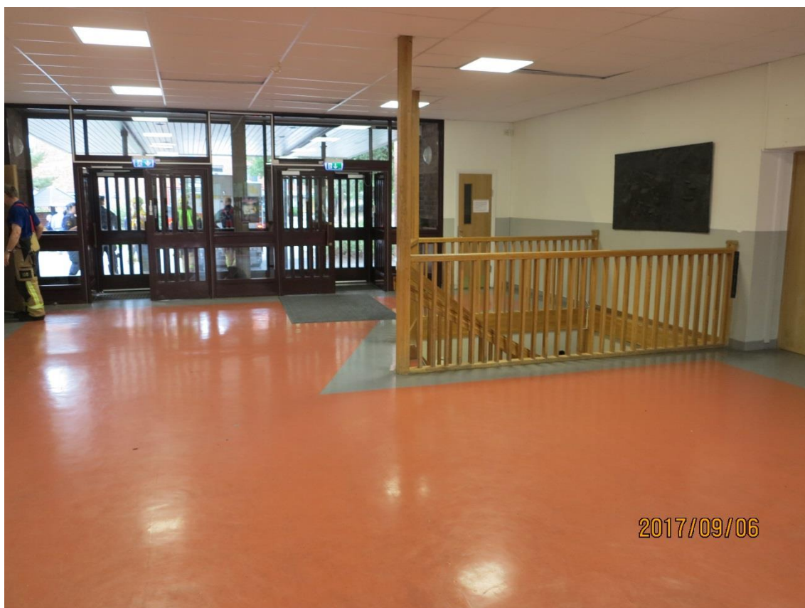
Entrén, trappan och dörren längst till höger är ingången till matsalen

Klockan 10:50 2017-09-06 är det lunchtid på Källängens skola och matsalen med kapacitet för 200 personer är nästan full. Då placerar någon en pyroteknisk produkt/bengal på golvet under trappen på plan 0 och tänder den. Personal som utgör matvakter ser att blå rök väller upp från trappen och beslutar att matsalen ska utrymmas. Eleverna utrymmer från matsalen via huvudentrén och kökspersonalen via den alternativa utrymningsvägen i andra ändan av matsalen. Under utrymningen ökar rökutvecklingen i entréhallen och många elever utrymmer då genom den röksmittade entrén.