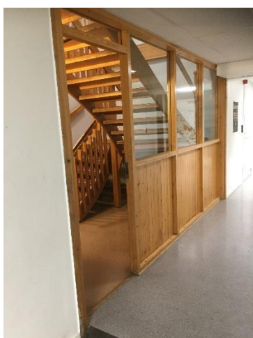
Plan 0. Foto från korridor mot trapp.

Plan 1 och plan 0 förbinds med en trapp som är belägen mellan huvudentrén och ingången till matsalen. Byggnadens huvudentré på plan 1, är brandtekniskt avskild till matsal och till korridor mot lektionssalar. På plan 0 är korridor till lektionssalar brandtekniskt avskild mot trappan. Matsalen har två av sig oberoende utrymningsvägar.