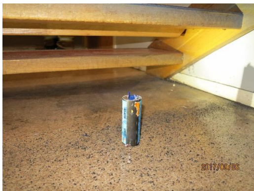
Bengalens placering under trappsteg 2.

Bengalen placerades och antändes under trappen på plan 0. Rökutvecklingen som följde påverkade den primära utrymningsvägen för lokalerna på plan 1 negativt. Bengalen stod under ett trappsteg av trä som fick sotavlagringar vid händelsen.