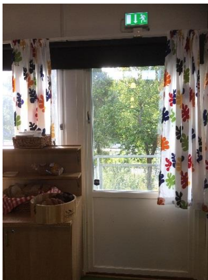
Alternativ utrymningsväg matsal.

Ett bättre alternativ i det här och liknande scenario hade varit att utrymma entréhallen, stänga dörrarna till matsalen och utrymma matsalen via matsalens alternativa utrymningsväg. Den alternativa utrymningsvägen kan även tydliggöras bättre för skolpersonal och elever. Idag står bord och brödvagn nära dörren och gardiner finns som kan dras för denna.