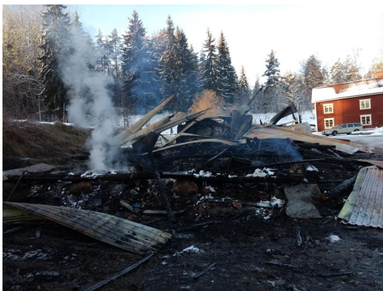
Boningshus i bakgrund