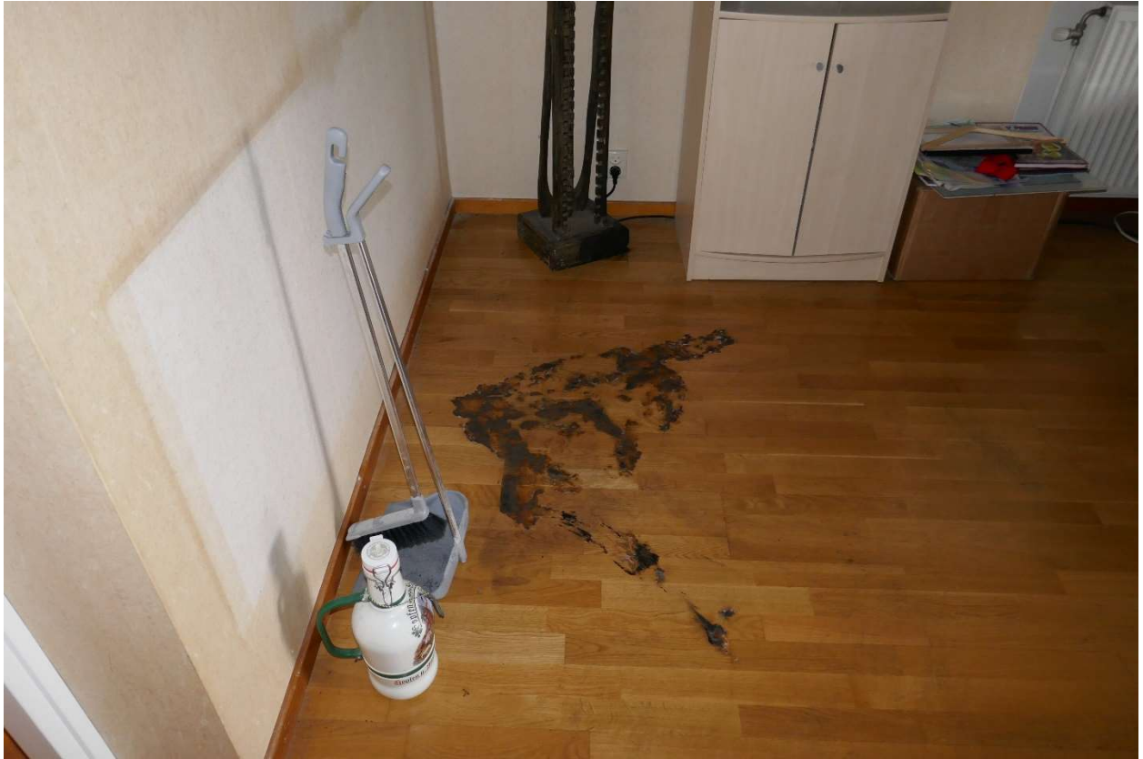
Foto 2. Brandskador i vardagsrummet.