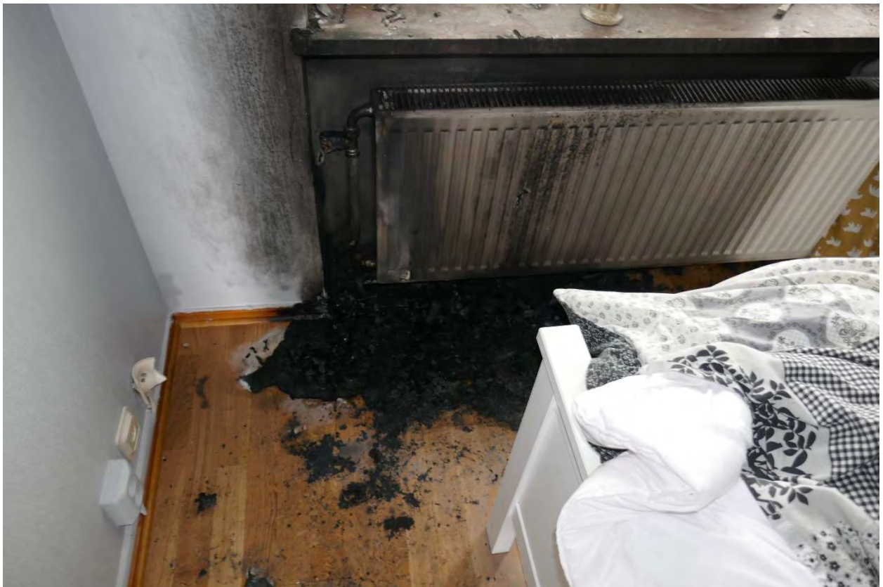
Foto 3. Brandskador på vägg och golv i sovrummet.