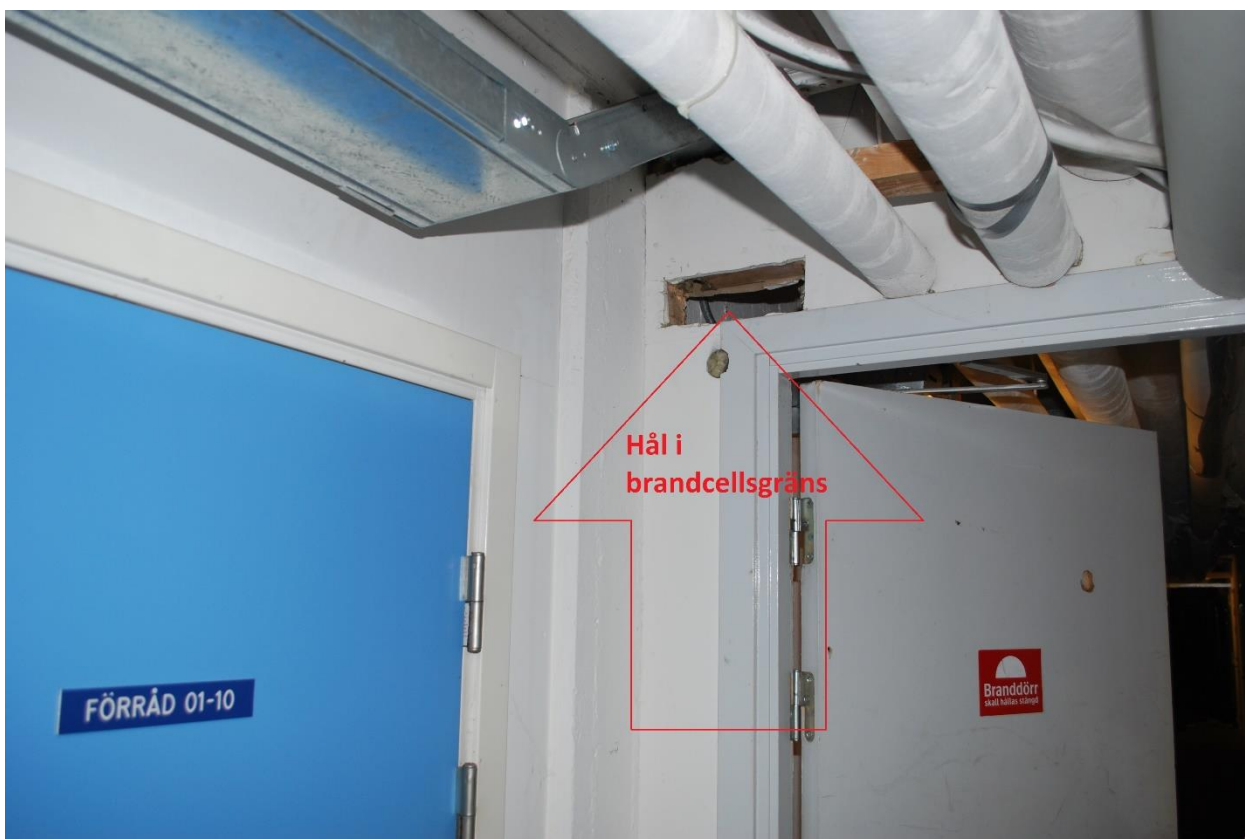
Foto 4, i källaren fanns flertalet hål i brandcellsgräns.