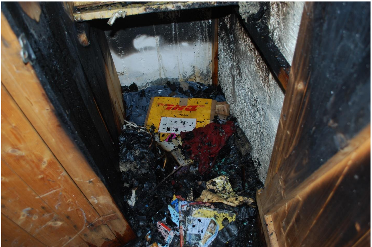
Foto 2, brandskador i förråd.