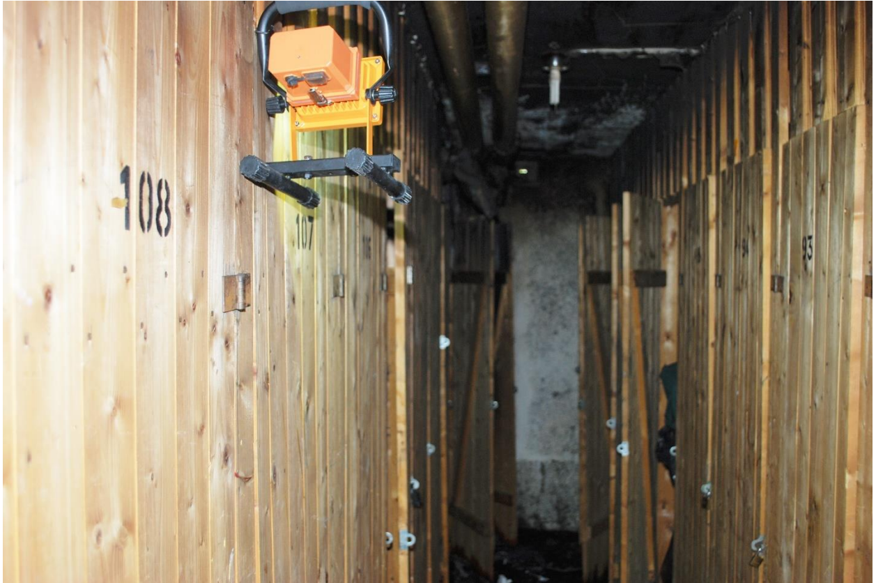
Foto nr 1, källarförråd. Kraftigast brandskador finns förrådet längst in till vänster.