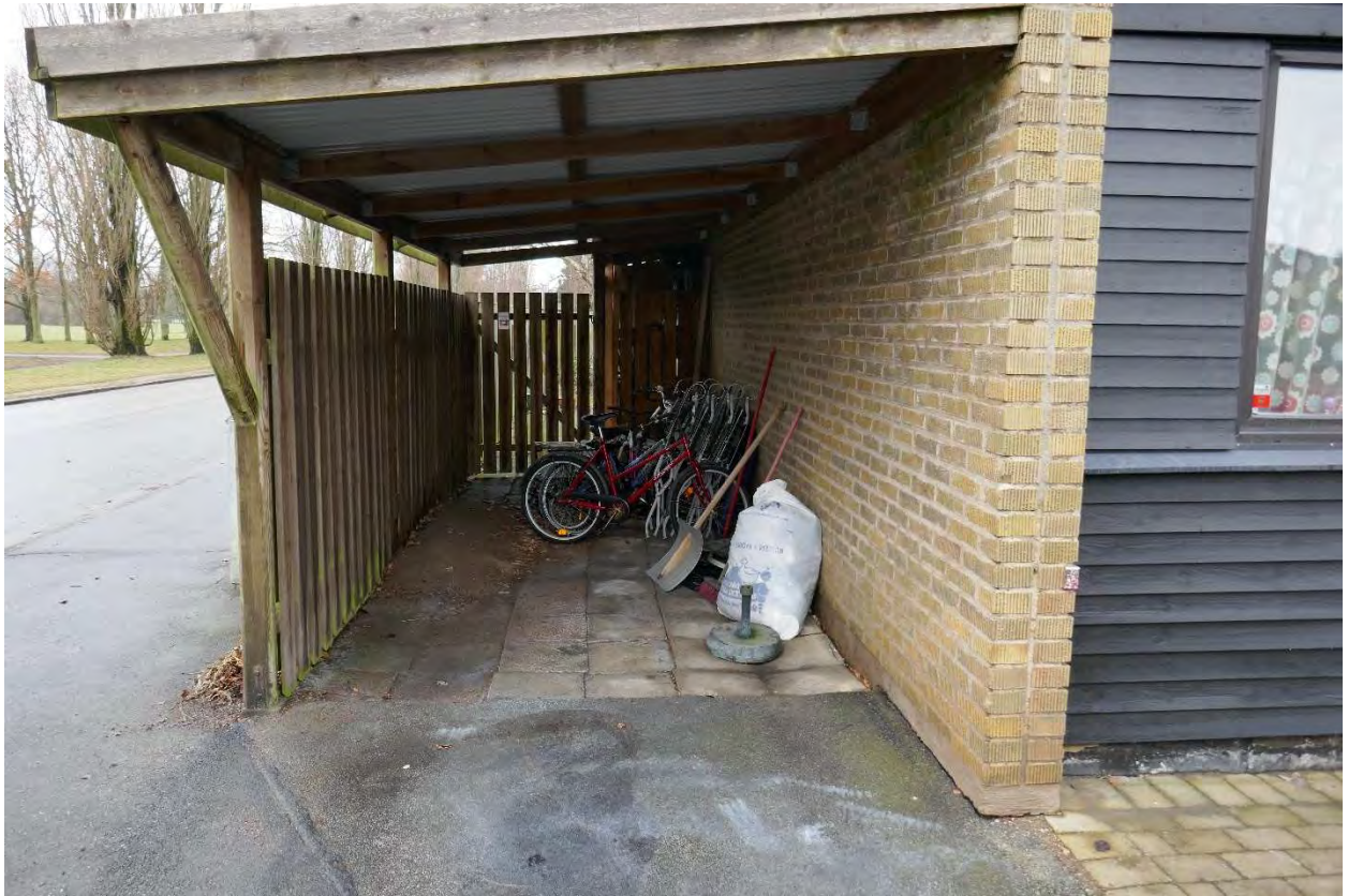
Bild 3. Carporten och husfasaden som klarade sig ifrån skador