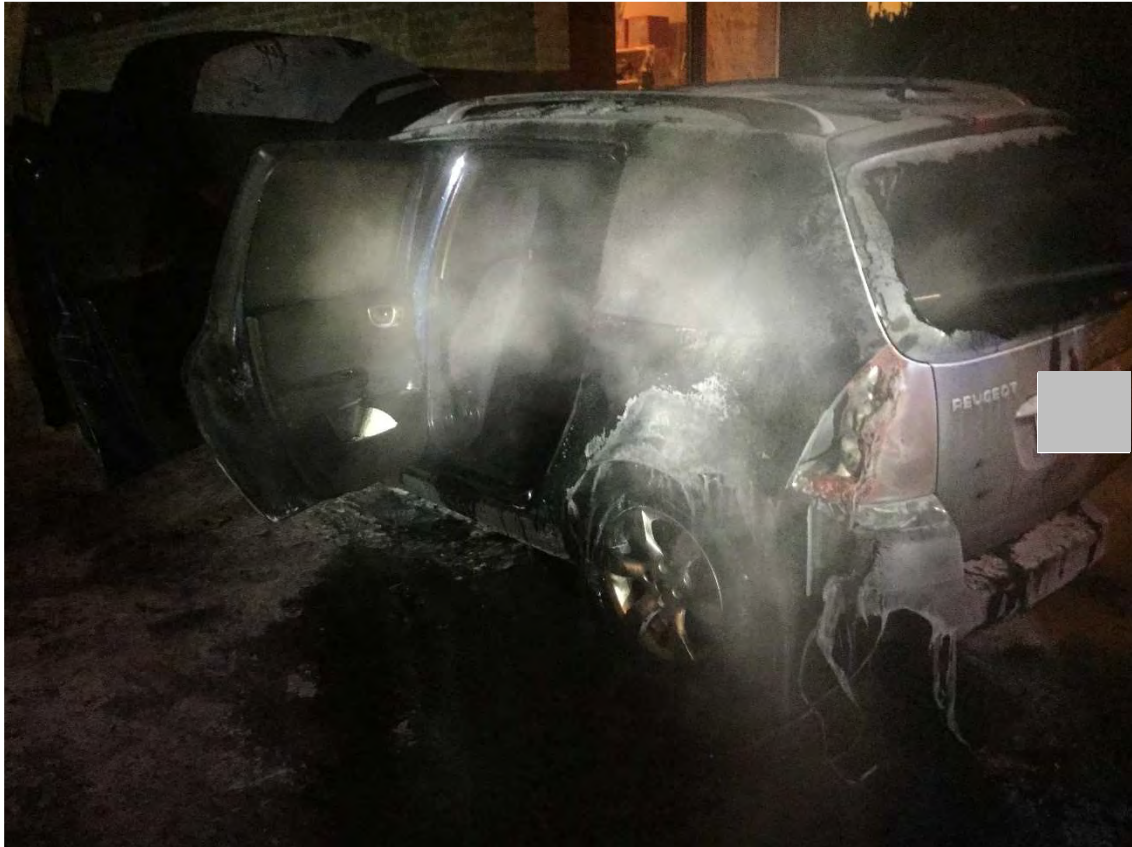
Bild 1. Bilen som stod utanför carporten och där branden var vid vänster hjulhus.