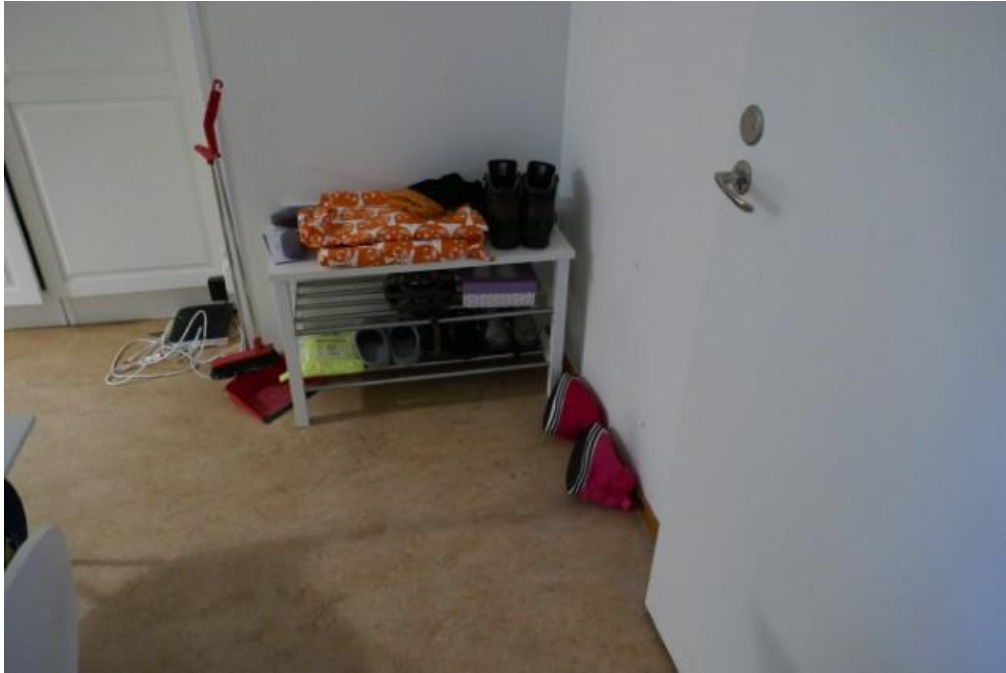
Bild 1. Skohyllan med brännbart material.