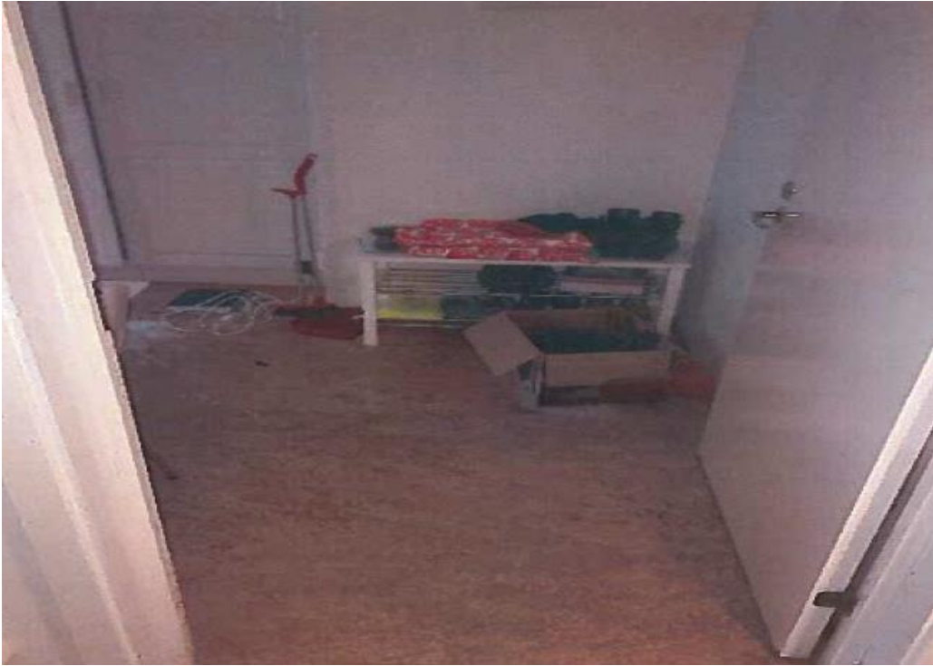
Bild 3. Kartongen framför skohyllan.