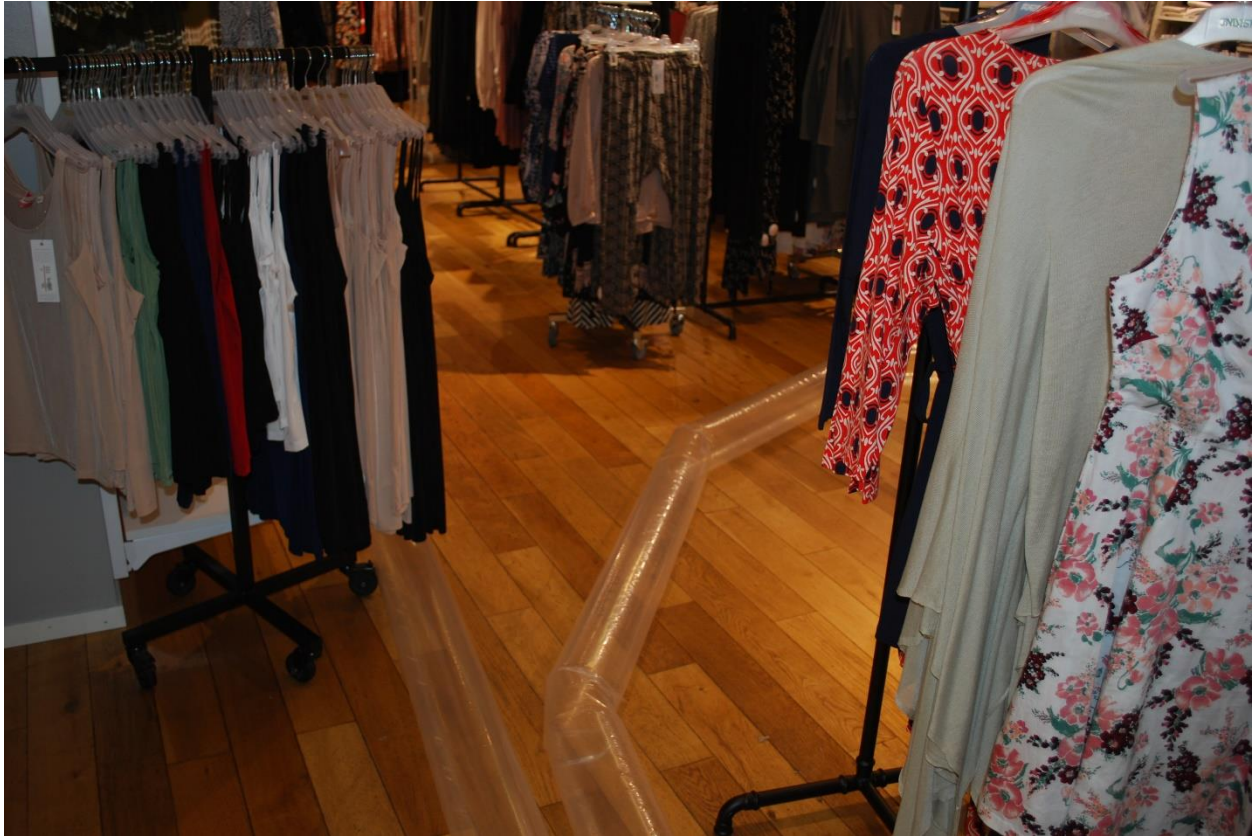
Foto 3. Det massiva trägolvet på Indiska måste bytas ut med stopp i försäljningen som följd.