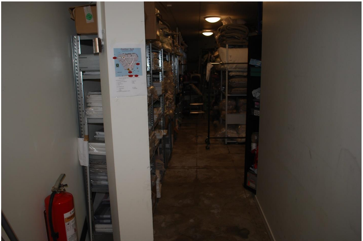
Foto 2. Lagret på Hemtex har fått vattenskador i väggarna.