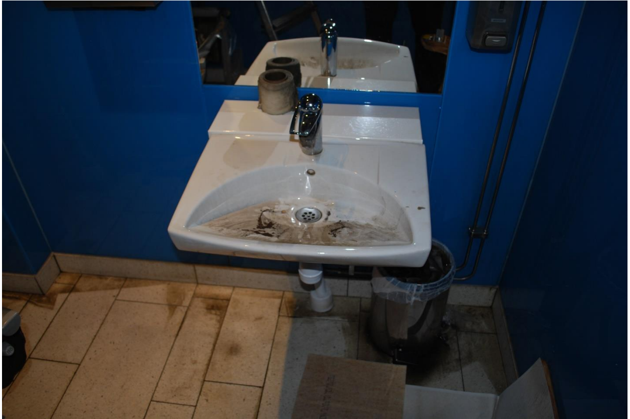
Foto 1. Brand i handfatet inne på toaletten.