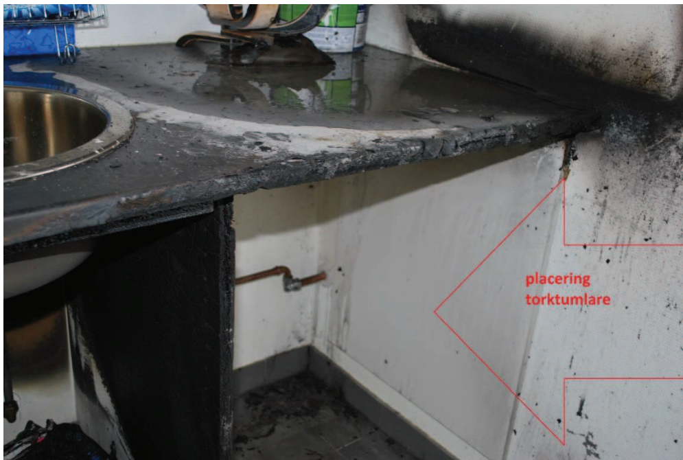
Foto 2, placering torktumlare