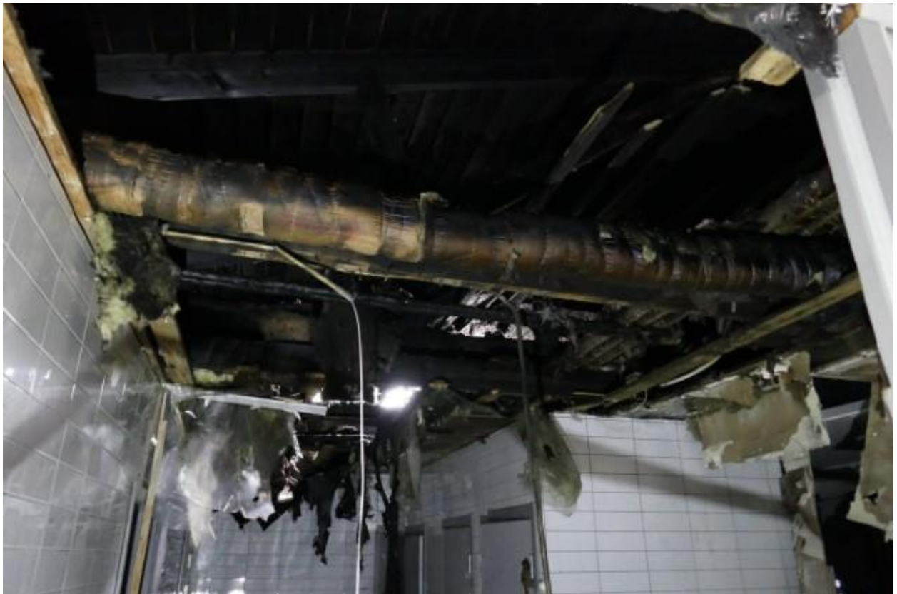
Foto 4. Brandskador i duschutrymme.