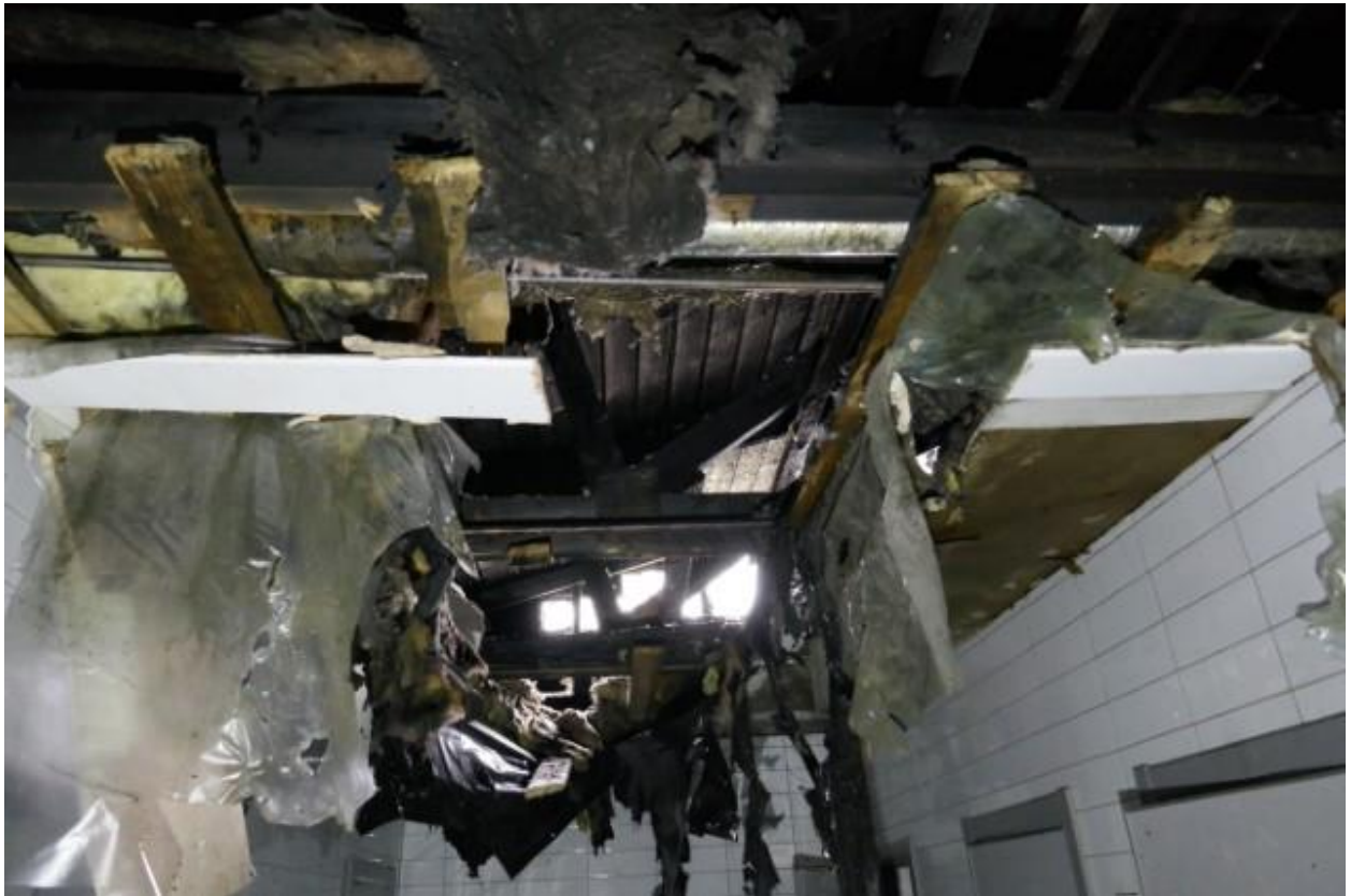
Foto 5. Brandskador i duschutrymme.