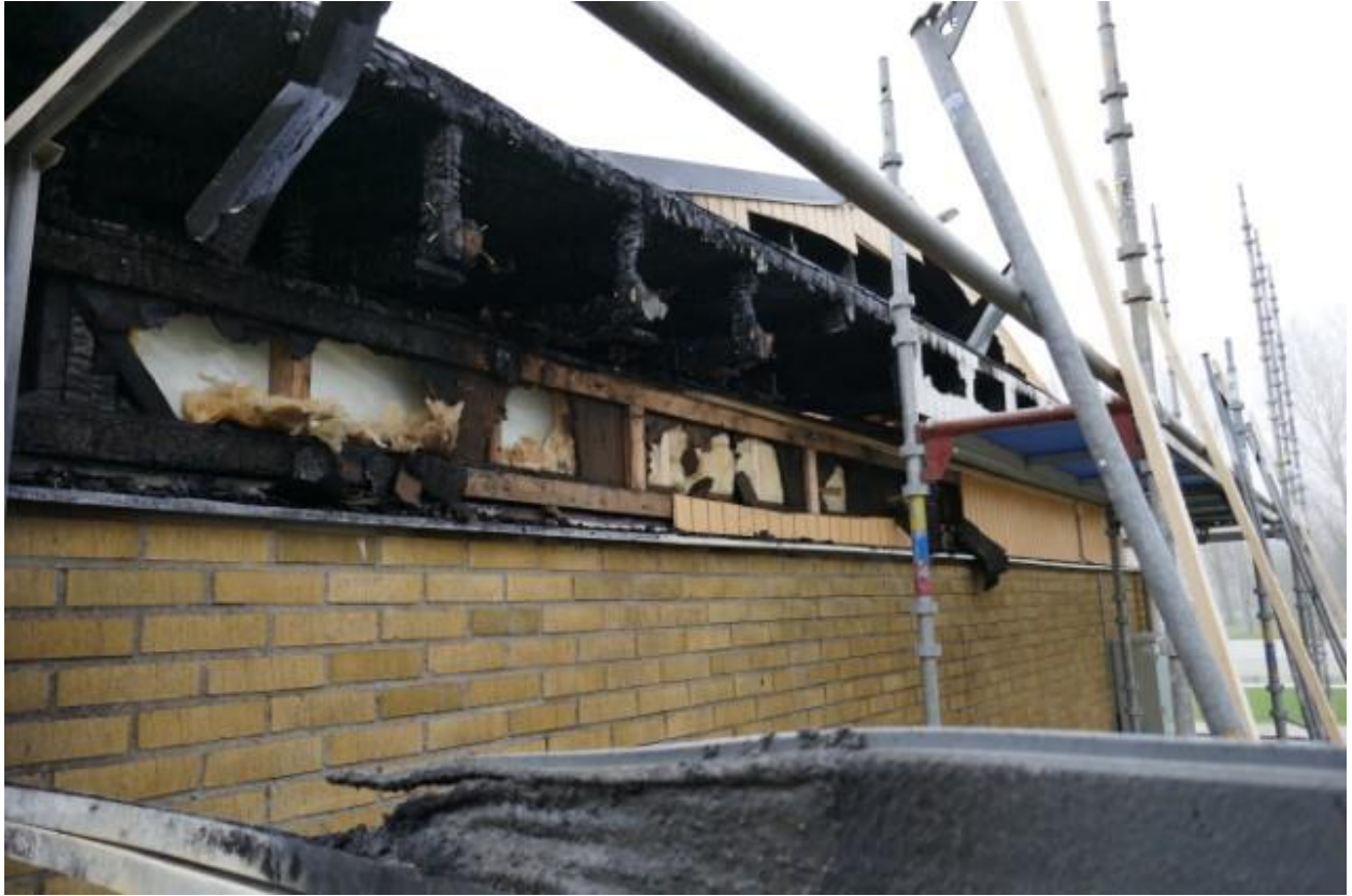
Foto 1. Brandskador i takfoten längs den södra gaveln.