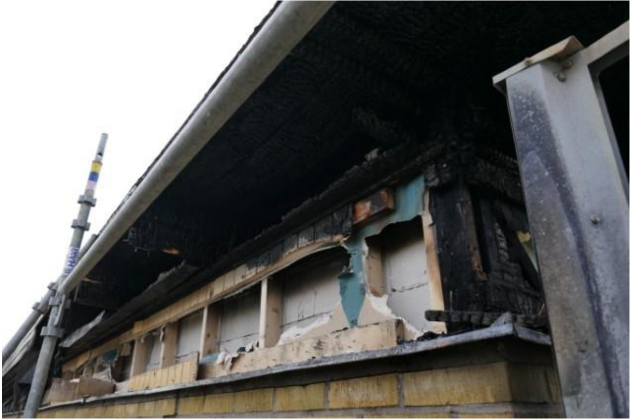
Foto 3. Brandskador i takfoten på den södra gaveln.