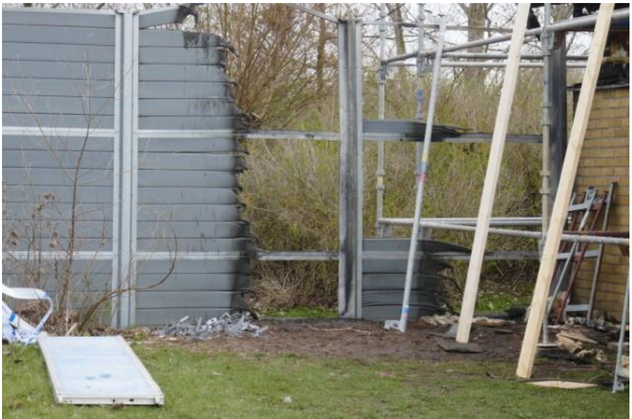
Foto 6. Brandskador på plank placerat nära byggnaden.