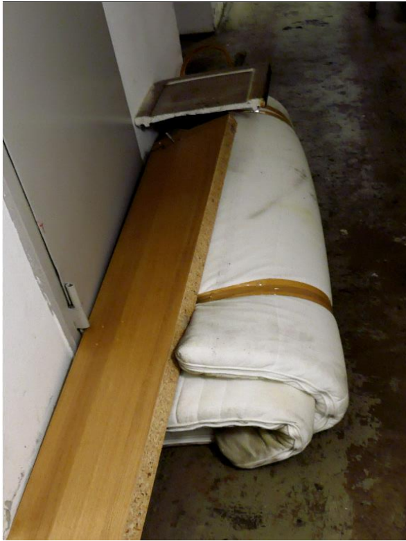
Foto 1. Madrass placerad utanför förrådet.

Källhänvisning Insatsrapport 2017/02461 Polisrapport 5000-K518565 Intervju med styrkeledare.