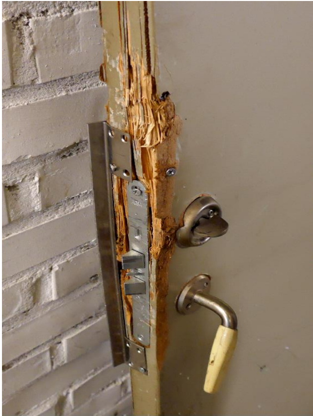
Foto 3. Brytskador på dörr in till förrådet.