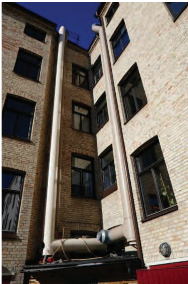
Foto 5. Röckkanalen löper längs fasaden på innergården.