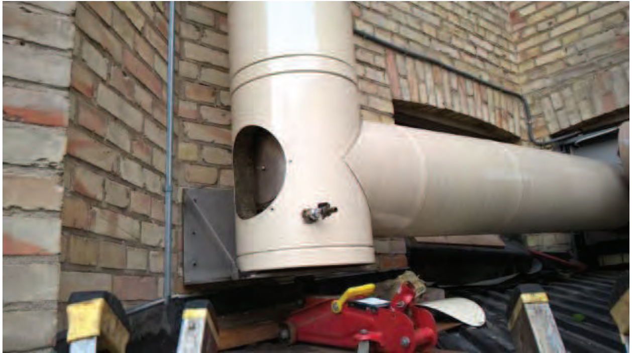
Foto 4. Inspektionsluckan i den nedre delen av röckkanalen.