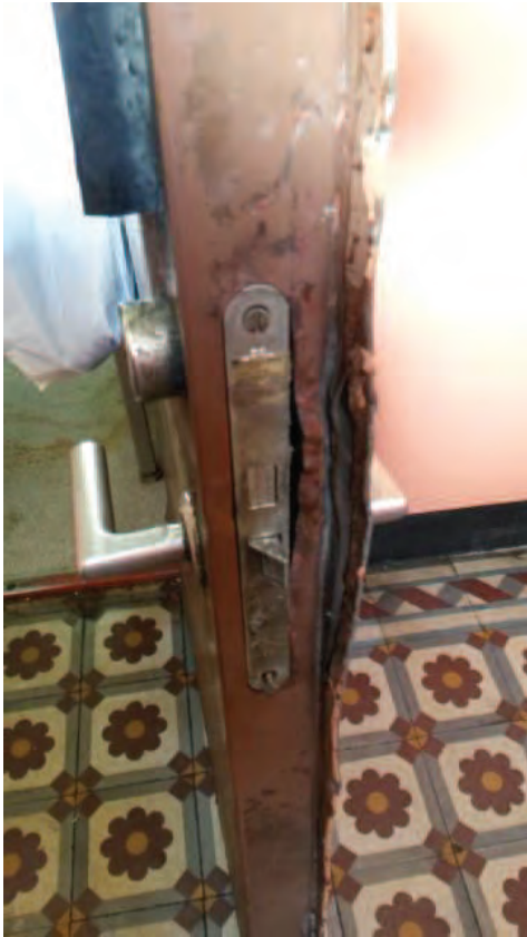
Foto 2. Dörren mellan restaurangen och trapphuset hade brytskador vilket innebär att dörren troligen är otät.