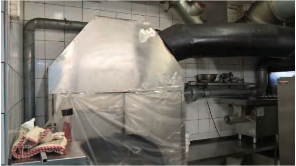
Foto 6. Kolgrillen i köket.