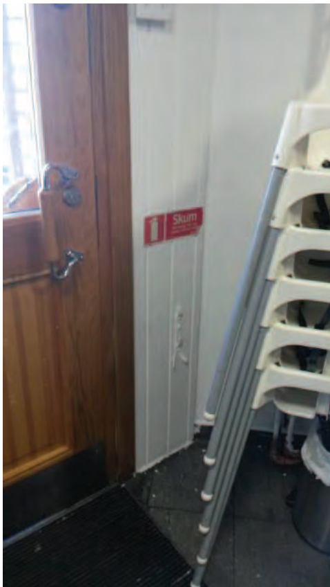
Foto 3. Handbrandsläckare saknades vid entrén till restaurangen.