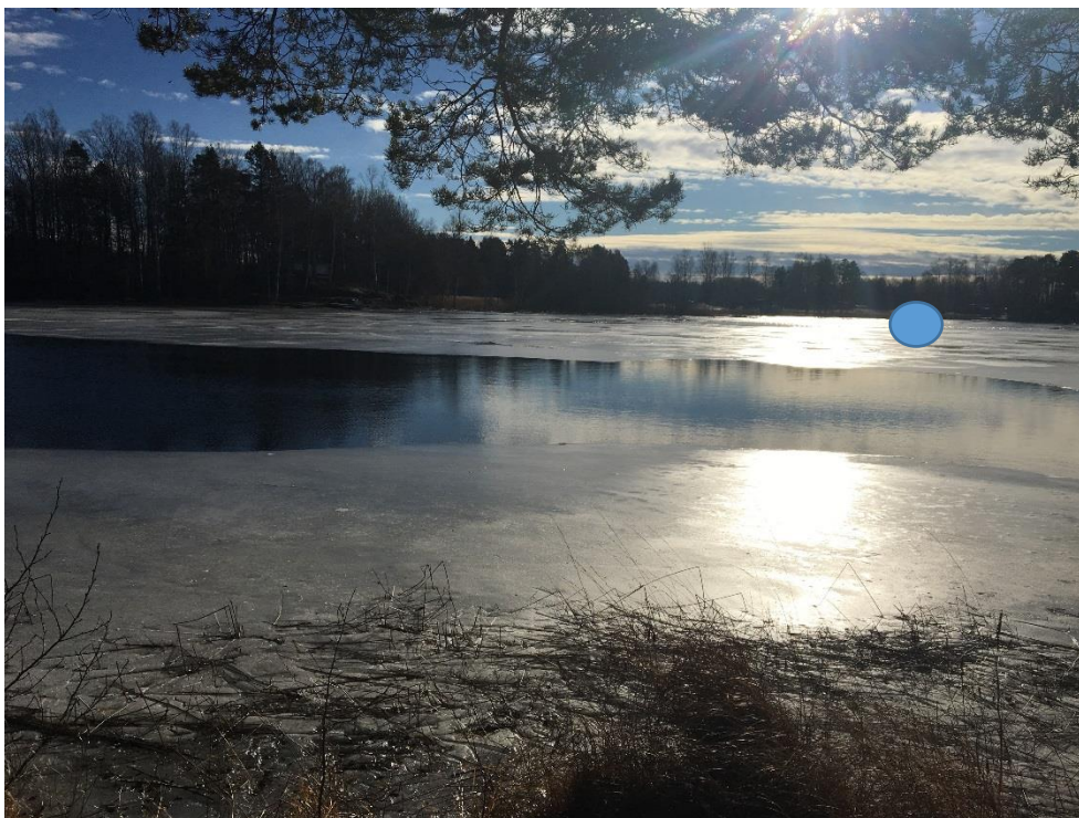
Bild 2: Den blåa ringen visar platsen där fyrhjulingen och mannen hittas.