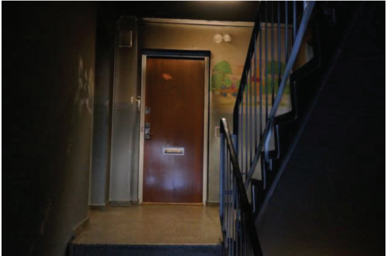
Bild 4. Sotskador på väggarna på bottenvåningen.