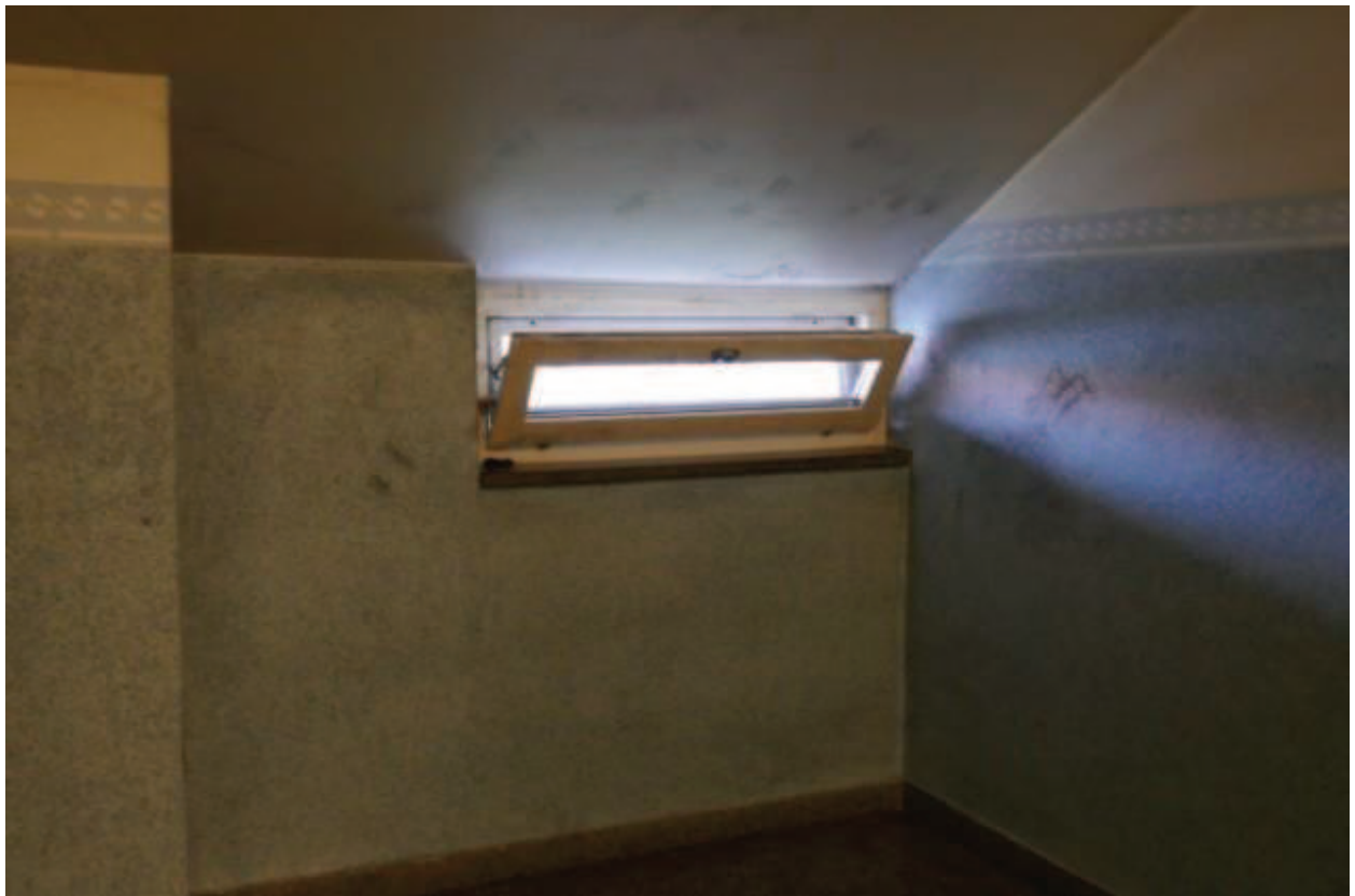
Bild 5. Det lilla fönstret på våning fyra.