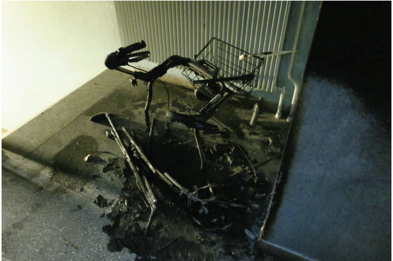
Bild 1. Brandskadad rullator placerad i trapphuset på bottenvåningen.