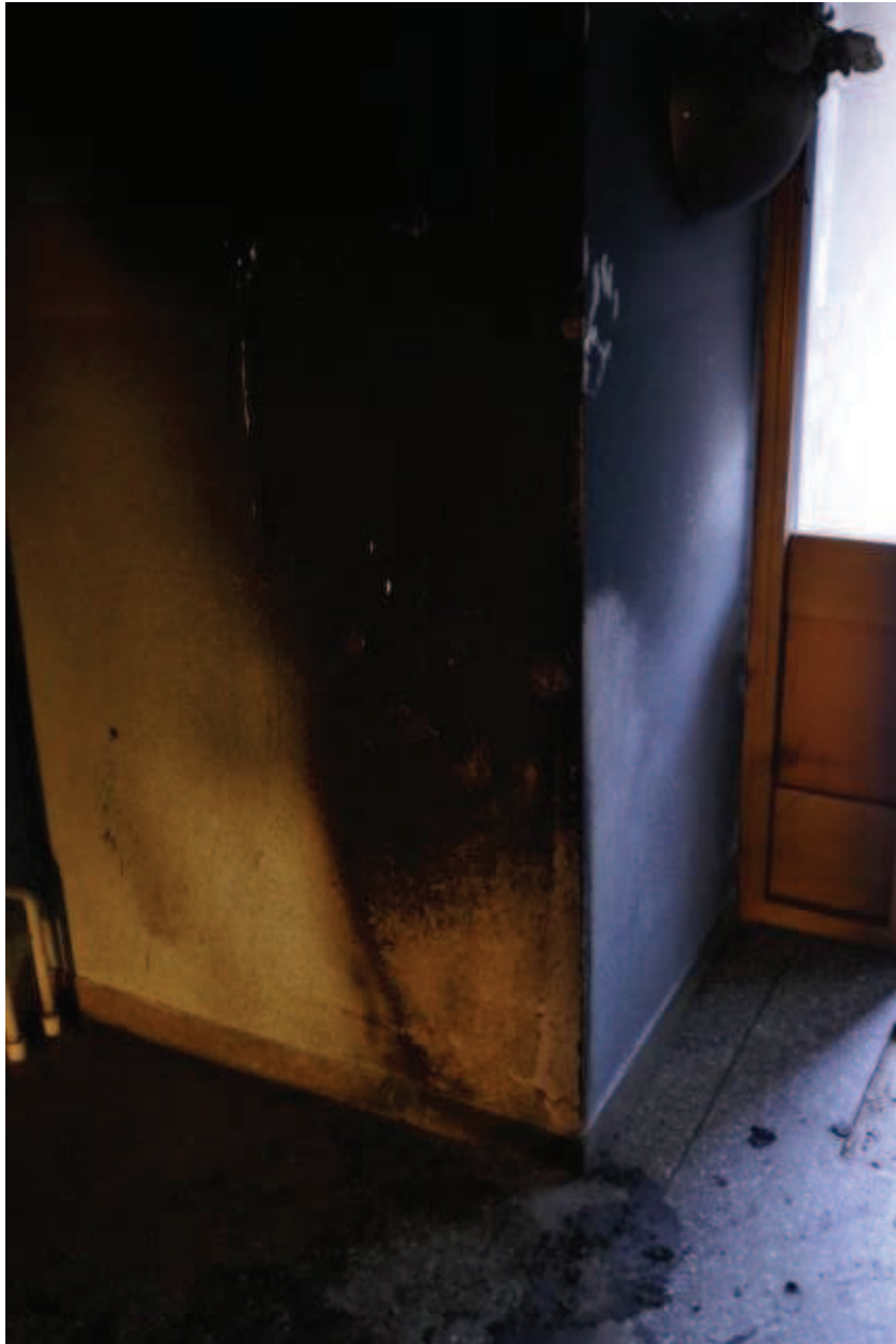
Bild 3. Brand- och sotskador på vägg i trapphuset där rullatorn stod placerad.