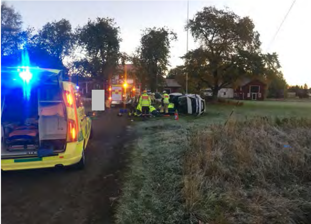
Bild från olycksplatsen