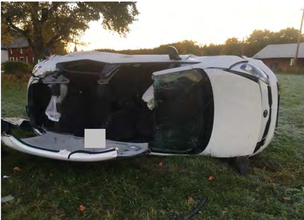
Bild från olycksplatsen