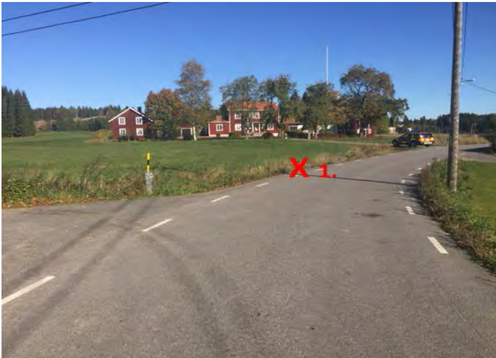
X 1. = Avkörningsplats