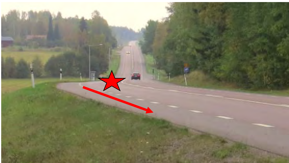
Bild 2: Röda stjärnan visar den plats där omkörningen sker och röda pilen den väg mc:n kör.

Det är islaget vid avfartsvägen och landningen ute på åkern som troligen skapar de omfattande inre skadorna på föraren, vilket leder till att han omkommer.