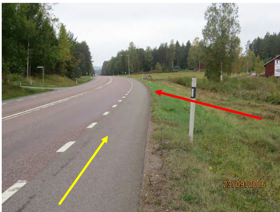
BILD 1 visar olycksplatsen där röda pilen visar var mc:n kör av vägen och den gula pilen visar vilket håll mc:n kom ifrån.

Olycksplatsen ligger i en svag vänstersväng från det håll som mc:n kom körande (se bild 1).