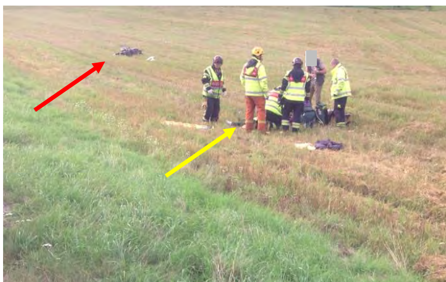
Bild 4: Röda pilen visar motorcykelns placering och gula pilen mc-förarens placering.