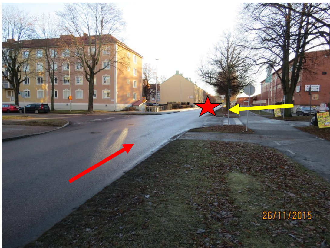
Bild 1: Den röda stjärnan anger olycksplatsen och röda pilen visar varifrån personbilen kom körande och gula pilen visar var den gående med barnvagnen kom ifrån.