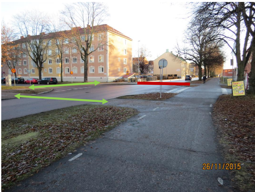
Bild 5: gröna pilarna visar var övergångsställen kan göras och röda strecket är den del som kan tas bort med gräsmatta och förhöjda kantstenar.