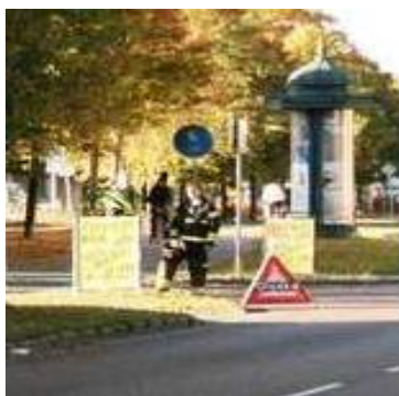
Bild 2: visar placeringen av reklamskyltar.